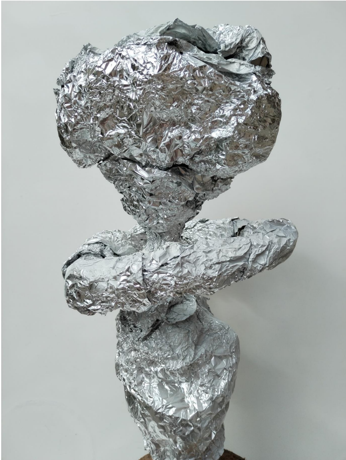
Fat Man, detailj