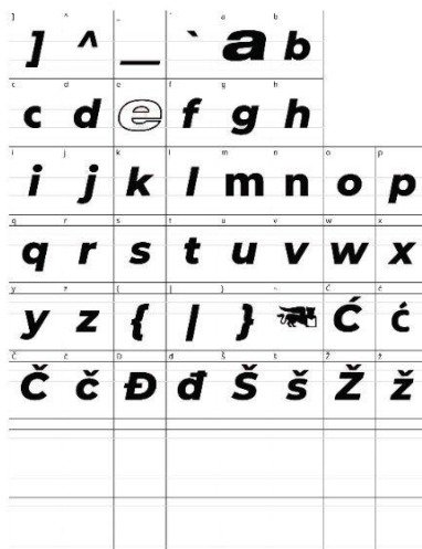
_Izmicanje logotip, varijacije