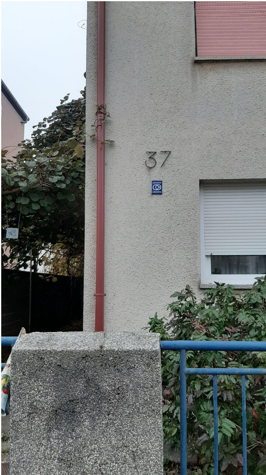
fotografije plakata kazališta, i signalizacija adresa