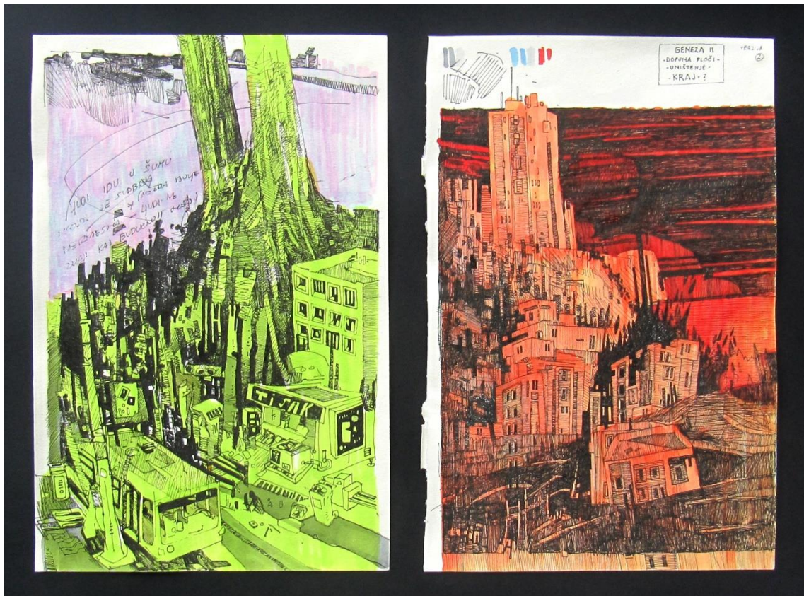
Slika 10: Skice za središnju ploču; kombinacija oba prikaza iskorištena je kao rješenje na velikom formatu