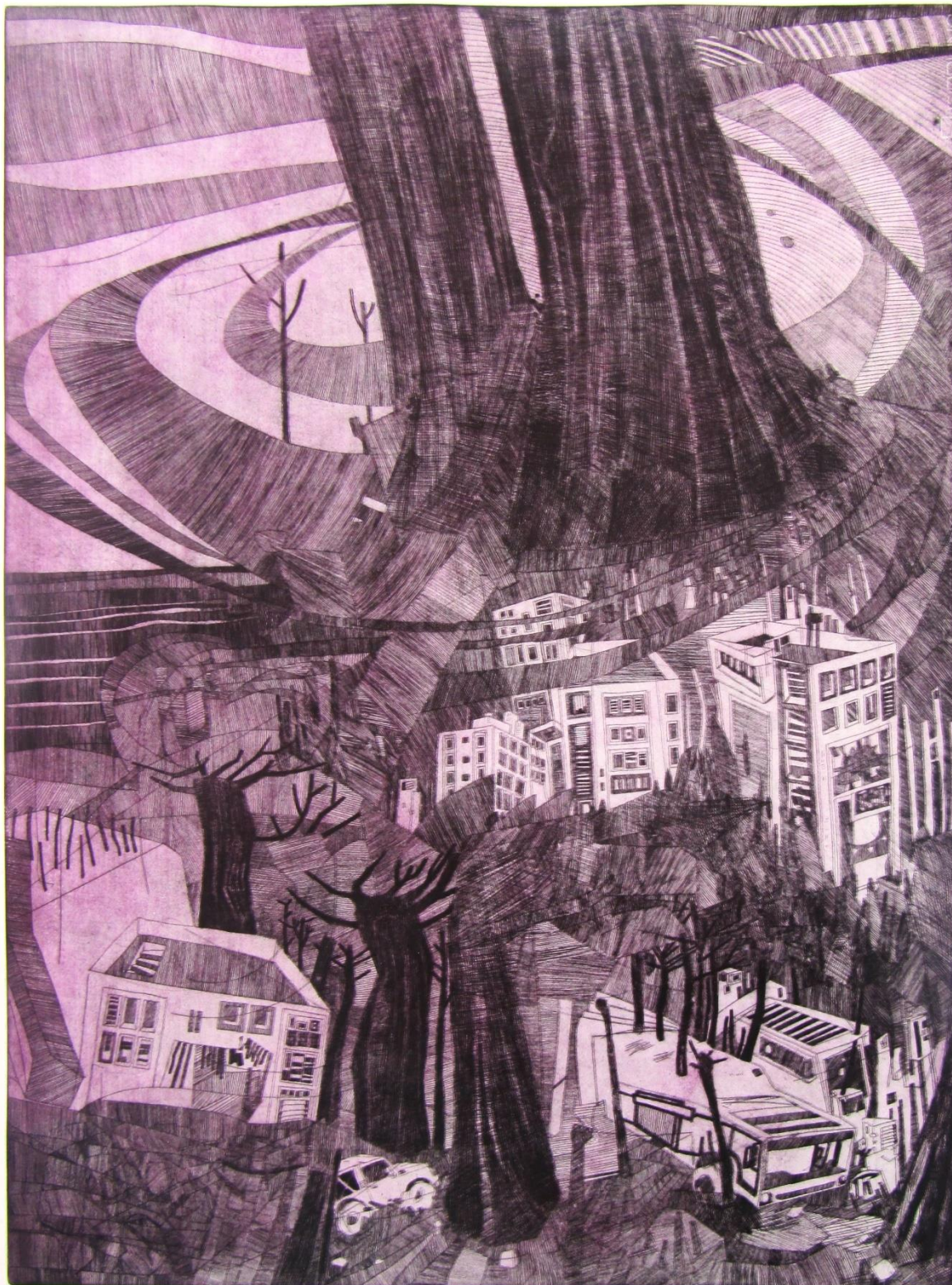
Slika 4: Druga ploča