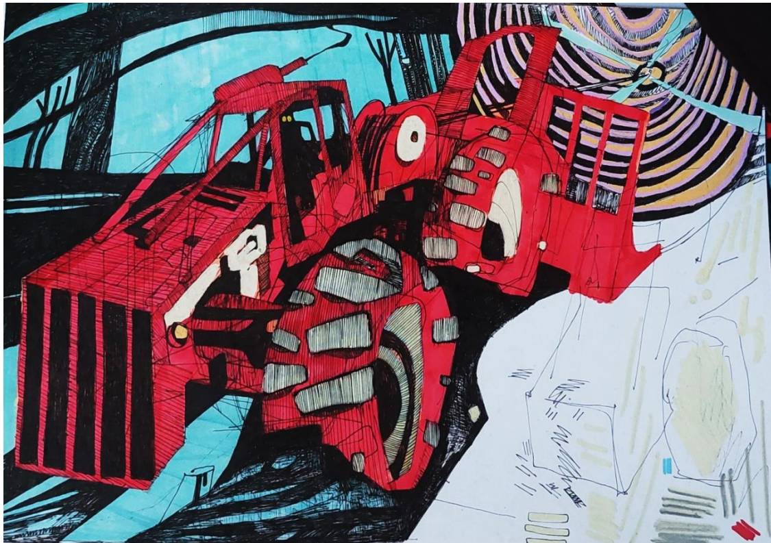
Slika 9: Skider; skica za prvu ploču