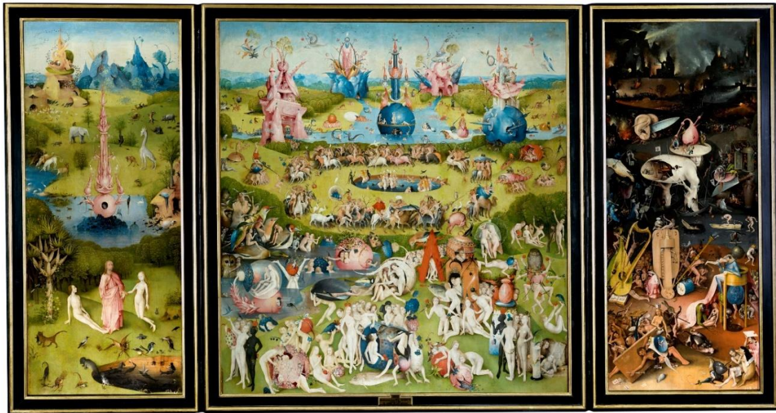
Slika 1: Hyeronimus Bosch, Vrt zemaljskih naslada , oko 1500. godine, ulje na dasci, 205.5 cm × 384.9 cm, Museo del Prado, Madrid

Diplomski rad je izveden u dubokotisnoj tehnici bakropisa 4 i suhe igle 5 te se sastoji od tri velike kompozicije. Rad je nadahnut triptihom 6 Hyeronimusa Boscha, 7 Vrtom zemaljskih naslada , datiranog oko 1500. godine (slika 1).