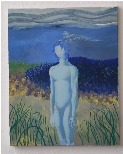
„Vjetar“, ulje na platnu, 50x40