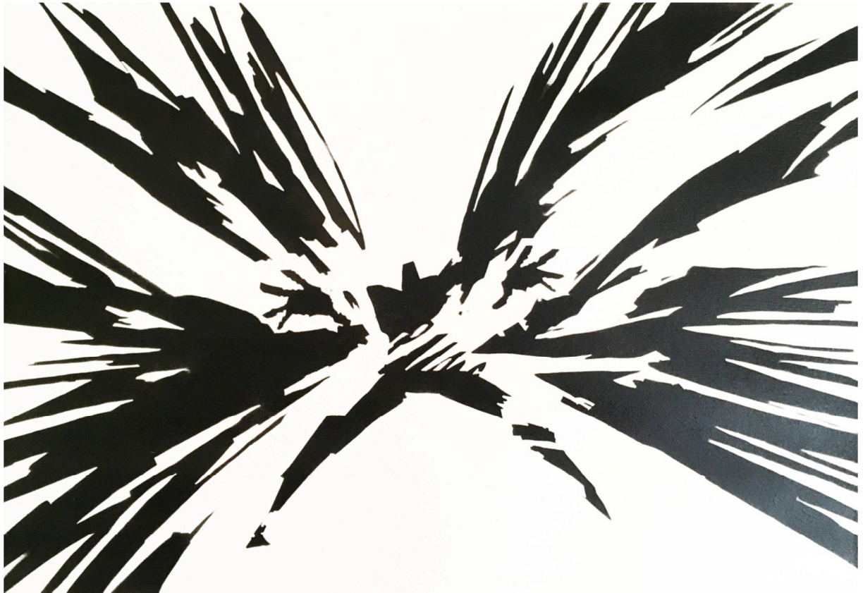
Slika 6. „Eksplzivno“