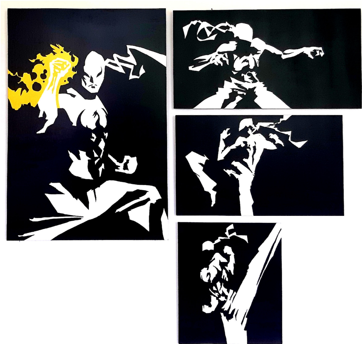
Slika 5. „Iron fist“