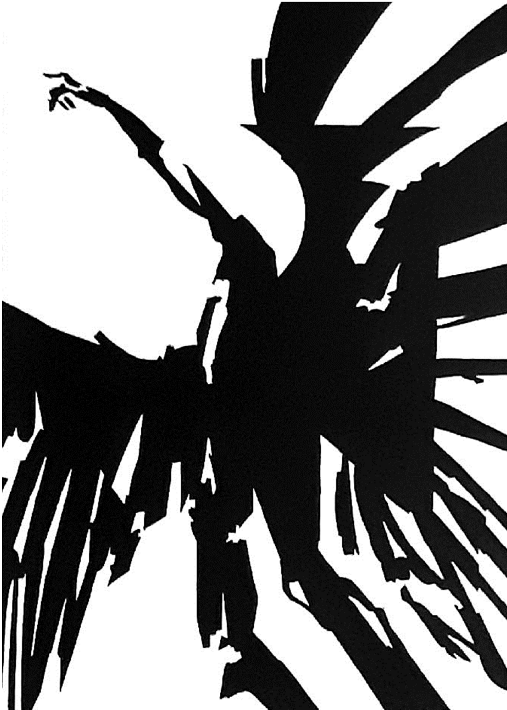
Slika 3. „Negativ“