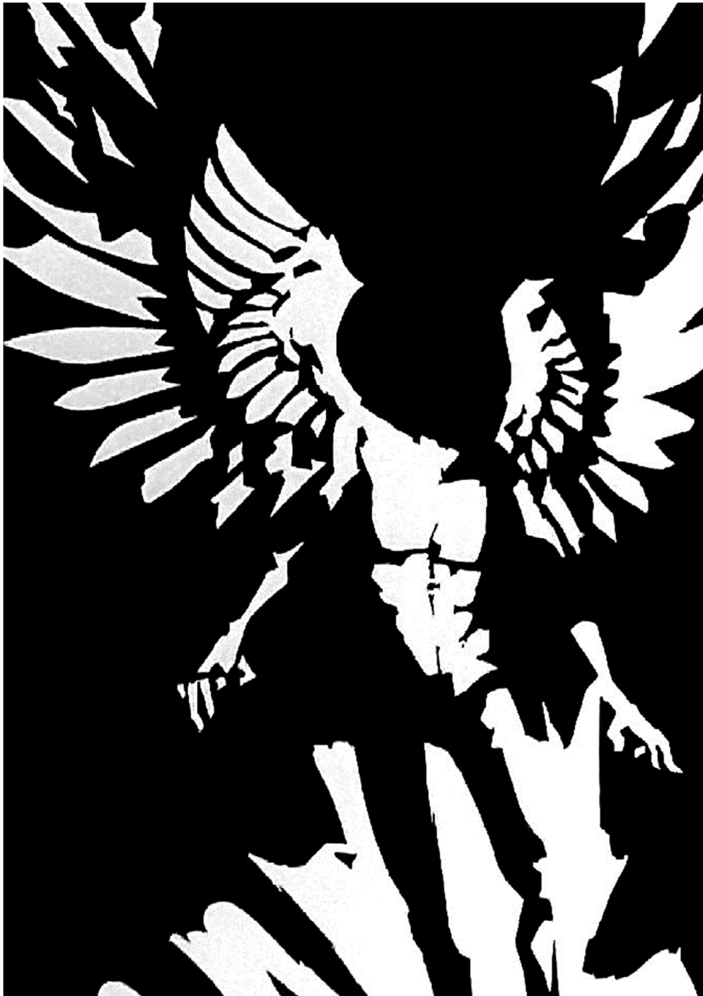
Slika 2. „Pozitiv“