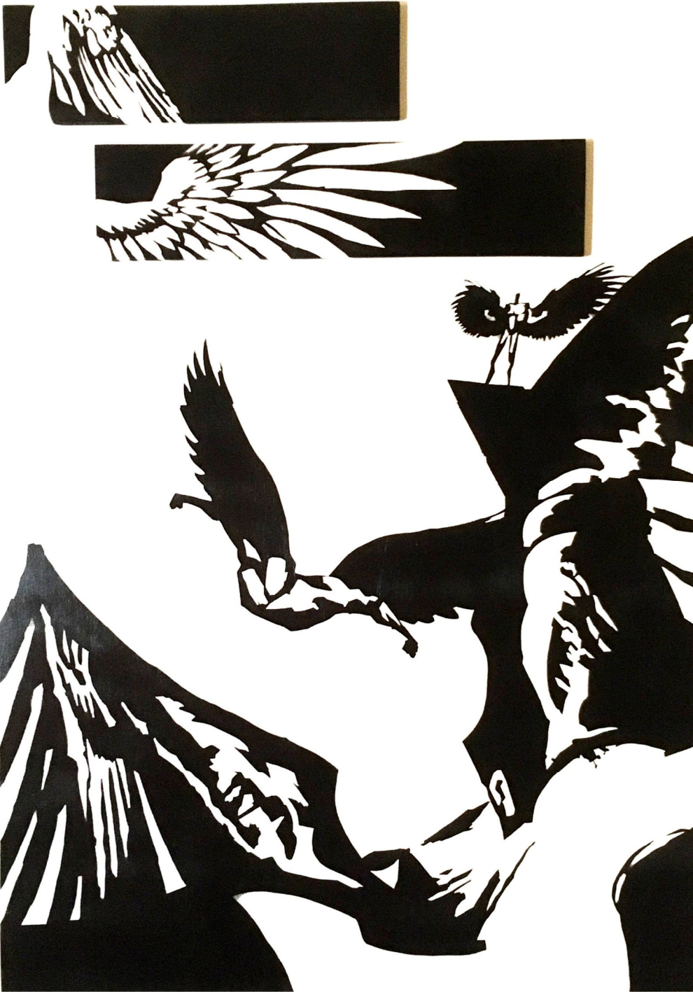
Slika 1. „Slobodni pad“