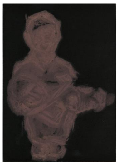
Plj skulpture u boji Helena Bonin, 2023.