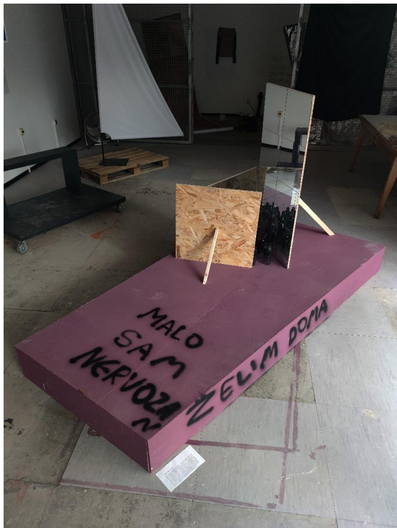
"MALO SAM NERVOZAN", skulptura, ready-made