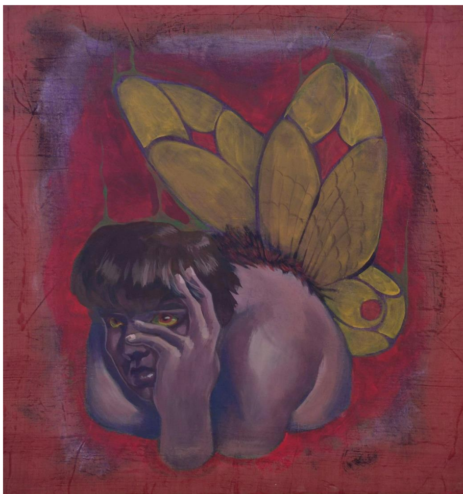
"Nisam dobro, ali koga briga", akril na platnu, 71,5x66 cm

dobro, ali koga briga" i "Tu sam i ne idem nigdje" su dvije priče koje se komplementarno nadopunjuju. Meni kao osobi je bilo bitno da su ljudi oko mene sretni kako bih i sam mogao biti sretan. Nije mi bilo bitno kako se ja osjećam u određenim situacijama, već kako se drugi osjećaju. Takvo razmišljanje nije bilo podržavajuće za mene kao mladu osobu. Uz podršku dragih ljudi, shvatio sam da se cijelo vrijeme događa suprotno od mojih misli. Ljudi se ne moraju osjećati samo i ostavljeno, ali ponekad donesu takvu odluku, i to je sasvim u redu. Žive li sretno ili nesretno... to je na njima samima. Slike, dakle, izborom motiva i materijala reflektiraju ova razmišljanja i ohrabruju naše metamorfoze na životnom putu.