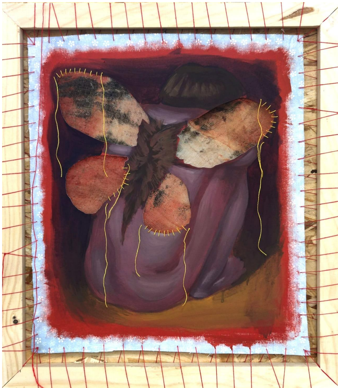
"Tu sam i ne idem nigdje", akril na platnu, konac, drvo, 57x49 cm