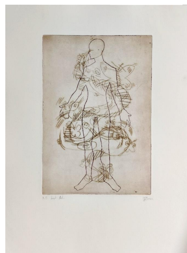
"SIMBIOZA", serija radova, kombinirana grafička tehnika