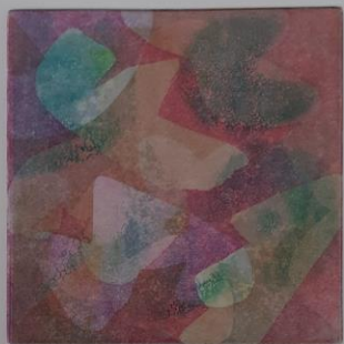
Unutarnji autoportreti, 2024.