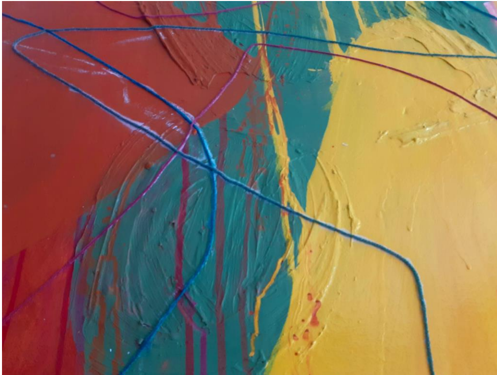
Unutarnji Autoportret, 2024. Detalj