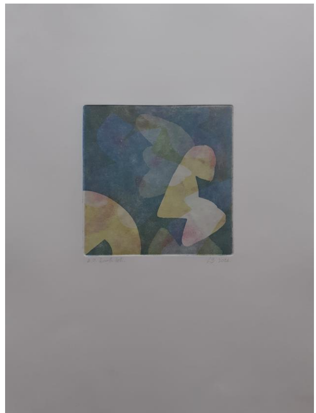
Unutarnji autoportreti, 2024. Kombinirana tehnika, akvatinta u boji