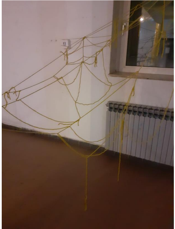
Paukove mreže, 2023./24.