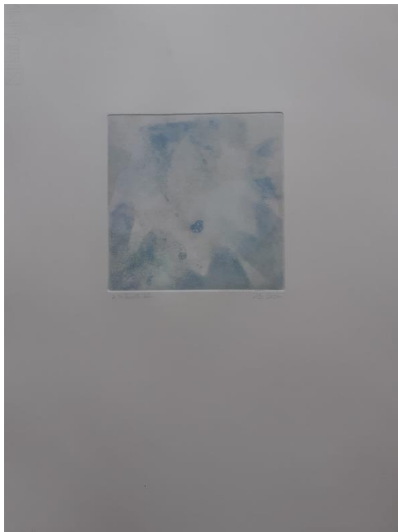
Unutarnji autoportreti, 2024. Kombinirana tehnika, akvatinta u boji