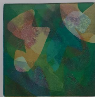
Unutarnji autoportreti, 2024.