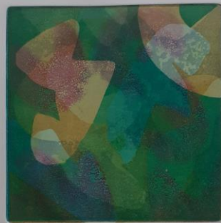
Unutarnji autoportreti, 2024.