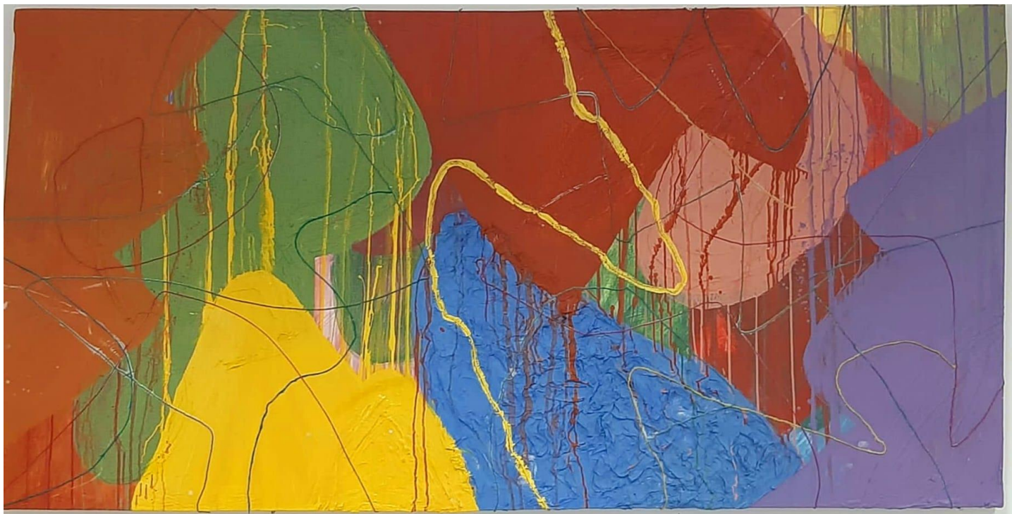
Unutarnji Autoportret, 2024.

Akril, tempera, gips, papir, vuna na platnu, 100 cm x 200 cm