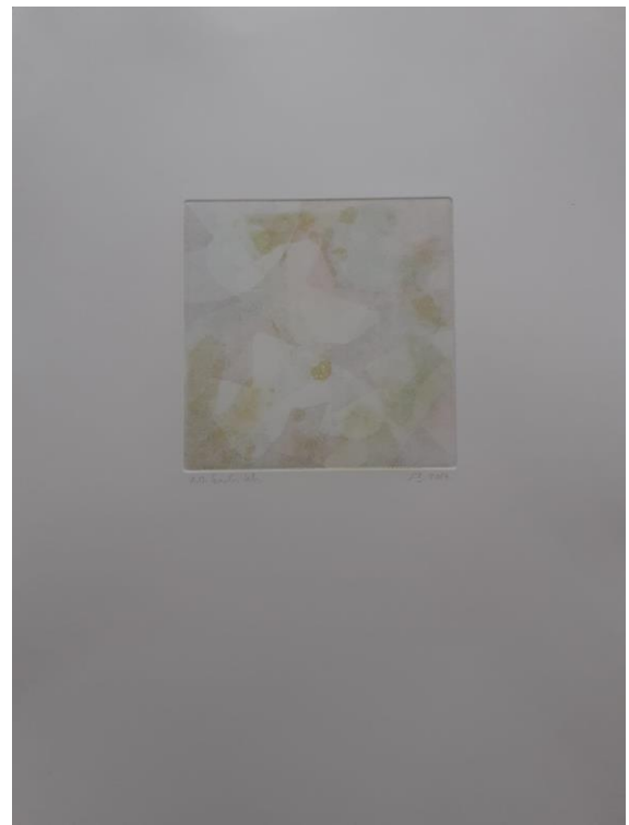
Unutarnji autoportreti, 2024. Kombinirana tehnika, akvatinta u boji