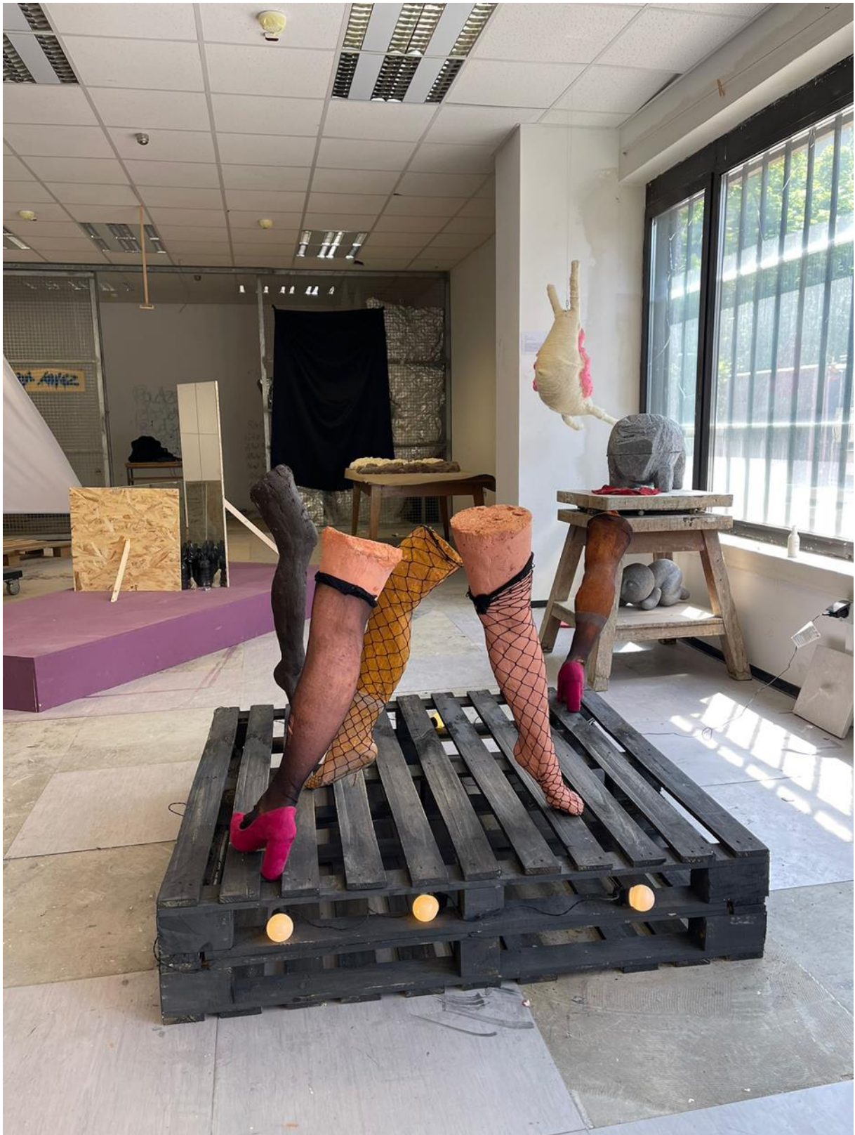
U tuđim cipelama, postament: D 120cm Š 80cm ukupna visina: 120cm