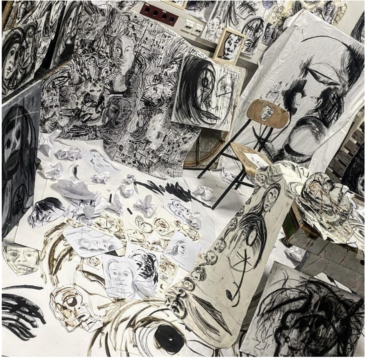
Ja i moj svijet , 2024. Kombinirana tehnika (papier, platno, ugljen, grafit, akril), dimenzije primjenjive