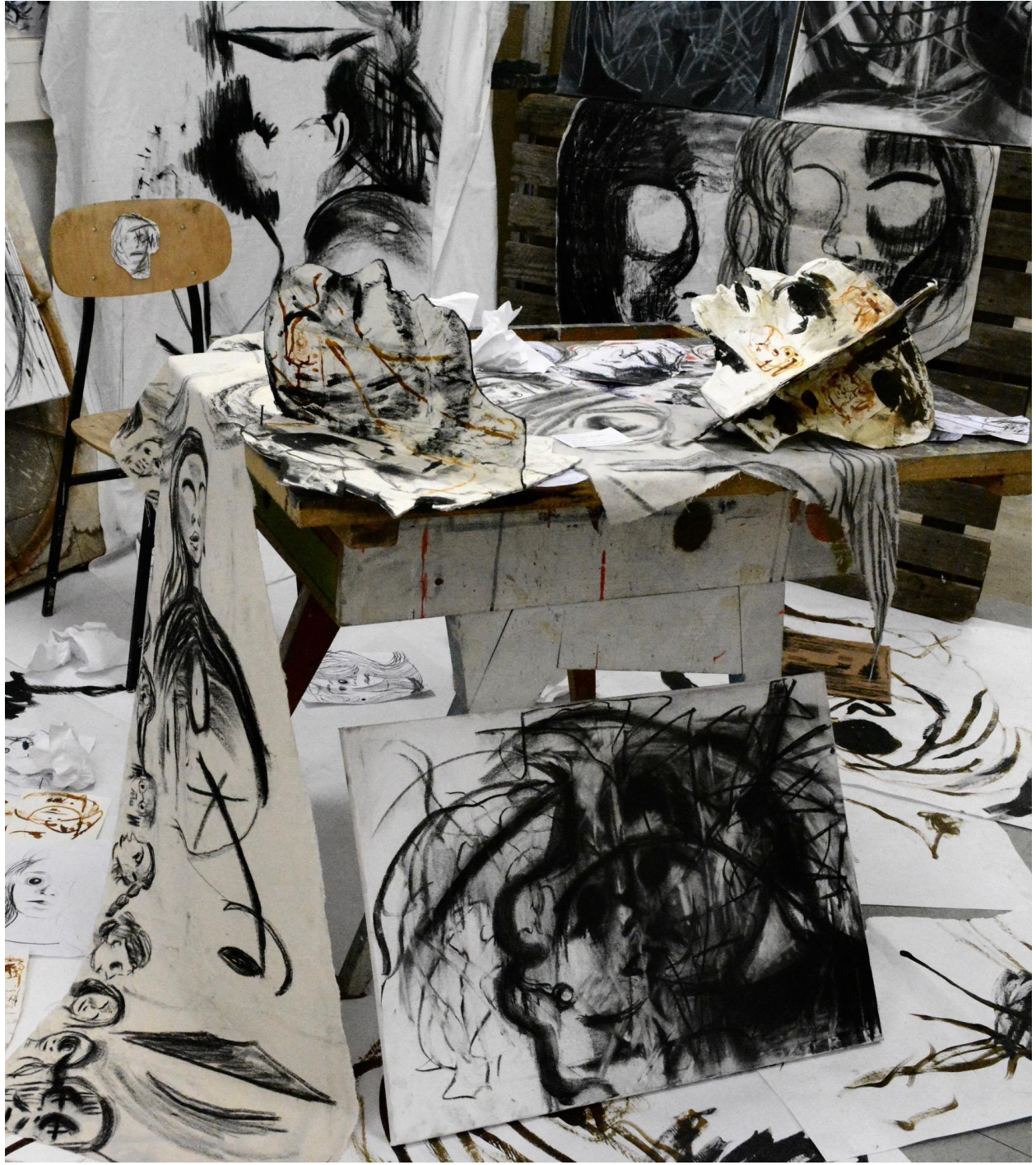
Ja i moj svijet, 2024., detalj.