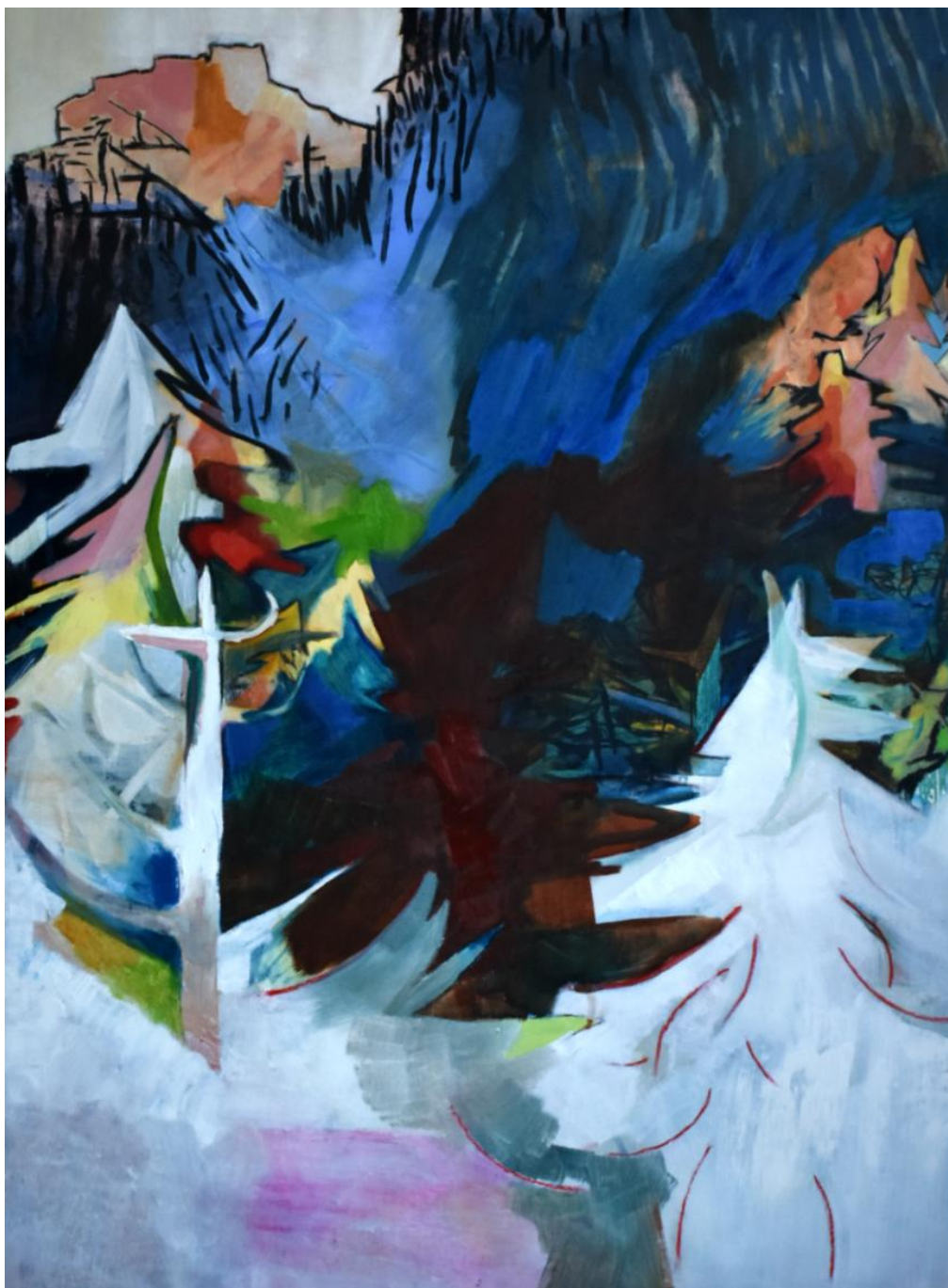
Razgradiv pejzaž (plava-bijela), 203x145 cm, 2019.