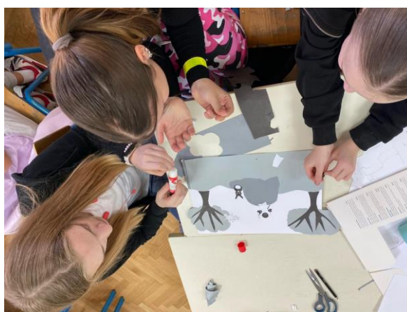
Fotografija 3: Dovršavanje kolaža, drugi susret

Drugi je susret započeo prezentacijom te uvodnim slajdom na kojemu su sadržane informacije o tome što se od učenica očekuje. Učenice su dovršile predloške u kolažu, a završeni su predlošci fotokopirani i isprintani na papir A3-formata kako bi se originalni predlošci očuvali. S učenicama je potom provedena metoda oluje mozgova – potaknulo ih se na zajedničku suradnju, tj. na to da odluče kako spojiti dvije ideje u skladnu cjelinu s obzirom na to da su korištene različite perspektive. Učenice su se brzo zainteresirale i aktivno su sudjelovale. Posljednji se je zadatak ticao određivanja kromatske boje likova s predložaka kako bi se unaprijed što bolje pripremile za oslikavanje.