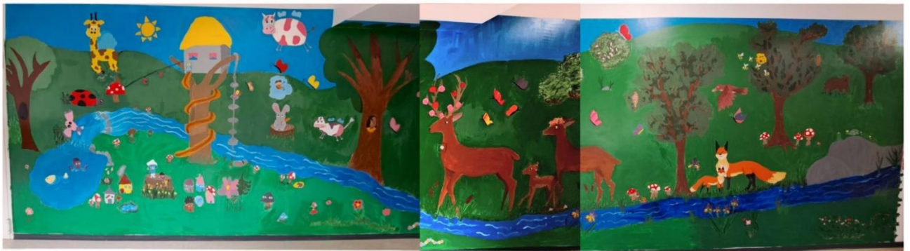
Fotografija 9: Kolaž konačnoga zidnog oslika