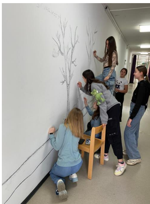
Fotografija 5: Suradnja s učenicama iz Slovačke, treći susret

Na trećem su se susretu učenice bavile prenošenjem crteža na zid, a pozornost je bila usmjerena na omjere i proporcije. Učenice su samostalno prenosile motive krenuvši od jednog motiva koji je funkcionirao kao usidrenje za ostale – u ovom je slučaju to bio motiv potoka koji se proteže cijelim zidnim oslikom. U početku su učenice bile oprezne promišljajući o tome kako će započeti. Kako bi se više oslobodile, demonstrirano im je crtanje ugljenom koje je podrazumijevalo povlačenje široke linije položenim ugljenom i naknadno brisanje. Time je učenicama je pokazano da nema krivih linija i da su pogreške dijelom procesa, a rezultiralo je većom zanimacijom za postavljanje crteža. Na trećem su susretu sudjelovale i učenice iz Slovačke koje su odlično surađivale s učenicama Osnovne škole Trnsko, što su izrazile i u anketi, o čemu će više biti napisano ispod. Fotografija s trećeg susreta prikazuje učenice Osnovne škole Trnsko skupa s učenicama iz Slovačke – surađuju te postavljaju crtež.