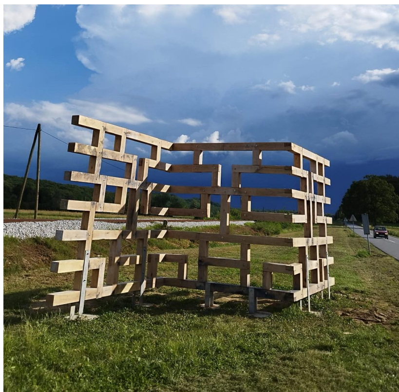
Skulptura "Prebivalište", postavljena na ulazu u Veliko Trojstvo