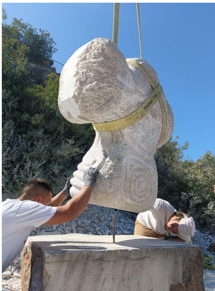
Postavljanje skulpture na postament

Po završetku svih skulptura postavljali smo ih u javni prostor grada Vrsara. Pri tome se najčešće, radi manjka stručnjaka, kipar sam mora se pobrinuti oko statike vlastitog rada i to kroz sredstva samo vlastitog osjećaja za statiku. Na svu sreću to je jedna od glavnih odlika kipara, barem onih koji se bave čvrstim objektima i skulpturama u prostoru. Sjetimo se samo Michelangelove crkve svetog Petra u Rimu. Ja nisam gradio crkvu u Vrsaru ali sam bio prilično siguran da je za moju skulpturu, bez obzira na njenu monolitnost, potrebna šipka koja bi ju učvrstila za tlo. Tako je bila Probušena rupa u dnu skulpture i postamentu nevidljive oku gledatelja pri postavljenoj skulpturi. U te rupe je stavljena šipka i izbušene su odgovarajuće rupe u tlu lokacije javnog postava radi fikscije samog postamenta. Skulpturu se više puta dizalo i okretalo dizalicom za vrijeme njezine obrade te se tako i uz pomoć dizalice postavila. Da smo je morali kotrljati kao što je bio slučaj s nekim skulpturama iz prapovijesti forma bi proizlazila i iz te činjenice.