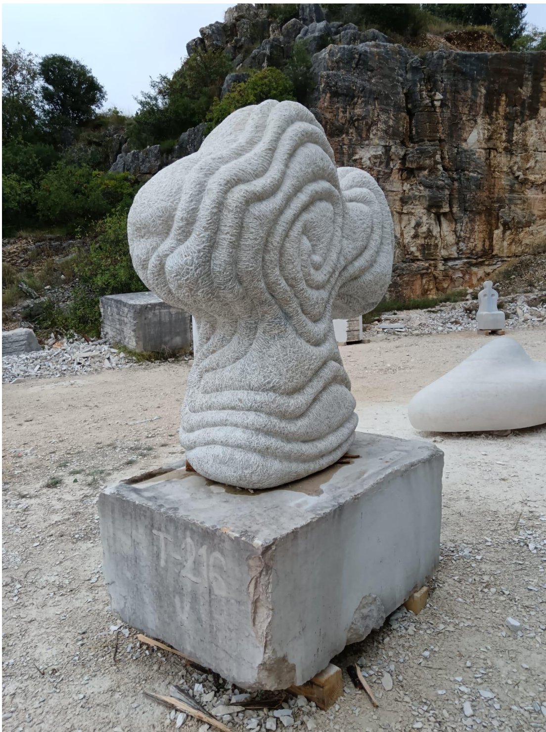
Fotografija dovršene skulpture "Riblji Križ" u privremenom javnom postavu u Vrsaru