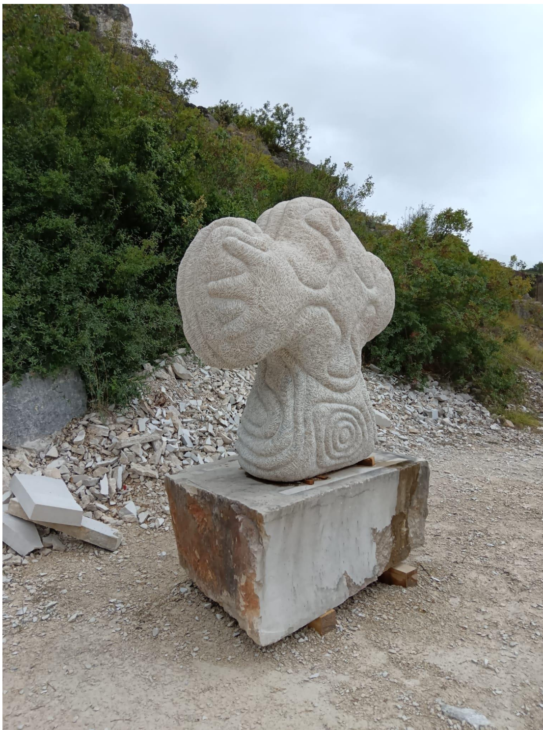
Fotografija dovršene skulpture "Riblji Križ" u privremenom javnom postavu u Vrsaru