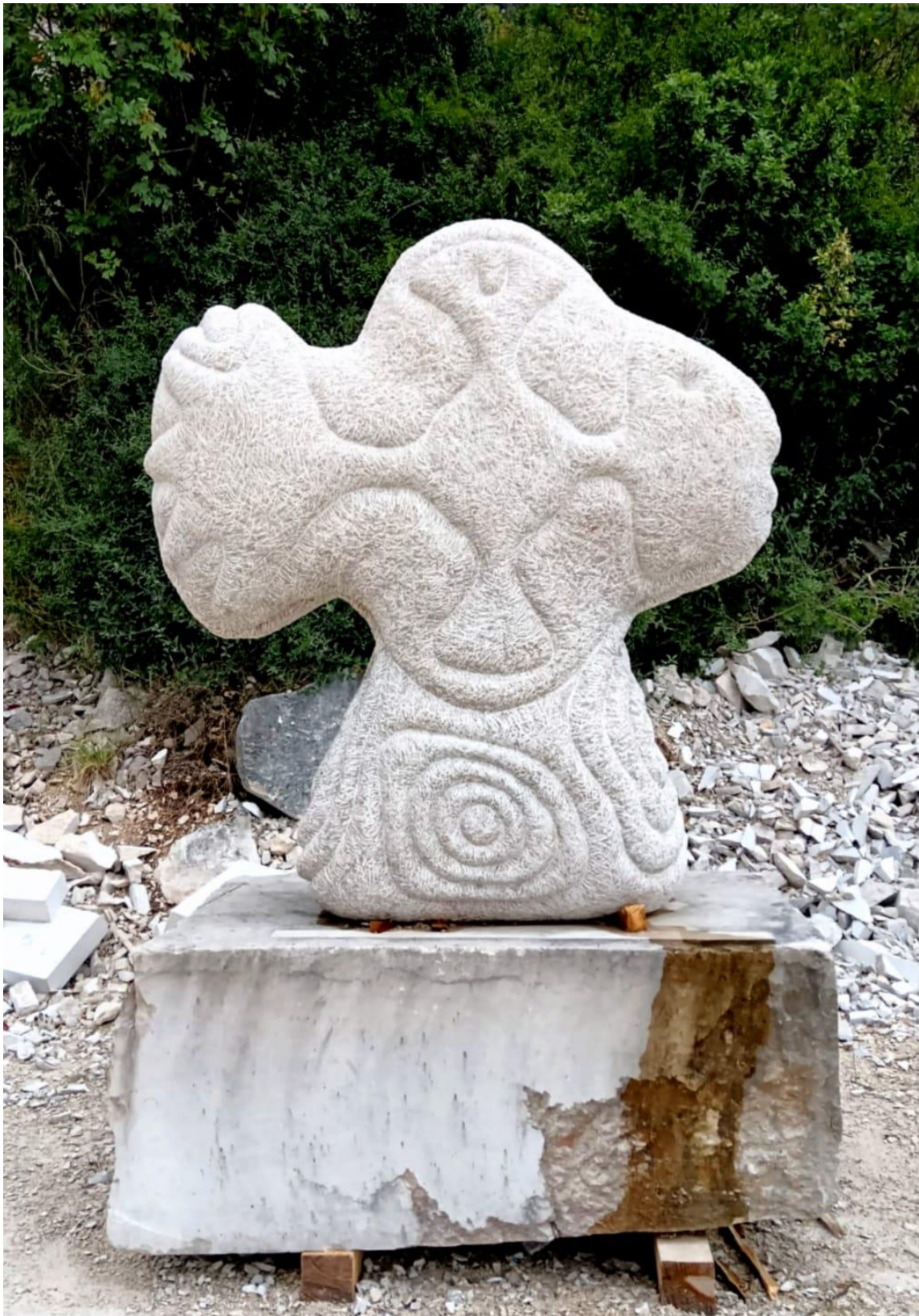
Fotografija dovršene skulpture "Riblji Križ" u privremenom javnom postavu u Vrsaru