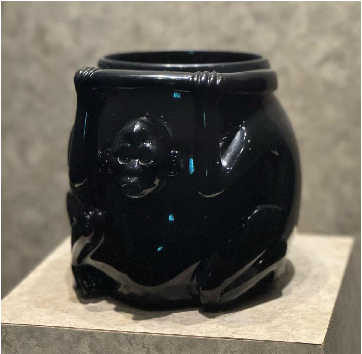
Primjer Majanske i Aytečke skulpture u dugotrajnijem materijalu

interpretacije koje su se na začudan način uklapale u snažan kanon. Prikaz je varirao ali uvijek je u neku mjeru bio naturalistički i obuhvaćao najbitnije elementa motiva. Vladali su masom i kroz nju dobivali taj snažan naboj simboličnosti i mističnosti. Ono što me iznenadilo bila je skulptura u terakoti koja je imala uz sve to ton humora i topline kojima su obrađivali teme svakodnevice i socijalne hijerarhije. Ovaj ton se može primijetiti i u skulpturama Lenore Carrington. Ona je kroz svoje fantastične prikaze priča o dubljim psihološkim procesima koji se dešavaju izvan našeg racionalnog svijeta. Za to je sigurno našla inspiraciju kada je zavirila u tako drugačiji svijet Maja. Oni svi su se donekle bavili materijalnošću kroz svoju skulpturu.