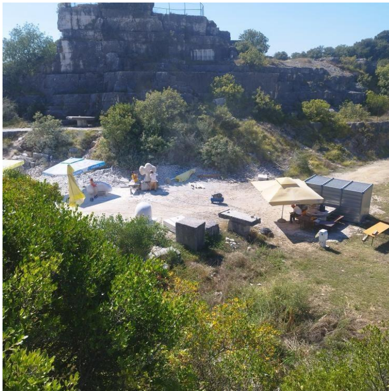
Pogled na Montraker sa obližnje stijene

predaju Vrsarski velemajestori. Neki od njih su bili samouki no to je samo obogatilo njihovo znanje osobnim cjeloživotnim procesom učenja. Forma ove predaje znanja u sebi je naravno i podrazumijevala dovršavanje skulpture u zadanom vremenskom roku. No to nikad nije bio glavni razlog i rezultat ove škole. To se i sad odražava i njezinoj strukturi. Unutar dva tjedna koja smo tu posjećujemo park skulptura Dušana Džamonje i organizirani su nam brodski izleti za upoznavanje mjesta. Ako uzmemo u obzir da se za to izdvaja par dana od dva tjedna koja imamo za izradu skulptura u kamenu velikih formata postaje malo jasnija vrsta iskustva koju ovdje stječemo. Nekoć su je ova škola bila još raskošnija kada je trajala tri tjedna. Ironično tada su sponzori ove škole bili puno siromašniji a opet zadnji tjedan za studente je bio organiziran izlet katamaranom u Veneciju na njezini čuveni Biennale. Ova škola je doduše i dalje atrakcija za sve, od radoznale djece i turista do mještana od kojih su neki svjedočili i gotovo svim godinama ove škole. Razgovori s njim ulaze u tajna bogatstva ove škole sa, ambijentom, žuljevima, druženjima i raznim drugim iskustvima. O skulpturi kroz čiju izvedbu sam ovo sve proživio govorim u nadolazećem poglavlju.