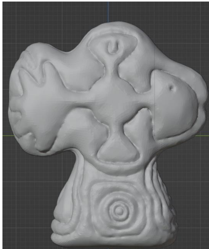
Skica "Ribljeg Križa" u programu Blender

Nakon što sam saznao za natječaj za ovu radionicu izradio sam skicu u programu za 3D modeliranje Blender. Ovo je prvi put da sam nešto takvo koristio u svome radu te je tako već tu započeo moj proces učenja. Od početka skica je bila zamišljena kao promjenjiva i više kao prijedlog za kamen pošto je virtualni model unutar virtualnog prostora potpuno drugačiji svijet od jednog kamena u Vrsaru iz kojeg valja napraviti moju ideju. Skica je služila za mjere koje će kasnije poslužiti u velikim rezovima na pomno izabranom kvalitetnom kamenu za moj rad. Kako je to običaj radi lakšeg prijenosa vrijednosti sa skice na skulpturu, bila je napravljena u mjerilu 1:10. Prijevod s jezika virtualnog na materijalni odnosno kamen je dodao još jedan konceptualno-vizualni sloj mom radu.