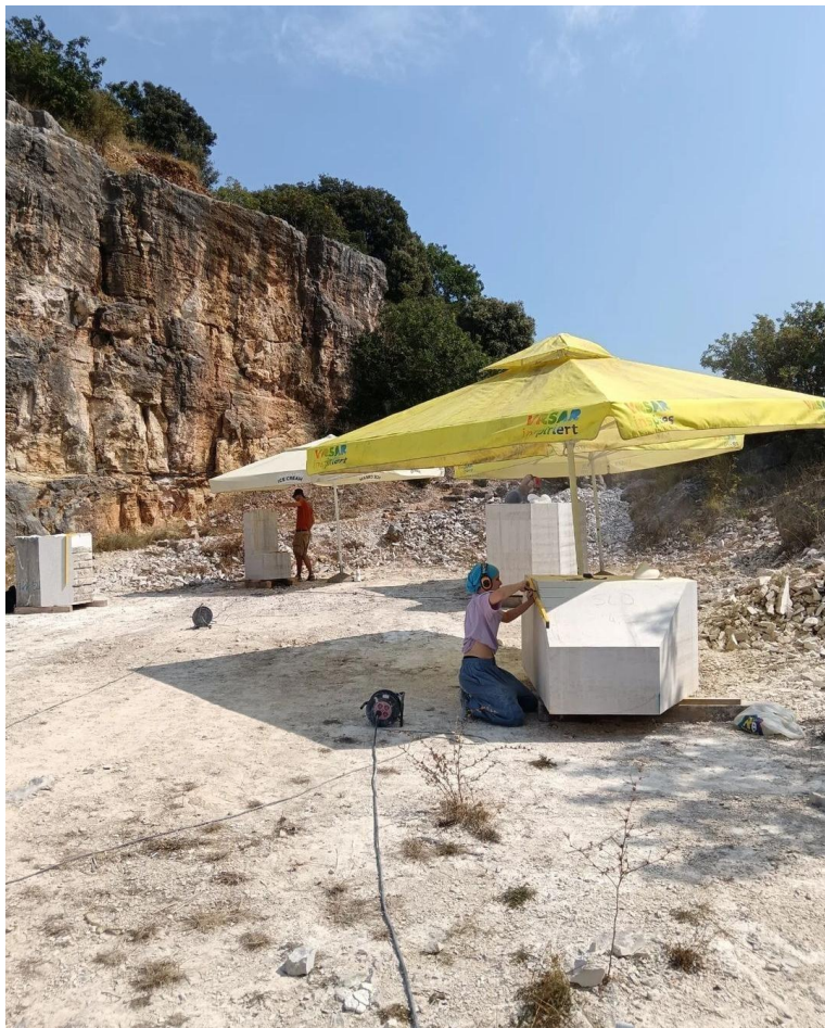
Stari kamenolom u kojem se preko 30 godina održava radionica Montraker

Međunarodna kiparska škola Montraker je specifična radionica koja se odvija već preko 30 godina. Takva duga povijest odražava se na svakom koraku u cijelome gradu Vrsaru. Ne samo da je grad prepun kiparskih djela autora koji su prošli kroz ovu radionicu već je i sam grad svjedok povezanosti mještana i kamena. Kamen kao materijal koji se koristi za skulpture na ovoj radionici je prirodno dio ovog mjesta i šire. Taj kamen se vadio i odvozio još iz doba kada se to radilo galijama. Izgleda da je nekad prije 30. Godina organizacijski odbor odlučio zadržati nešto od tog kamena unutar grada u najplemenitijem mogućem obliku. Taj oblik su bile skulpture, autorska djela mladih nadolazećih kipara od kojih neki sad predaju kiparstvo poput profesora Alema Korkuta koji je i bio moj mentor na ovoj radionici.