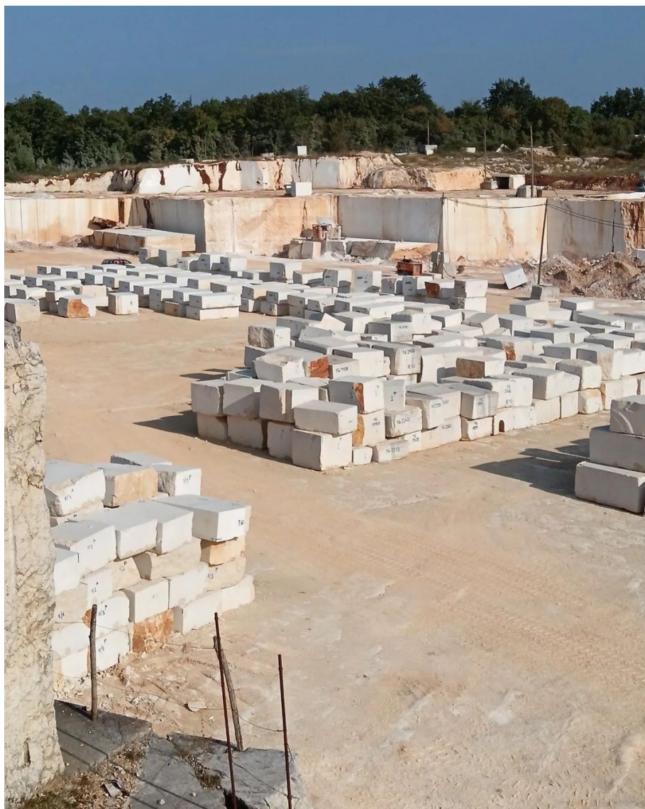
Kamenolom Soline iz kojeg se vadi kamen za radionicu Montraker

Lokalni kamen iz vrsara je bio najjednostavniji i najprirodniji izbor materijala za ovaj rad. Da u radionici Montraker ovaj kamen i nije obavezni materijal, zbog analogije koju njegova grubost i čvrstoća imaju s teškim životom ribara, svejedno bi ga izabrao za ovaj rad. Ljepotu ovog kamena percipiramo kao i onu u ribarskom životu, kroz trud koji ih je oblikovao. U kamenu oblik će kroz prirodne utjecaje erodirati toliko sporo da se čovjeku čini nepromjenjivim i time u sebi sadrži simbolike dugovječnosti i njezine suprotnosti prolaznosti. Dugovječnost kamena je poput dugovječnosti i drevnosti ribarskog zanata koji kao da postoji koliko i kamen.