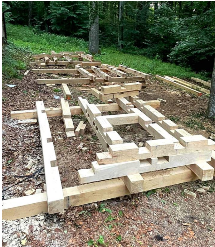
Fotografija skulpture "Prebivalište" u izradi

odnosno običnom radu. O tome je najpoznatija diskusija Leonarda da Vinci i učenjaka kada su raspravljali treba li slikarstvo smatrati umjetnošću. Leonardo je na kraju argumentirao da on s kistom ne radi više nego učenjaci s pisaljkom, te je stoga slikarstvo ipak nešto više od zanata. U kiparstvu to nije slučaj; daleko od toga. Kiparstvo je nekad prljavije i manje sistematizirano od većine zanata. No, ja sam i dalje prilično siguran da je ono umjetnost, jer ta cijela rasprava proizlazi iz jedne ideje u čovjeku da postoji čista nematerijalna kreacija koja je problematična jer generira suprotnost u obliku nečiste kreacije koja bi označila materiju izvan konteksta kao nečistu, što je logička greška. Za antropocentrične pojmove kao što su čisto i nečisto, kontekst je ključan. Stoga se skulptura kroz niz različitih procesa, koje mi označavamo kako nam paše, materijalizira u našoj materijalnoj stvarnosti da bismo je mogli percipirati. Ona je uvijek više od materije, ali nikad nije manje.