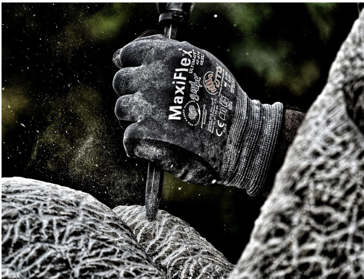
Fotografija završnog oblikovanja "Ribljeg Križa" oduzimanjem mase kamenu pneumatskom špicom

Kroz obradu kamena pomagali su mi svojim znanjem majstori i profesori te sam postajao eksponencijalno učinkovitiji. Mijenjao sam formu i prilagođavao oblike slušajući kamen. Što paše kamenu i kako raditi u njegovom karakteru. Sama veličina skulpture zahtijevala je neke promjene u oblicima i dinamičnosti oblika, osjetio sam potrebu da ojačam neke oblike dok drugima da dam dinamičnost. Proces je išao od obrade vulgarnim alata velike kutne brusilice i udarne bušilice ka onim profinjenijim napinjanjima forme malom špicom. U tom procesu sam s vremenom stekao pragmatičnost u obradi što mi je dalo uvid u način na koji oko stvara formu. Glavni dio obrađivanja kamena nije bio planiranje i učenje kao što zvuči ovdje već poštenu i teški cjelodnevni rad. Kroz taj rad se rodilo sve ostalo.