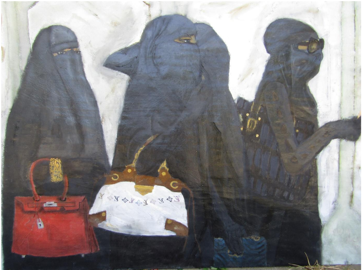
„Niquab Haute Couture“