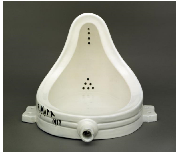
M. Duchamp, Fountain 1917 g.