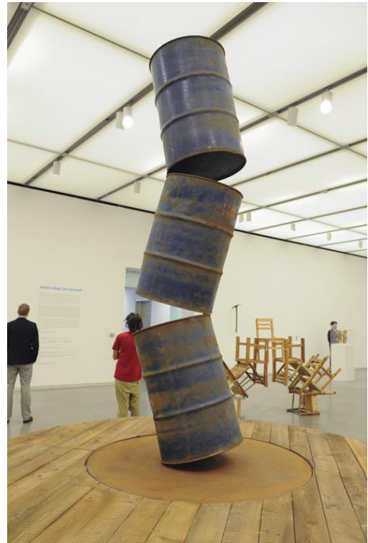
Damian Ortega - False movement