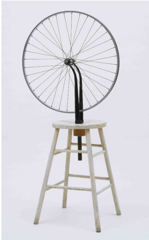
M. Duchamp, Bicycle-wheel 1913 g.