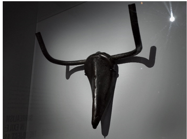
Pablo Picasso, Taureau