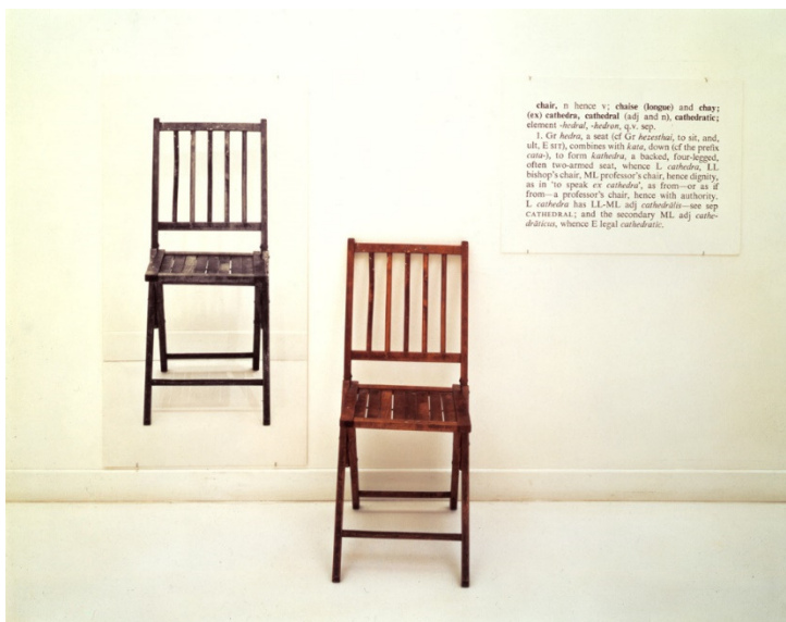
Joseph-Kosuth, one and three chairs 1965 g.