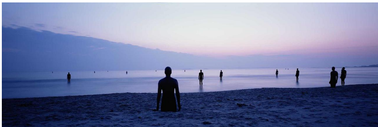
Sl.16. Antony Gormley, Another place , 1997.

Antony Gormley (1950.), je britanski kipar najpoznatiji po radovima Angel of the North i Another place , (1997.), u kojem je stotinu odljeva svojeg tijela postavio duž obale Kugelbake u dužini od dva kilometra. Rad je izazvao kontroverze i vijeće Selftona je nastojalo ukloniti skulpture ali rad je ubrzo postao vrlo popularan te je ostao na istoj lokaciji do danas. Ovisno o vremenu, plimi i oseki vidljivost rada se mijenja. 4