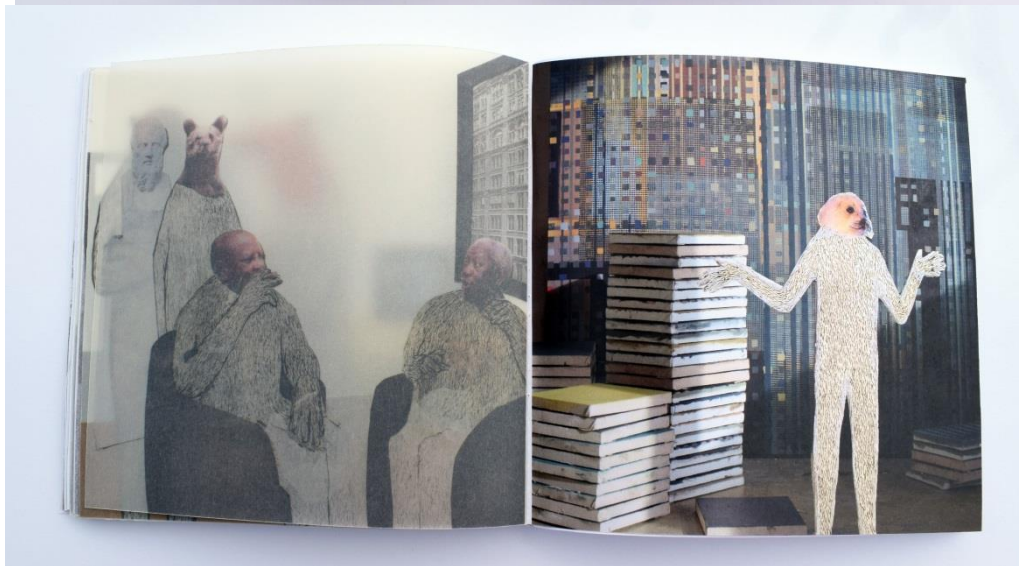
Homo Sapiens- Metamorfoze;

knjiga, 80 stranica, digitalni ispis; 150 g paus papir, 150 g ofset papir, 18 x 18 cm, 2017.