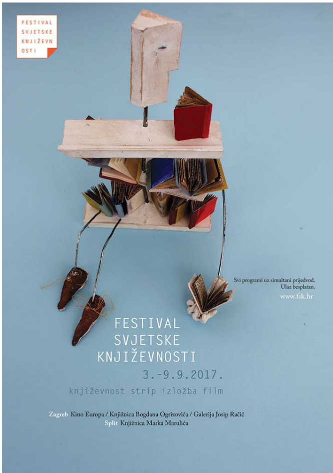
slika 1. plakat za Festival svjetske književnosti / zadatak na kolegiju ilustracija