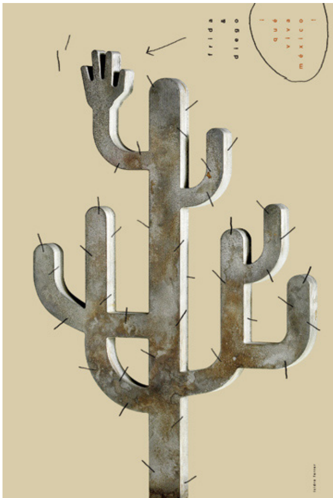
slika 2. plakat Isidro Ferrera