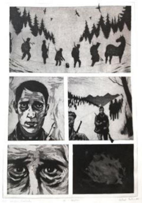
Idi i smotri, 2018., bakropis i akvatinta

Moje stripove karakterizira potpuno odsustvo teksta, što u prvi plan donosi sliku, odnosno vizualni jezik stripa. Nadalje, nepostojanje tekstualnih oblačića ostavlja dojam mističnosti i nepoznatog, te pruža mogućnost osobne interpretacije radnje koju strip donosi. Eksperimentiranje u ograničenoj, jednostraničnoj formi stripa jednako je ograničavajuće koliko i zabavno zbog likovne „igre“, odnosno traženja odgovarajućeg motivskog ili rakursnog rješenja za svaki kadar (vinjetu). Vrlo važnu ulogu pri stvaranju sveukupne, mračnije, atmosfere ovih stripova imao je tehnički aspekt njihove izrade, odnosno grafička priprema i tisak, kao i slučajnosti koje taj proces ponekad proizvede na završnom otisku. Tehnike dubokog tiska, bakropis i akvatinta, koje su korištene na ovim stripovima, omogućuju stvaranje zasićenih crnih sjena i naglašenih kontrasta karakterističnih za europske strip crtače kao što su Manu Larcenet ili Ivo Milazzo čije me stvaralaštvo inspirira.