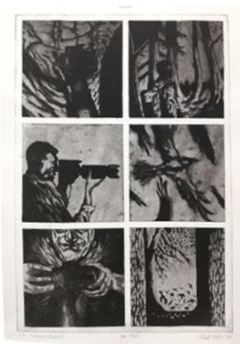
Bez riječi, 2018., bakropis i akvatinta