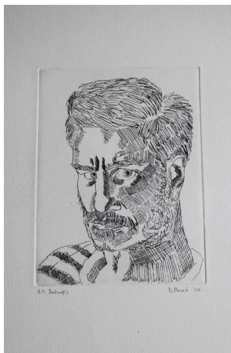
„Bez naziva“ 2019./2020., bakropis