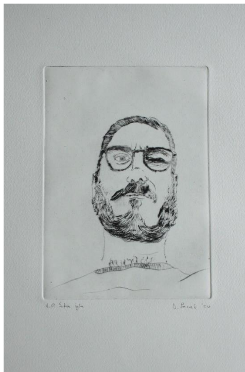
„Bez naziva“ 2019./2020., suha igla