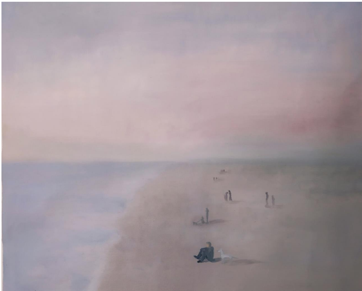
Sjećanje na Rimini , ulje na platnu, 2020.