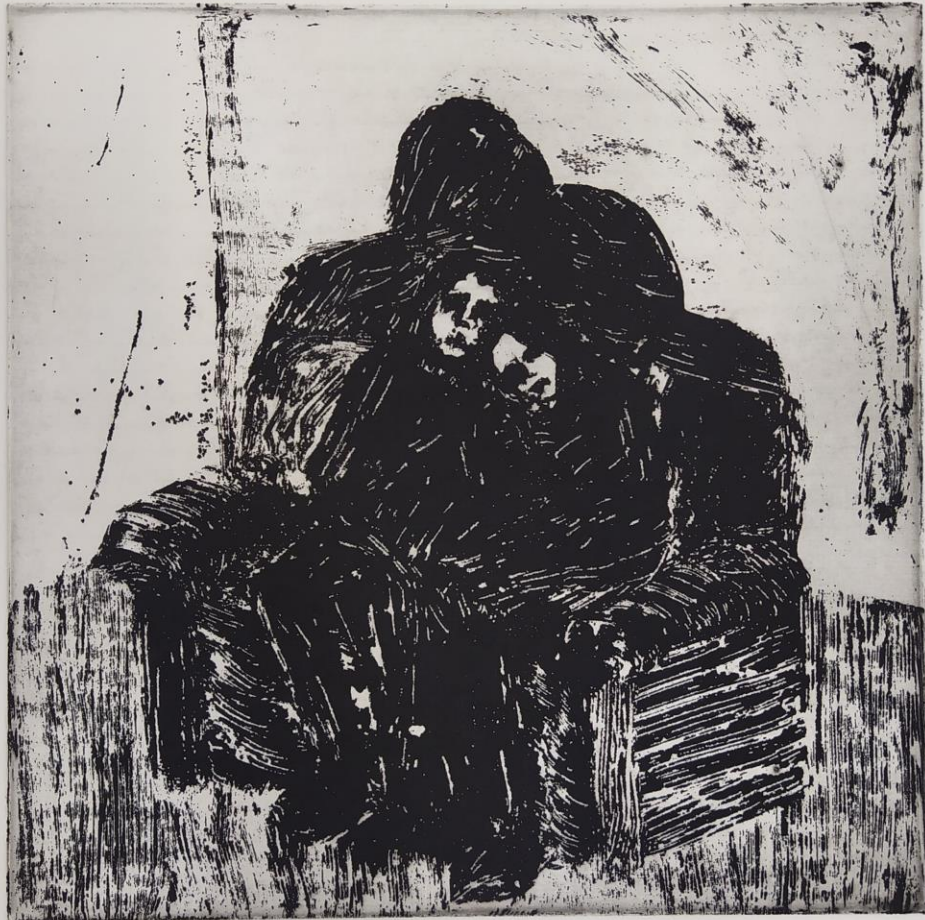
Posljednji put, 2020., rezervaš