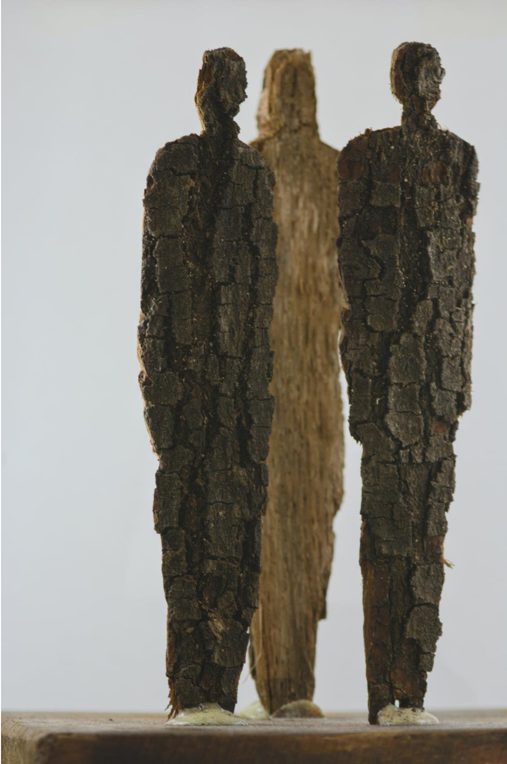
Susret, 2020., drvo