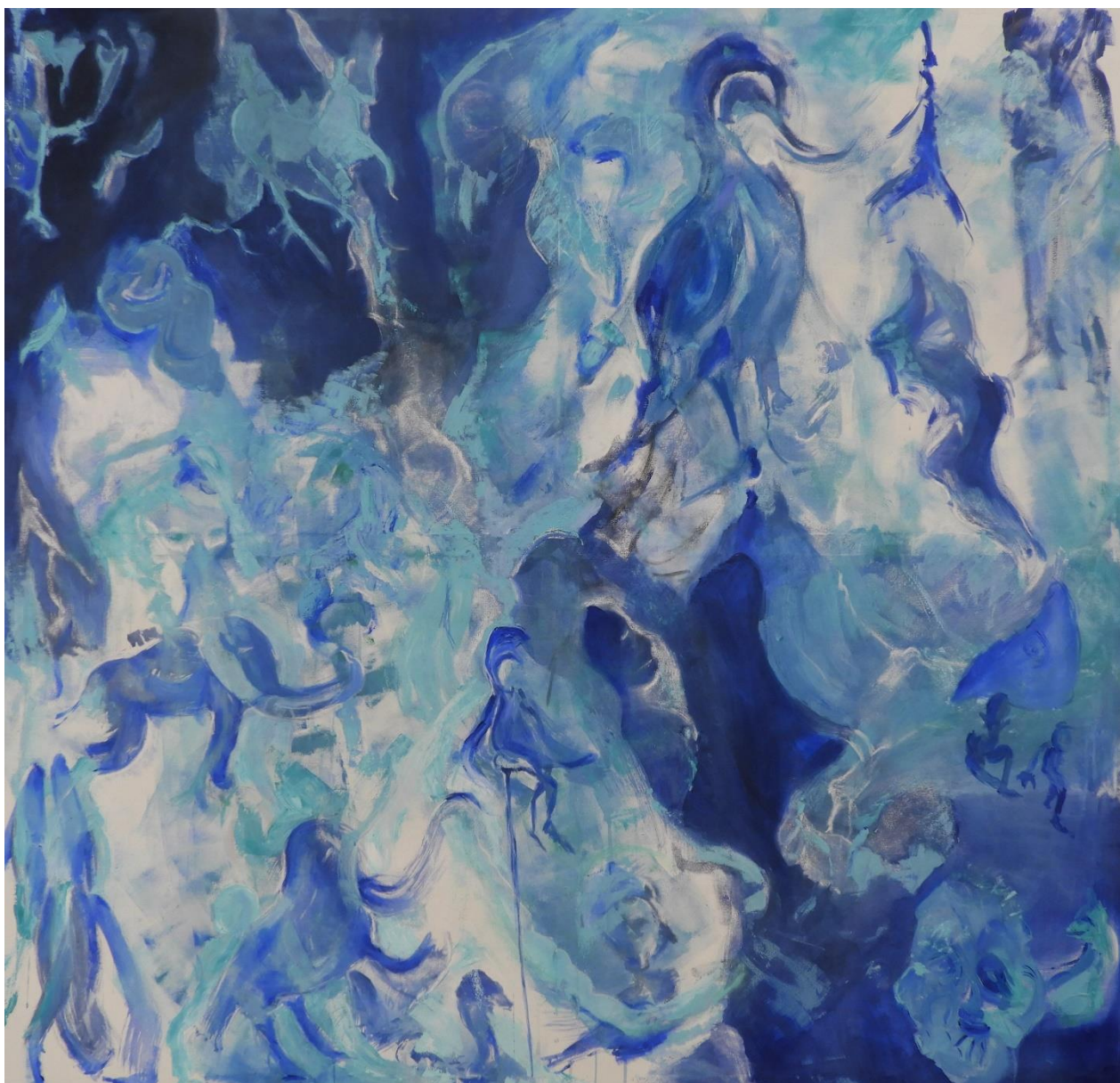
„Svijet snova“, 2019., tempera, kreda i ulje na platnu, 155 x 160 cm