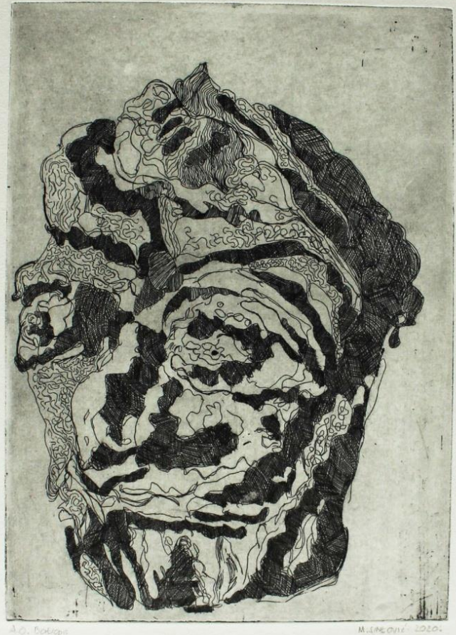
„Četiri portreta“, 2020., bakropis