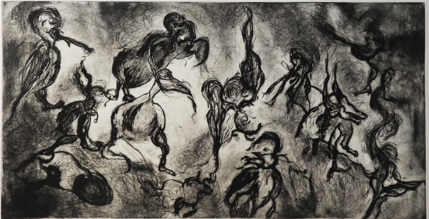
„Životinjski ples“, 2020., suha igla