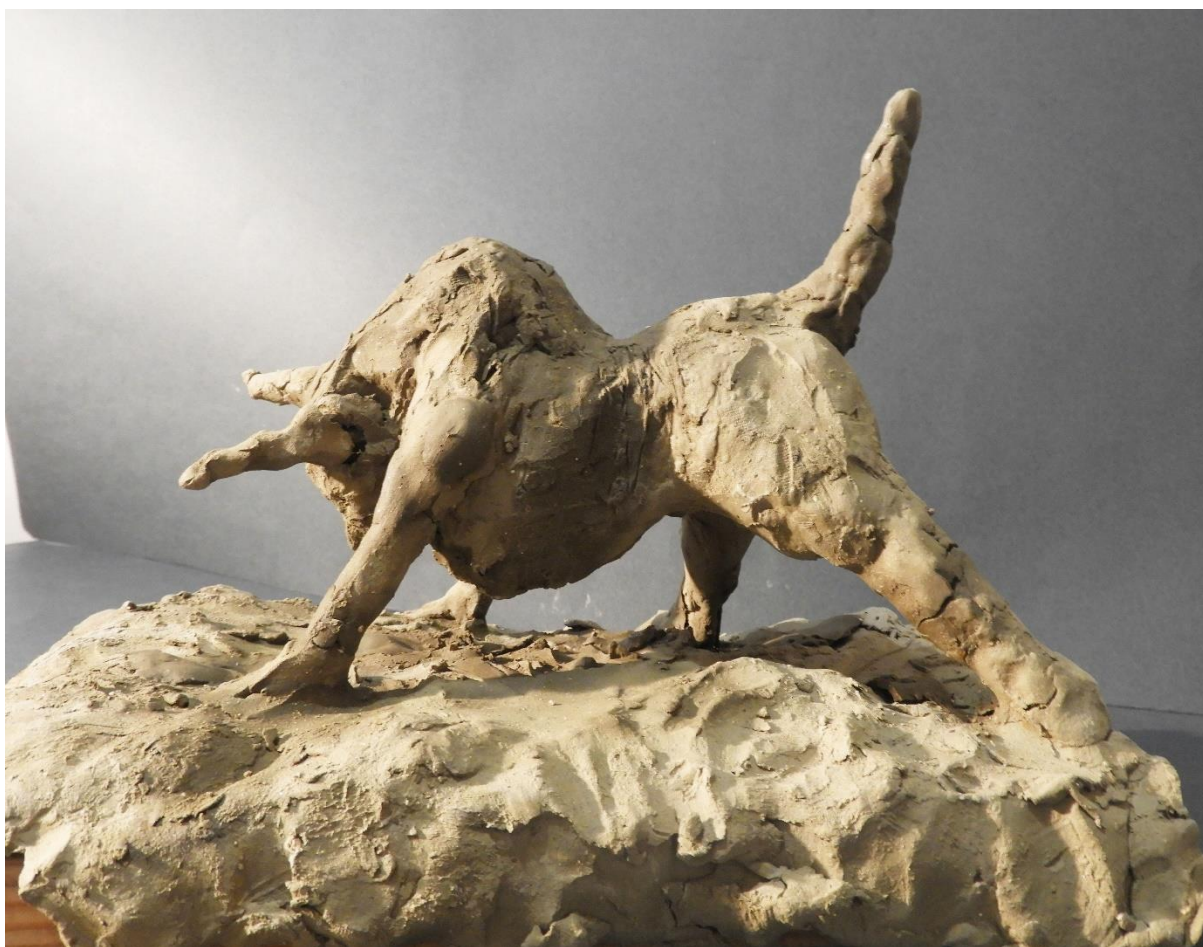
Bik , 2020., glina