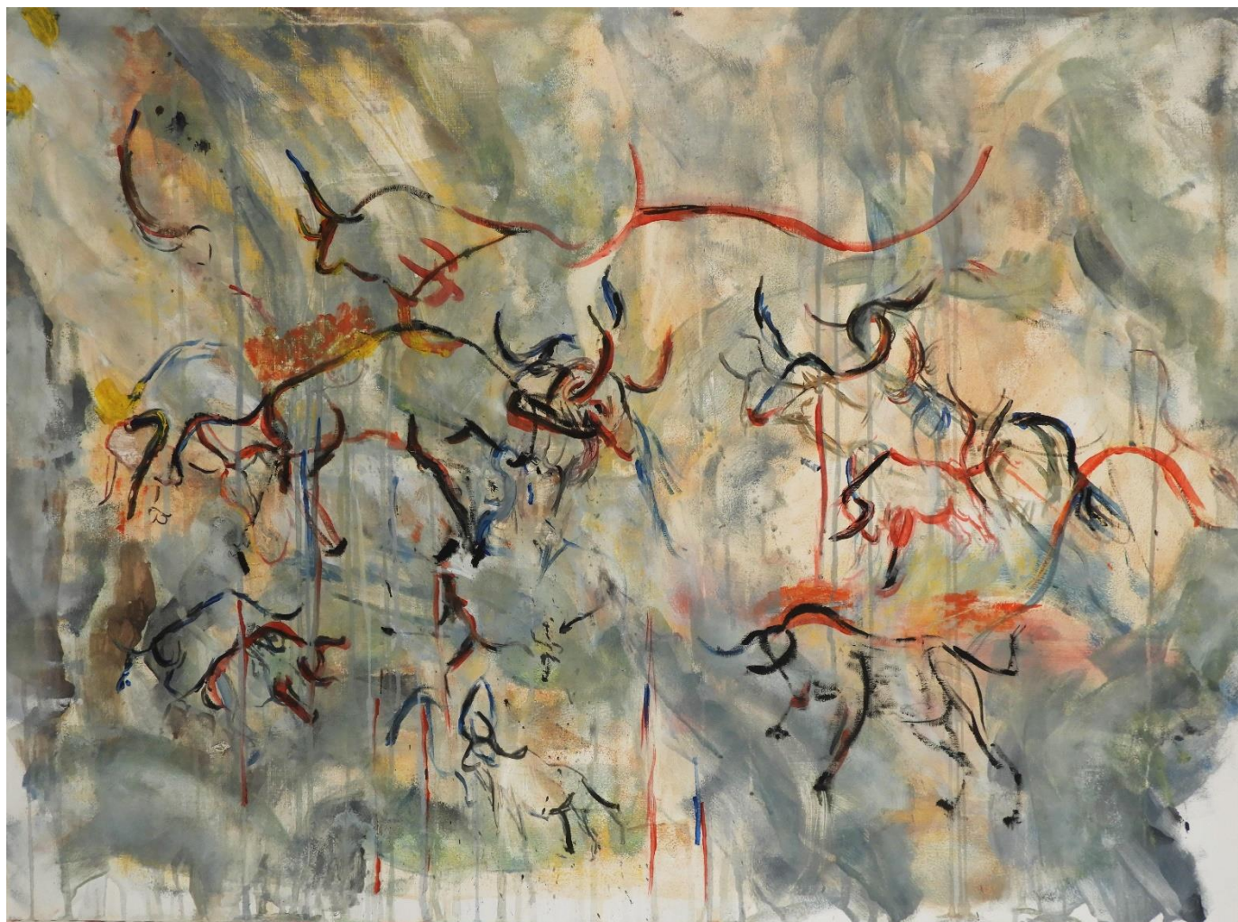
„Kompozicija I“ iz "Ciklusa bikova", 2020., tempera, ulje na platnu, 90 x 120 cm