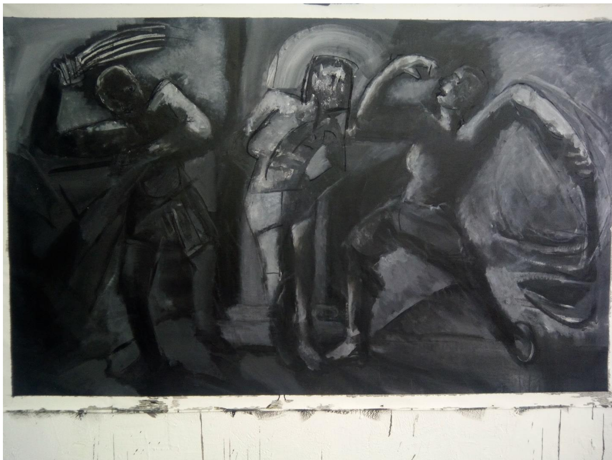
4. slika, posljednja faza monokromnog slikanja 2. verzije Bičevanja Krista

Ovo je bila posljednja faza monokromne podslike.