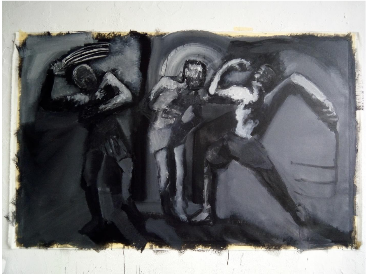
2. slika, druga faza u procesu stvaranja 2. verzije Bičevanja Krista

Nastavio sam tražiti u slici bitne i reducirane oblike i tonalitet svih oblika.