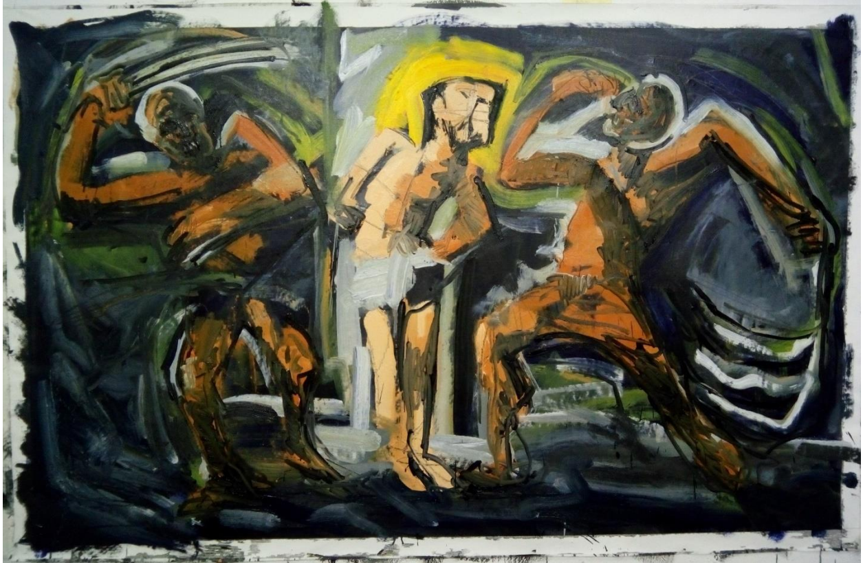
5. slika, faza slikanja uljenim bojama 2. verzije Bičevanja Krista

Nakon što sam linijama, oblicima i tonalitetom definirao kompoziciju, u ovoj fazi sam se počeo baviti problemom boja tako da sam na kraju pojednostavio svijest i koncentraciju na boje, ali ne isključivši ostale probleme jer se prilikom bojanja sve može promijeniti (pogoršati) te je nužno nešto ili sve revidirati. Nisam se potpuno opustio i oslanjao na dodavanje boja, no svejedno sam pojednostavio ne razbijajući glavu na ostala kompozicijska načela.