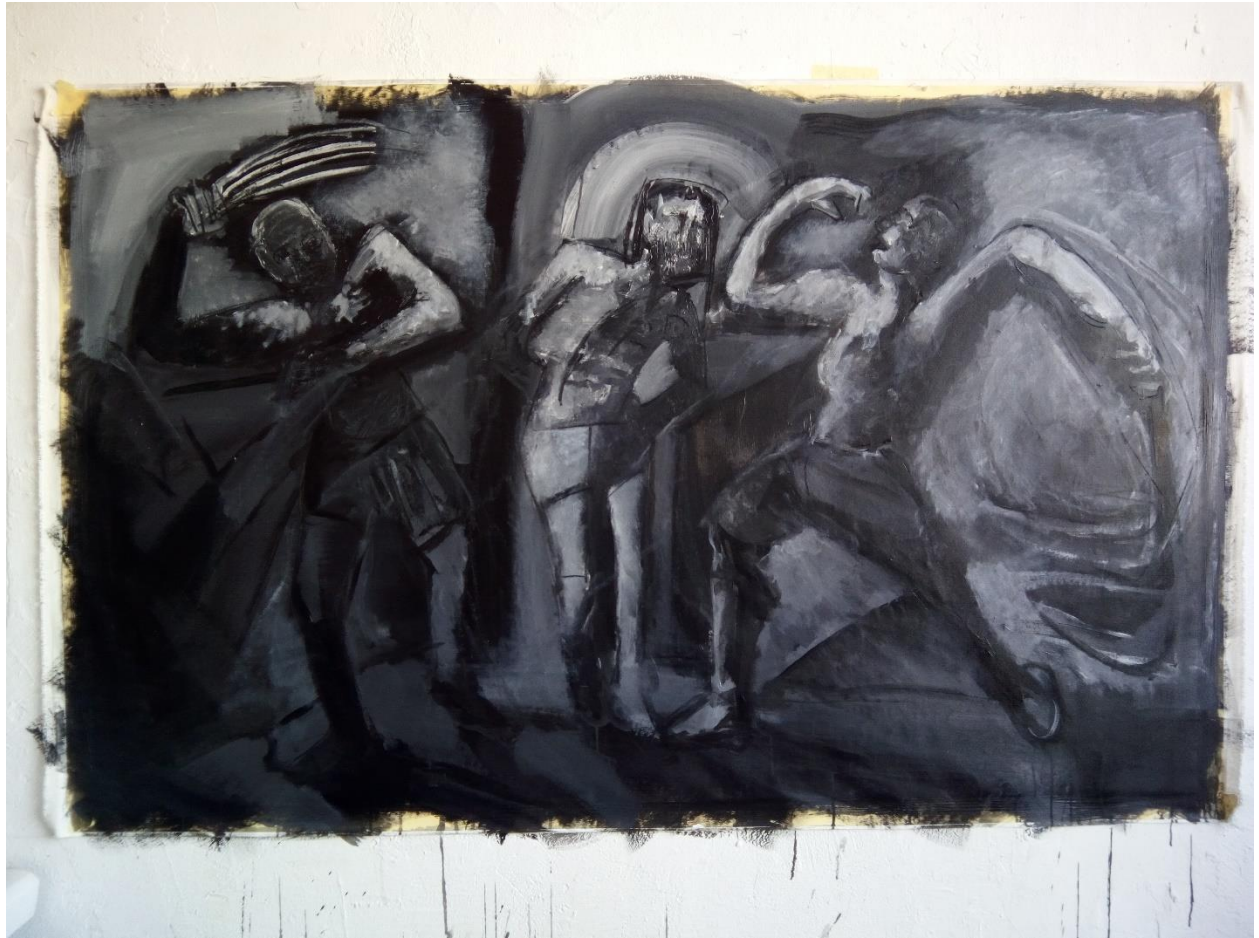
3. slika, treća faza u procesu stvaranja 2. verzije Bičevanja Krista