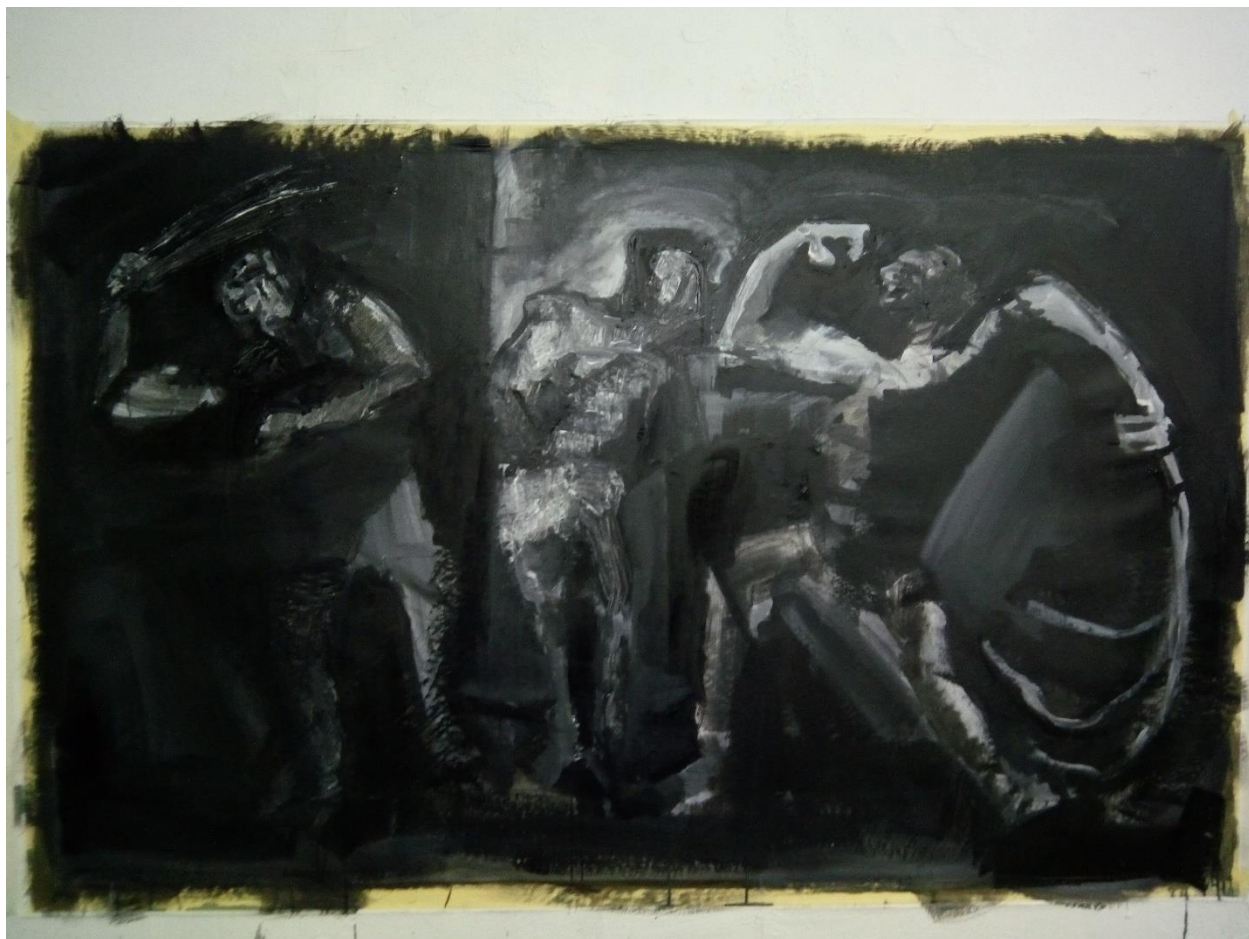
1. slika, početna faza u procesu stvaranja 2. verzije Bičevanja Krista

Započeo sam slikati monokromno u tehnici akrilik crnom i bijelom bojom apstrahirajući oblike, pojednostavio sam si ne slikajući polikromirano tako da sam samo bio koncentriran na tonalitet, linije i oblike.