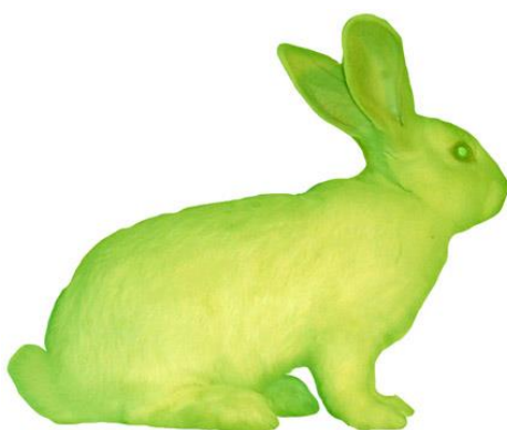
Slika 7. – Eduardo Kac, GFP Bunny , 2000. g., genetski modificirani zec

Umjetnik Eduardo Kac 4 svojim je transgenetskim projektom GFP BUNNY odlučio preispitati položaj i prihvaćanje/ne prihvaćanje transgenih životinja kroz društveni dijalog. Njegova Alba primjer je transgenetskog albino zeca. U sebi, kao i već spomenute transgenetske svilene bube, sadrži meduzin gen zbog kojeg pod određenim svjetlom svijetli zeleno. Albu su stvorili francuski znanstvenici koji su ubrizgali zelene fluorescentne proteine (GFP) pacifičke sjeverne meduze u oplođenu jajnu stanicu albino zeca.