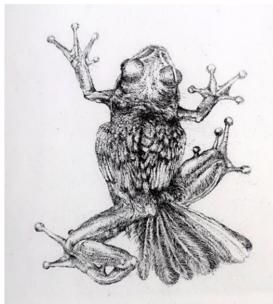
Slika 15. – Leteća žabica , 2019. g., bakropis