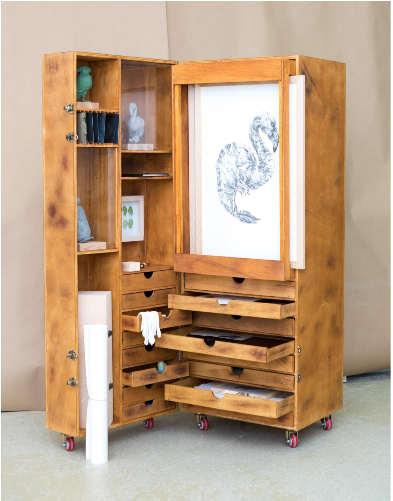
Slika 3. – Kabinet čuda