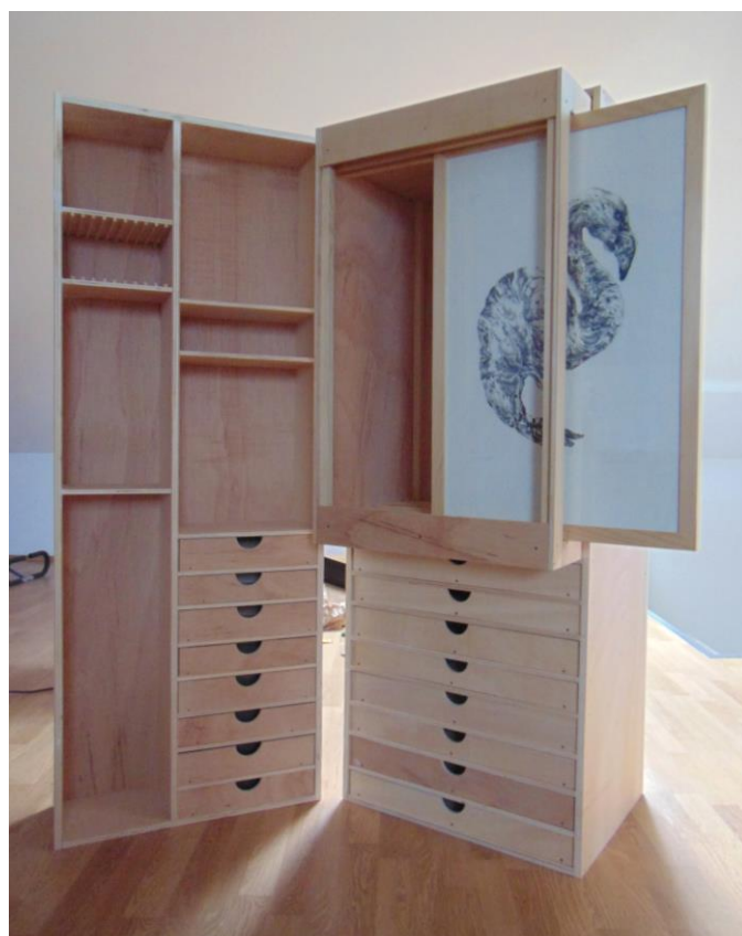
Slika 23. – Putni kovčeg, ormar u postupku izrade