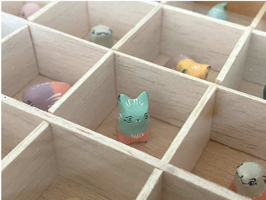
Slika 29. – Putni kovčeg minijatura, detalj