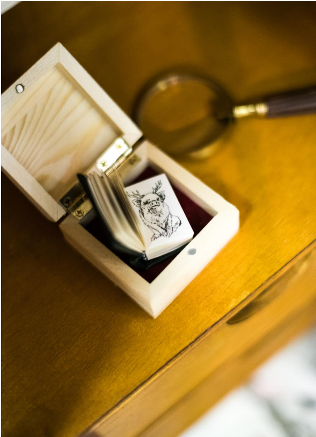
Slika 16. – Minijturna knjižica

Navedeni primjeri samo su neki od mnogih hibrida koji se kriju unutar moje kolekcije. Zahvaljujući uvjerljivom načinu rekonstruiranja hibridnih bića kroz crteže, grafike i skulpture, brojnim detaljima nastojala sam prikriti granicu između fikcije i stvarnosti s namjerom zastrašivanja i preispitivanja čovjekove savjesti.