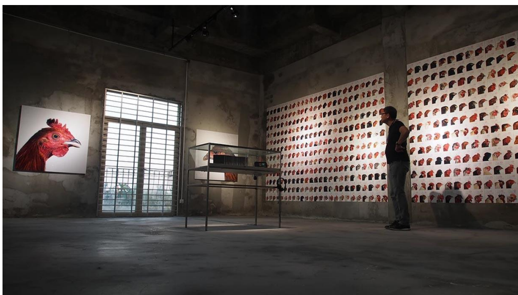
Slika 8. – Koen Vanmechelen, Leaving Paradise , Art Sanya, Hainan (Kina), 2013.g.

Vanmechelen preuzima identitet kokoši kao metaforu ljudskog života i njegova odnosa prema biološkoj i kulturnoj raznolikosti planeta. Višegodišnjim križanjem i eksperimentiranjem projekt CCP uspio je stvoriti generacije otpornijih i snažnijih kokoši za koje tvrdi da pomiču granice i doprinose stvaranju novog oblika evolucije s bezbroj genetskih kombinacija i mogućnosti.