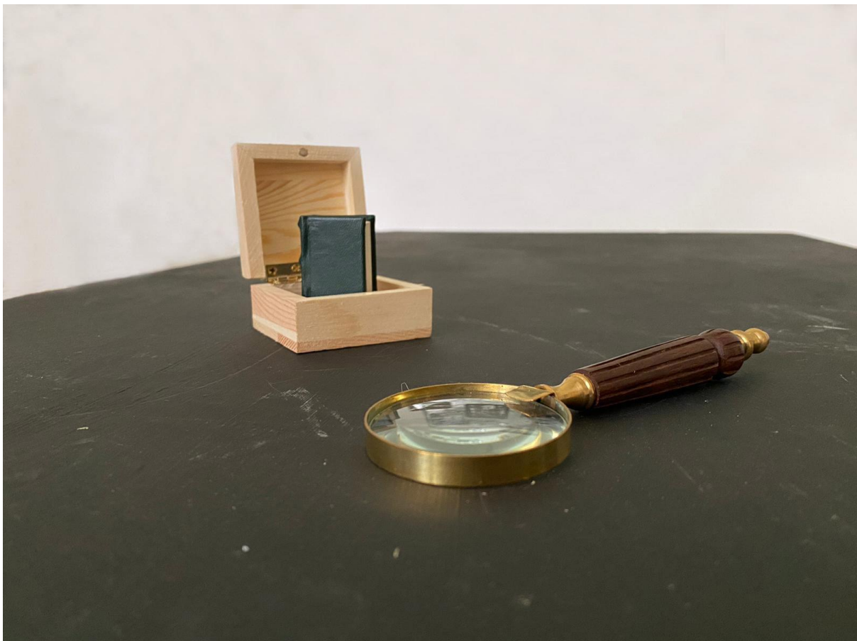
Slika 35. – Minijturna knjižica i povećalo