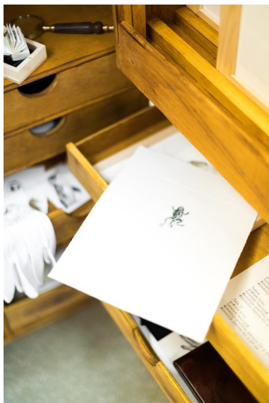
Slika 1. – Kabinet čuda, otvoreno

Svojim skupljačkim nervom, sistematiziranjem i sortiranjem priručnika i kolekcije prikupljenih i pridodanih autorskih eksponata, formirala sam vlastiti „kabinet čuda“ (engl. cabinet of curiosities) kao umjetnički iskaz kroz povezivanje ekologije i likovnog djelovanja.