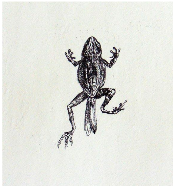
Slika 14. – Žabica , 2019. g., bakropis

U ovoj kategoriji, uz već spomenuti primjer Flamingoshrimpa , izdvojila bih i zbirku Žabica . Hibrid žabice u mojim radovima nastao je svojevrsnim križanjem otrovne tropske žabe i kolibrića. Sitnoj žabi dodane su ptičje kandže. Zbog zadržanog smrtonosnog otrova zlatne tropske žabe i dodatne mogućnosti leta tako „poboljšane“ žabice predstavljaju jedno od mogućih oružja budućnosti. Njihovi ih vlasnici uzgajaju, manipuliraju njima i obučavaju ih kako bi im mogle poslužiti kao oružje, smrtonosni metci protiv neprijatelja.