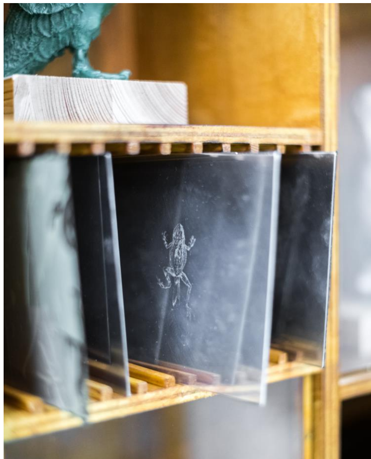
Slika 30. – Detalj postava