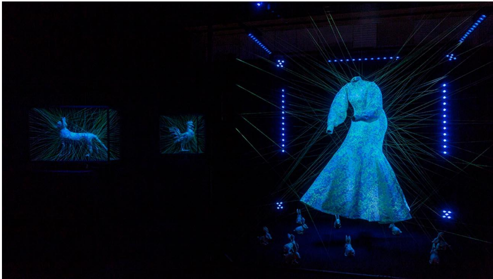
Slika 6. – Another farm, Modified Paradise, 2018. g., instalacija

Također sam naišla i na termin hibrida, bića kod kojih je bilo koje potomstvo proizišlo iz križanja dviju genetički različitih jedinki. Rani primjeri hibridnih bića vidljivi su u grčkoj mitologiji. Jedan od najharmoničnijih hibrida iz grčkih mitova je kentaur, polučovjek i polukonj. Ovdje ga u Metamorfozama naziva biformom heterogenetskog karaktera, zbog čega u pitanje dovodi određeni kentaurski arhetip. Bilo je potrebno nekoliko stoljeća kako bi se formirao arhetip kentaurskog hibrida s konjskim nogama i ljudskim torzom. Kentauri simboliziraju srdžbu i primitivno barbarstvo, ali Hiron, „najpravedniji kentaur“ (Ilijada, XI, 832), bio je učitelj mnogim grčkim junacima koje je poučavao umjetnosti, lovu i medicini.