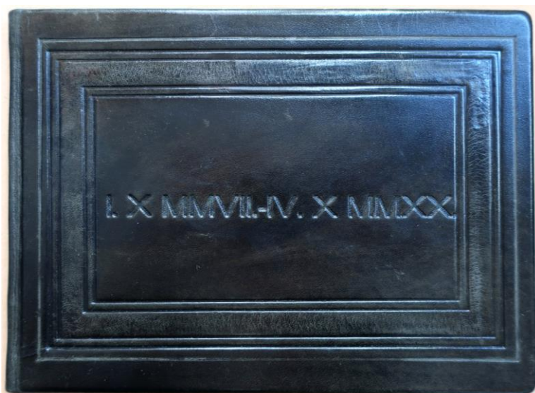
Slika 9. – Priručnik za praćenje staništa, 2017. – 2020. g.