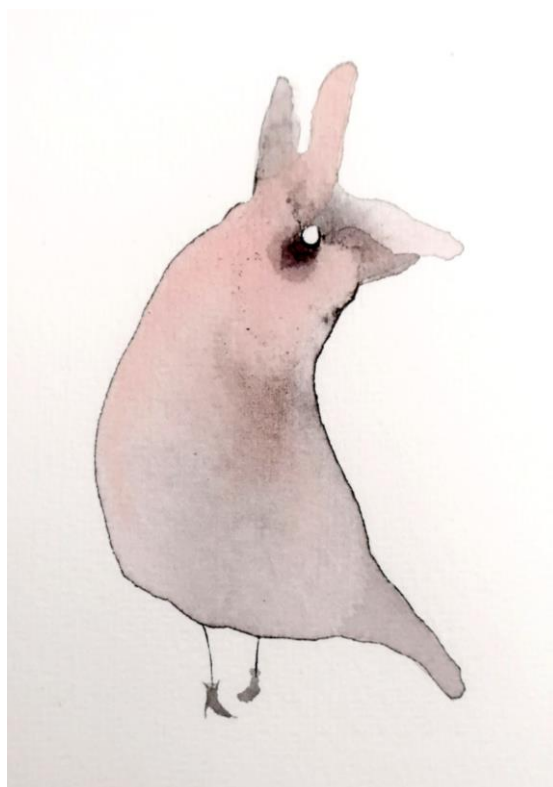
Slika 18. – Ilustracija čudnovatog bića