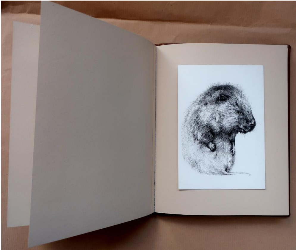
Slika 33. – Knjižica , 2017. – 2020.g., detalj