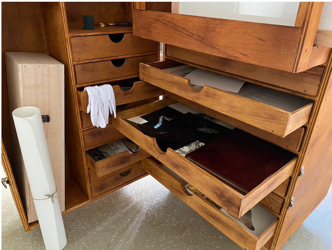
Slika 20. – Detalj postava

Radi bolje preglednosti i razlikovanja vrsta koje sam proučavala i dodatno obrađivala pojavila se potreba za razdvajanjem, sortiranjem u kategorije, pohranjivanjem i arhiviranjem sadržaja na jednome mjestu, s ciljem prezentiranja poruke koju komuniciram kolekcijom.