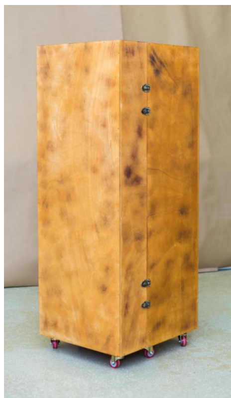
Slika 2. – Kabinet čuda, zatvoreno