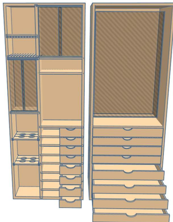
Slika 22. – Skica putnog kovčega, ormara