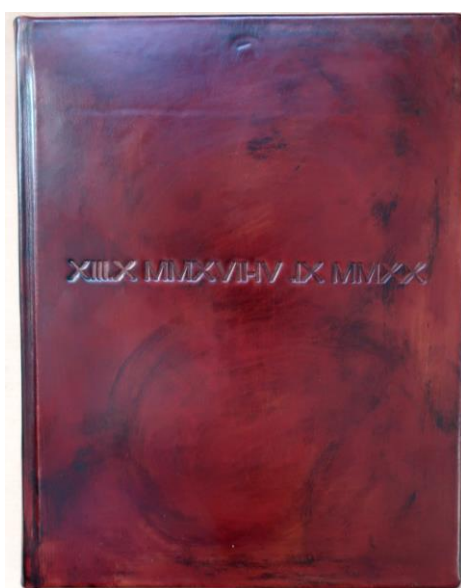
Slika 32. – Knjižica, 2017. – 2020.g.