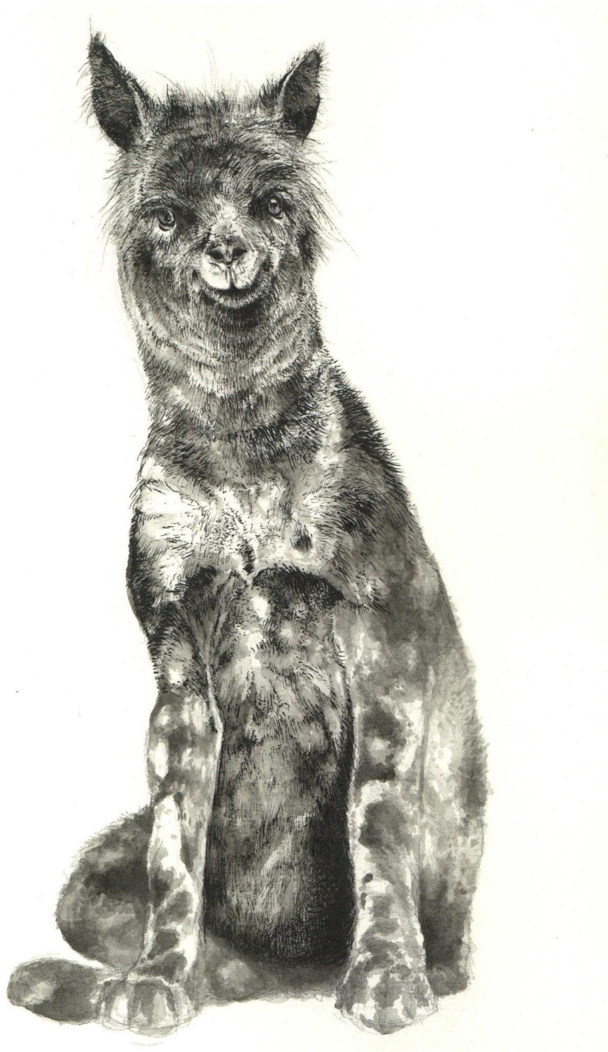
Slika 31. – Crtež divlje ljame