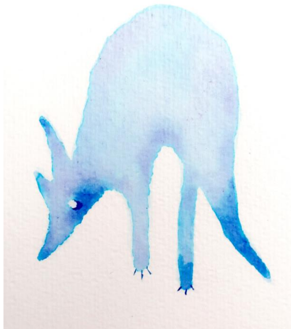
Slika 17. – Ilustracija lisice