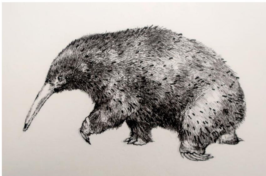
Slika 5. – Crtež echidne