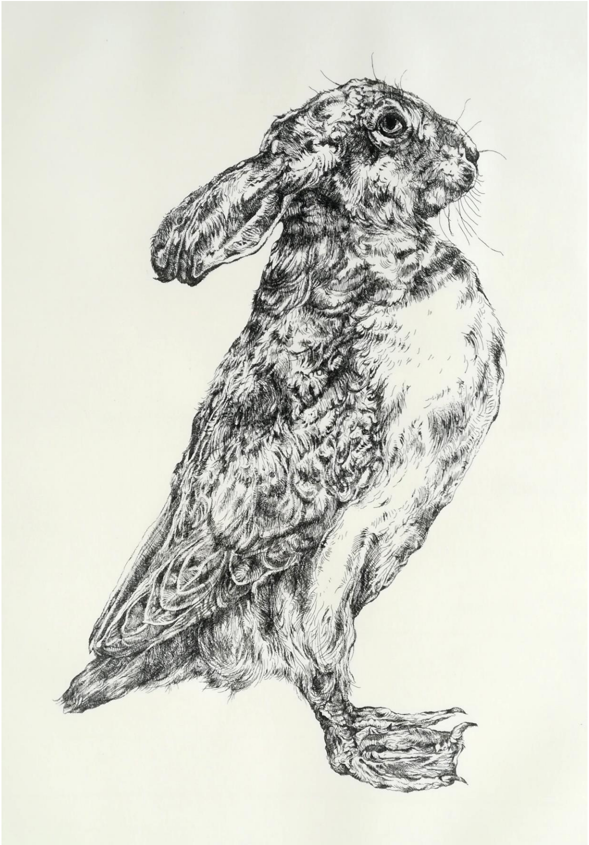
Slika 19. – Zecoptič, 2020.g., bakropis