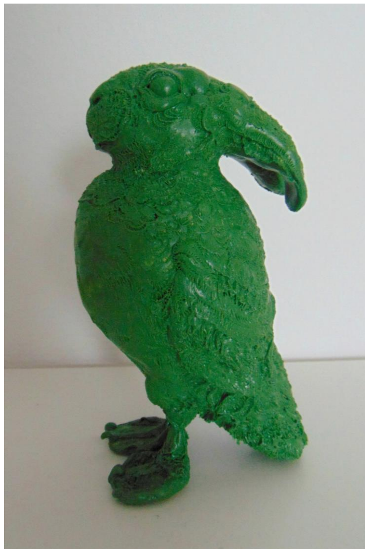
Slika 34. – Zecoptyč III , 2020.g.