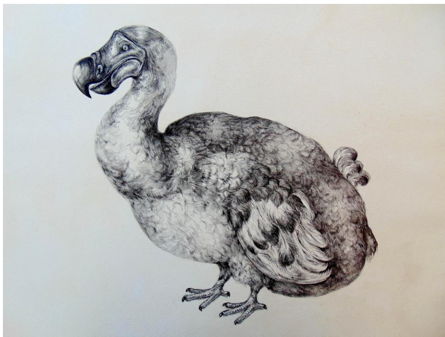
Slika 4. – Crtež ptice dodo