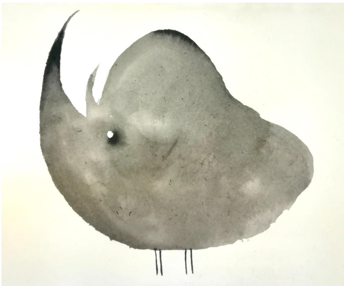
Slika 12. – Nosorog

Prisjetila sam se i kineskih vjerovanja o anamskim tigrovima, koje je J. L. Borges zabilježio u svojem Priručniku fantastične zoologije , pri čemu se ti tigrovi prikazuju kao svete vladajuće duhovne životinje. Zanimljivo je bilo usporediti nekadašnji odnos ljudi i životinja, kad su se ljudi prema životinjama odnosili s poštovanjem i neke štovali kao bogove, da bi u posljednjih nekoliko stoljeća čovjek odlučio sebe proglasiti svemogućim vladarom. Tako je odredio koje će vrste sačuvati, a koje iskoristiti za vlastite potrebe, ne misleći na moguće posljedice svojeg djelovanja.