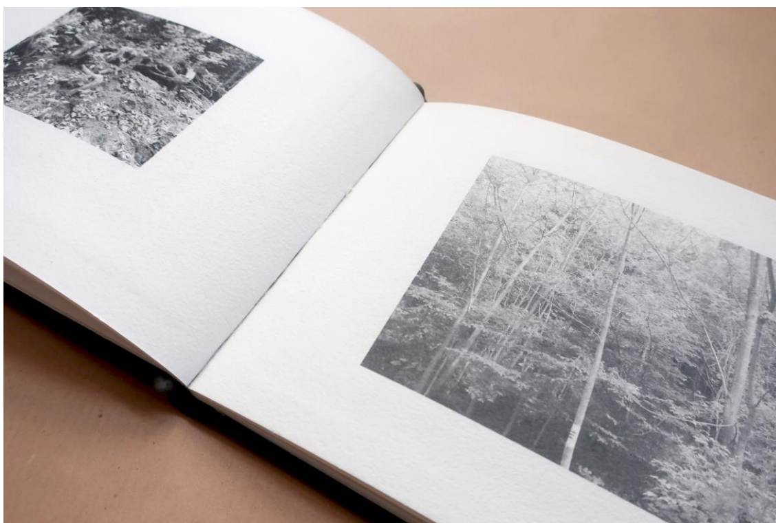
Slika 10. – Priručnik za praćenje staništa, 2017. – 2020. g., detalj

Detaljno sam zabilježila životne prostore organizama, njihove životne zajednice i njihove strukture, s naglaskom na kategorije utvrđenih vrsta. Prikupljanjem građe i njezinom obradom te vlastitim intervencijama ta bića podijelila sam u tri kategorije: