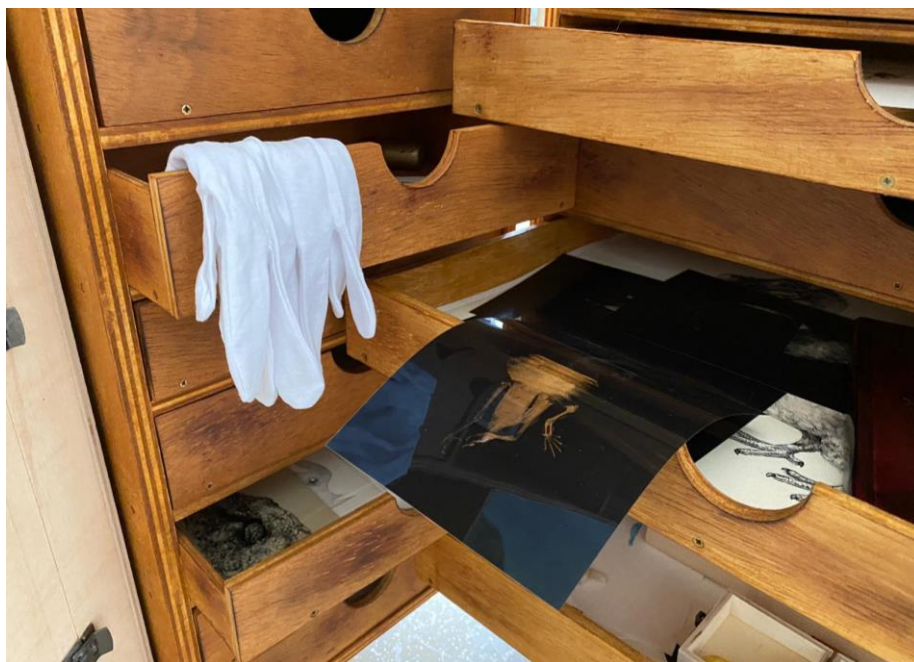
Slika 27. – Detalj postava

Koncept mojega Kabineta čuda pružio mi je mogućnost sortiranja i spremanja prikupljene i/ili svojeručno izvedene kolekcije unutar jedinstvene zatvorene cjeline – putnog kovčega i prijenosnog ormara. Takav oblik prezentacije omogućio mi je organizaciju kolekcije unutar ladica, polica i skrivenih prečinaca ormara. Svojim sadržajem, eksponatima čudnovatih životinja i ostalih hibridnih rukotvorina Kabinet čuda propitkuje apsurd ljudske radoznalosti i bezrazložnog uplitanja u prirodna evolucijska načela, pozivajući promatrače na gledanje s razumijevanjem, prihvaćanje istine ljudskog zadiranja u prirodu, s nadom da će se ipak razviti empatija i razumijevanje odgovornih i svjesnih sudionika i da će ljudsko djelovanje prestati biti eksploatatorsko.