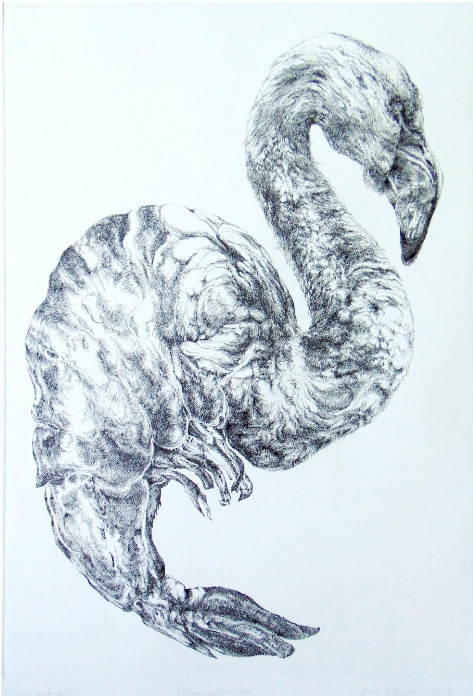
Slika 13. – Flamingoshrimp , 2019. g., bakropis

3. čudnovati, imaginarni hibridi , kao posljednja i najbrojnija kategorija moje kolekcije Imaginarne hibride stvarala sam kombiniranjem dijelova različitih stvarnih bića. Brojne kombinacije i sloboda stvaranja dovedeni do apsurda; postojanje i predstavljanje najbizarnijih hibrida ilustrirano je kroz sulude i bezrazložne kombinacije koje bi se eventualno mogle dogoditi i u stvarnosti ako čovjek ne osvijesti problem manipuliranja i neodgovornog zadiranja u prirodu.