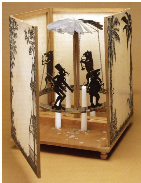
Slika 25. – McLaughin Bros, Gyrating shadow lantern , 1875. g., kolekcija Richarda Balzera

Kolekcionari bi zatim proučavali i sortirali pronađene dragocjenosti na različite načine čime bi ostvarili cjelinu, vlastiti kabinet čuda. Pronađeni predmeti sa sobom su u kabinete unosili stoljetne legende i mitove svojeg vremena, čime su kabineti čuda preuzeli ulogu svojevrsnih muzeja s ciljem učenja i poučavanja.