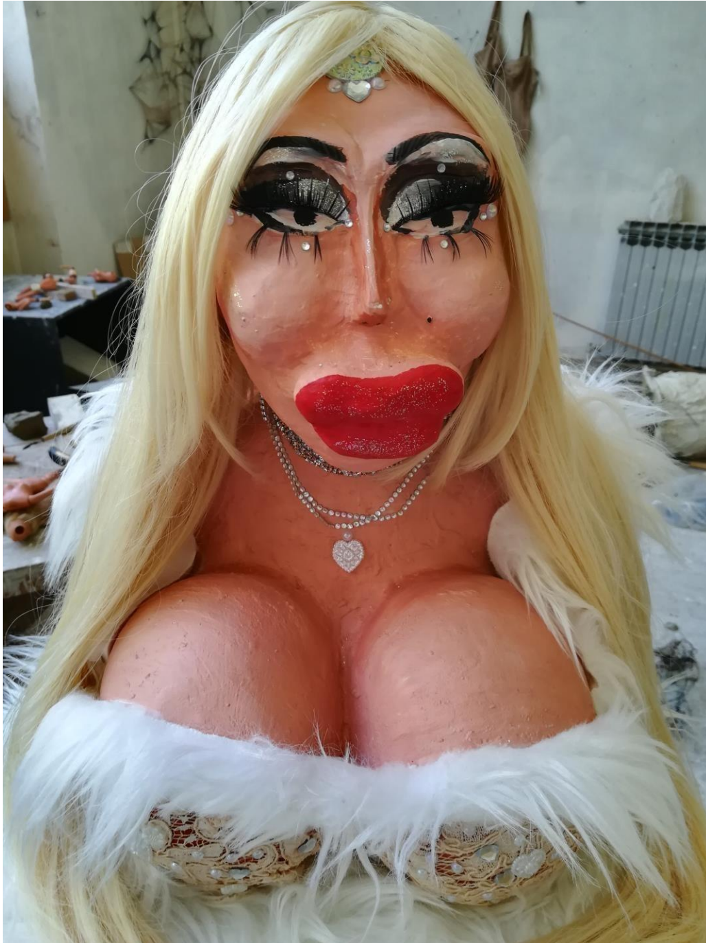
Venera , 2021., gips, stakleni mat, akril, ostali materijali (perika, krzno, umjetne trepavice, cirkoni)