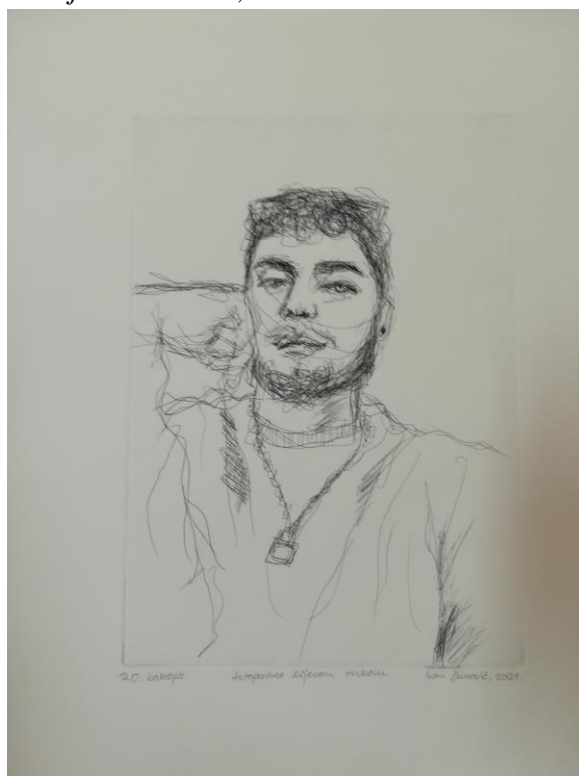
Bakropis, 210 x 297 mm