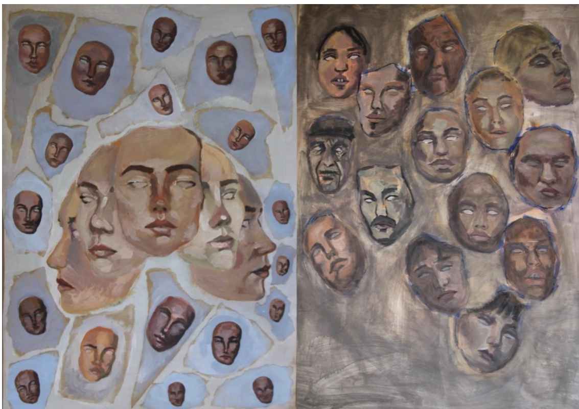
Autoportret , 2020., tempera na papiru, 49x67.5 cm