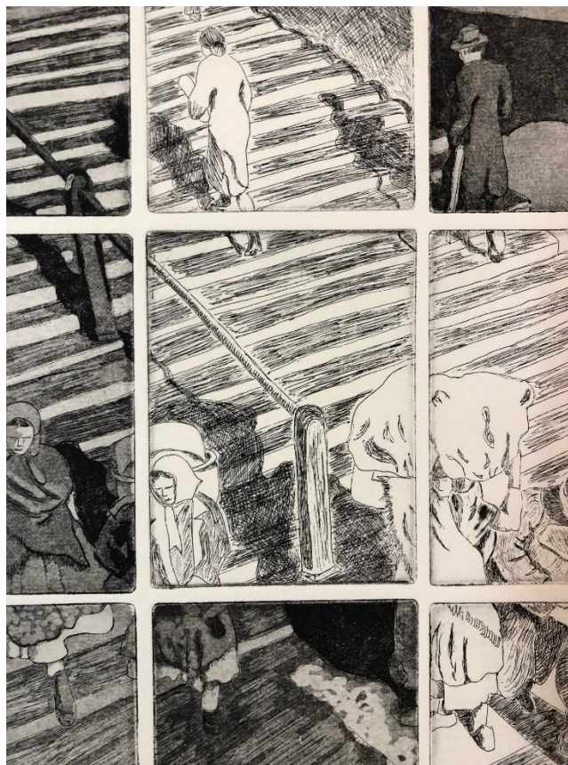
Dolac, 2021., bakropis, akvatinta, 23x31 cm