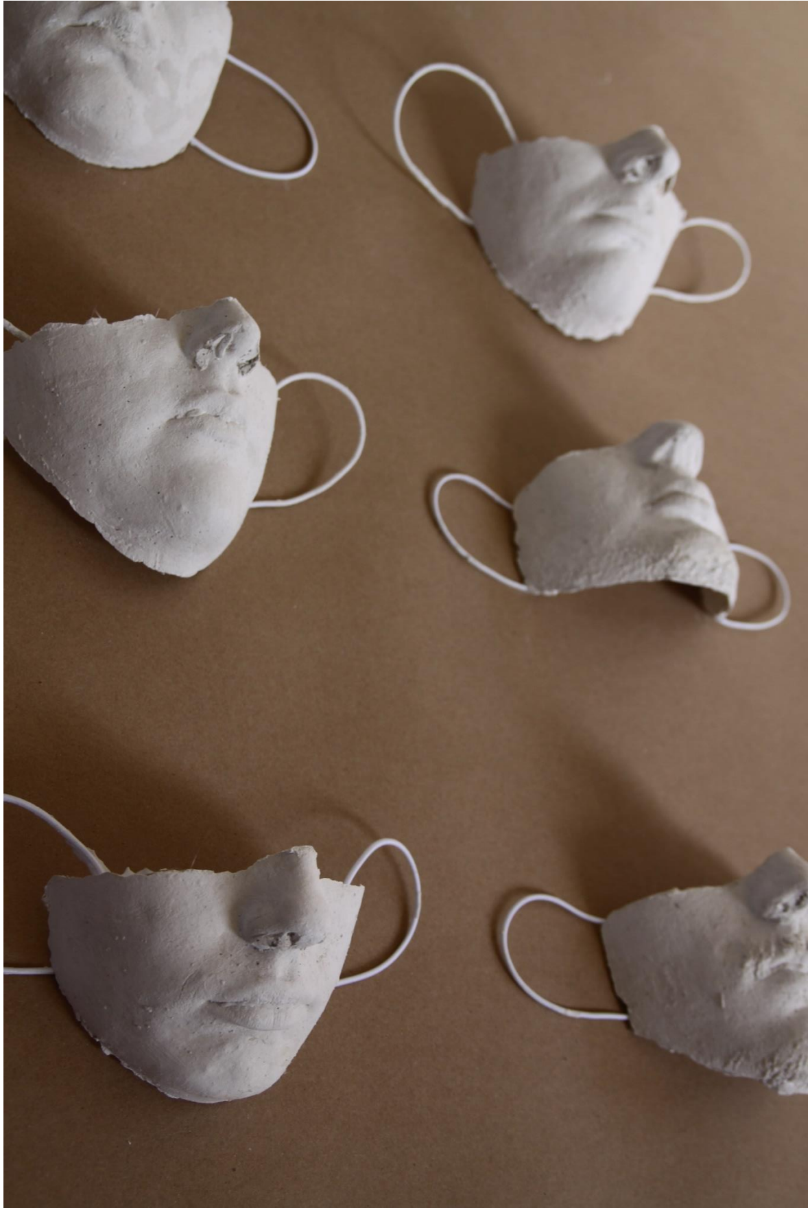
Maskiranje, 2020., gips, 10x15 cm