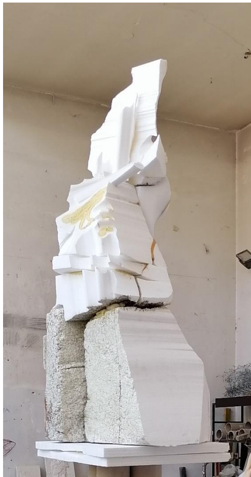
Skulptura I.(2021.,stiropor i purpen)