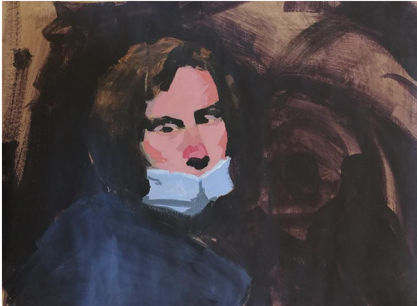
Vid (2021.,akril na papiru,43x57cm)