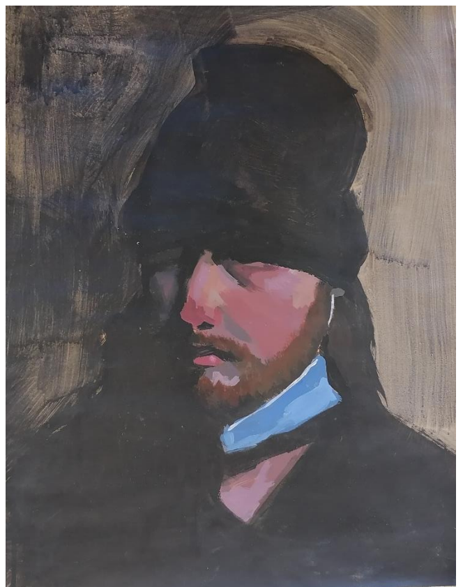
Jakov (2021., akril na papiru, 55x44cm)