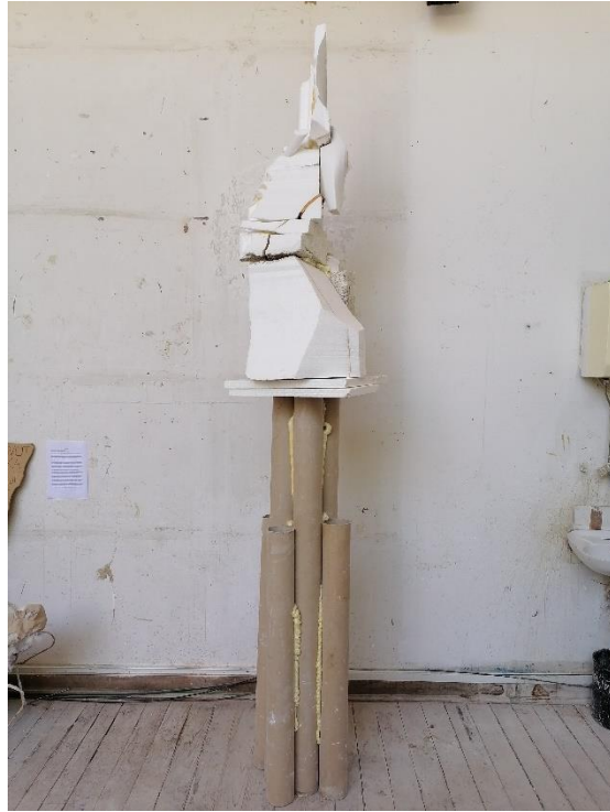
Skulptura I.(2021.,stiropor i purpen)