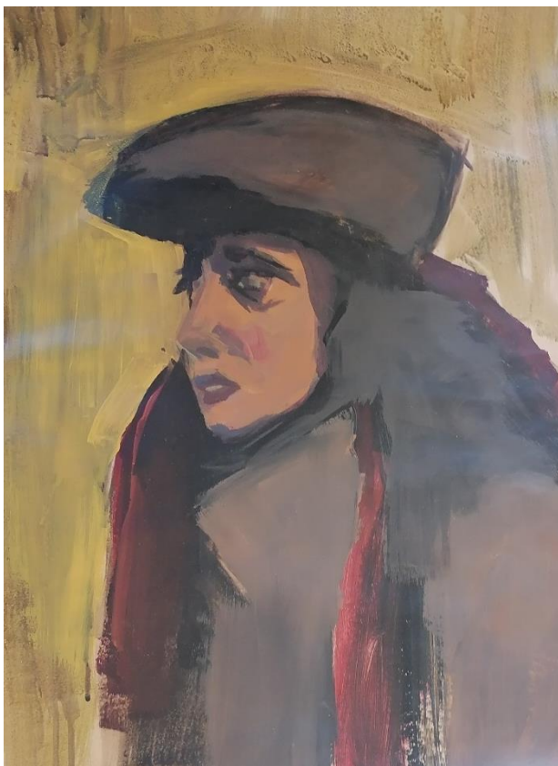
Nera (2021., akril ma papiru, 55x43cm)