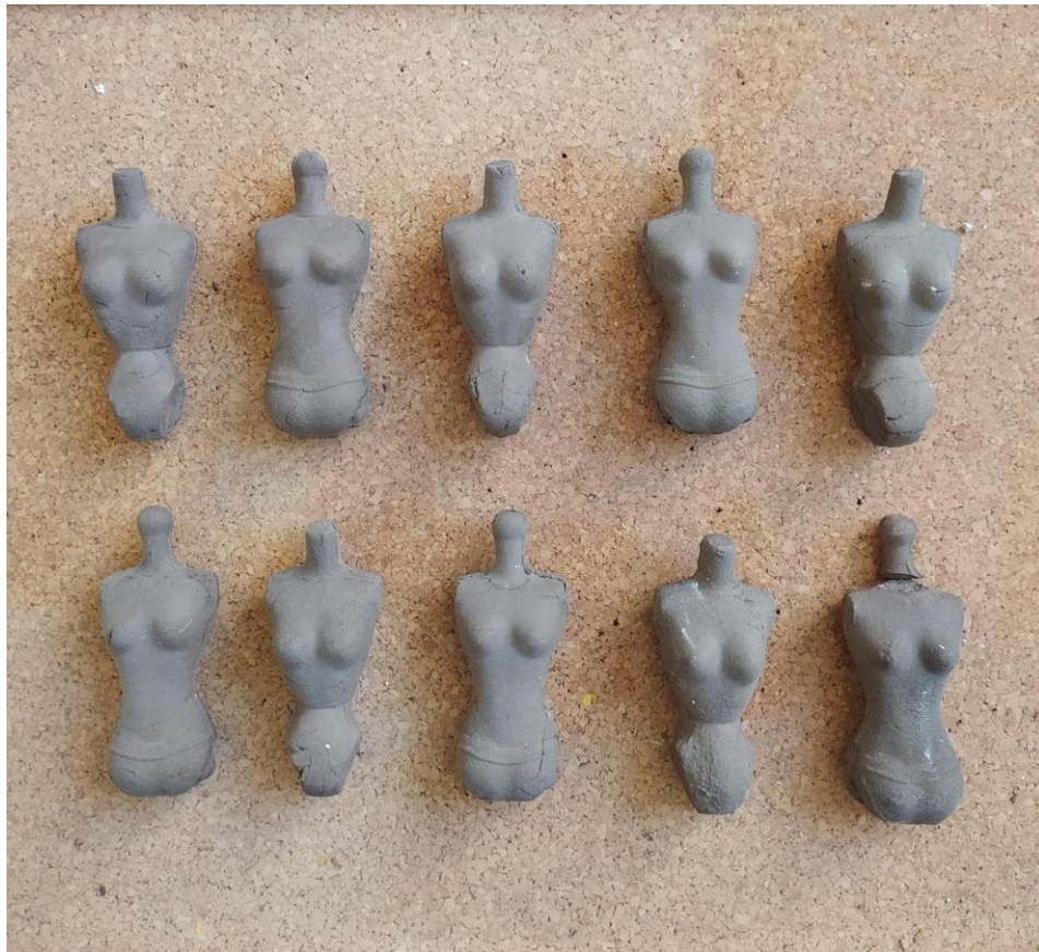
Antropometrije 10, 2021., pečena glina, 11 x 5 x 3 cm