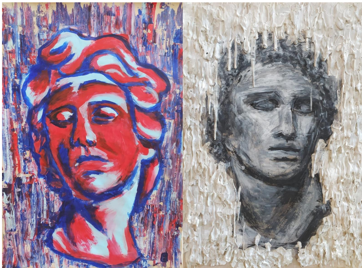
Glava 1, 2021., akvarel na papiru