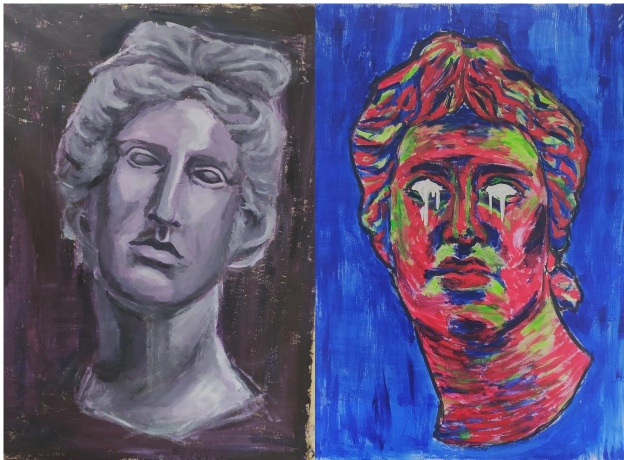
Glava 2, 2021., akril na papiru, 100 x 71 cm