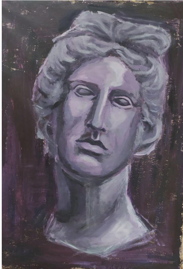
Glava 2, 2021., akril na papiru, 100 x 71 cm