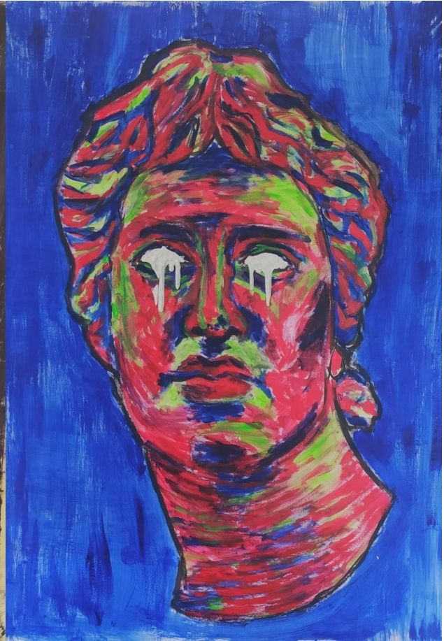
Glava 4, 2021., akril na papiru, 183 x 143 cm