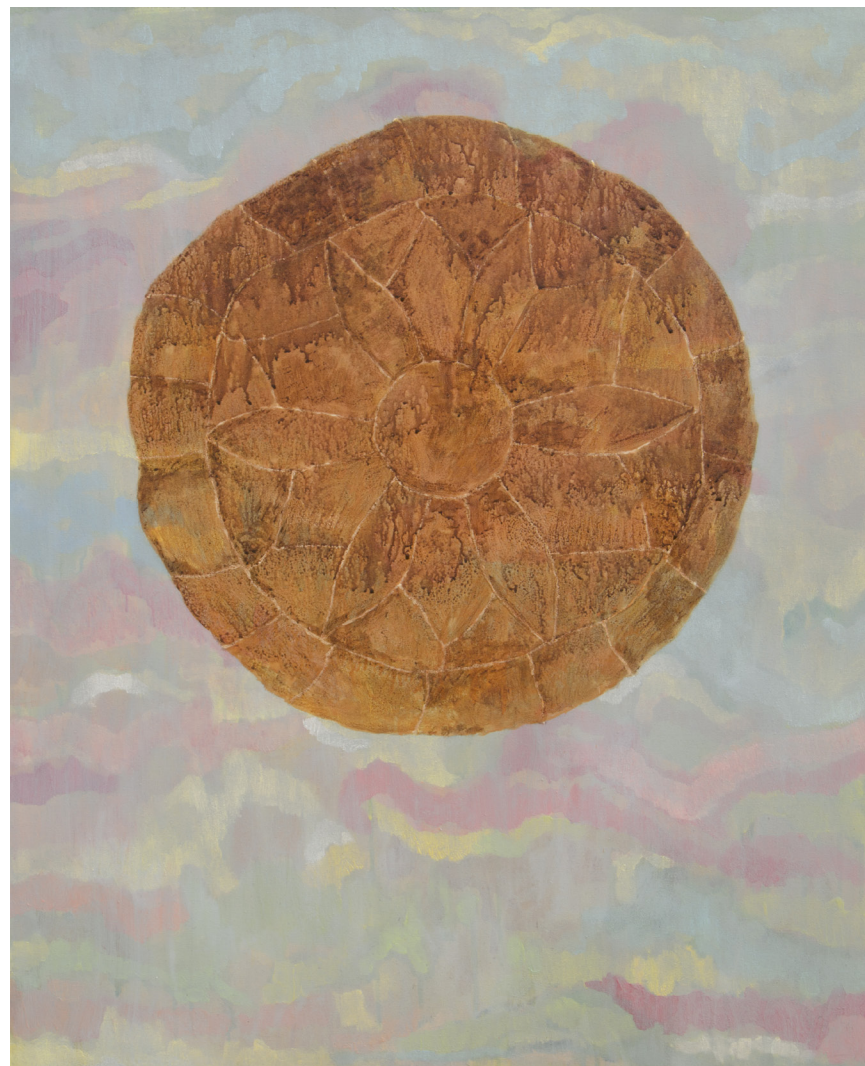
Abnegacija 2 100 × 81 cm akrilik, platno 2019.