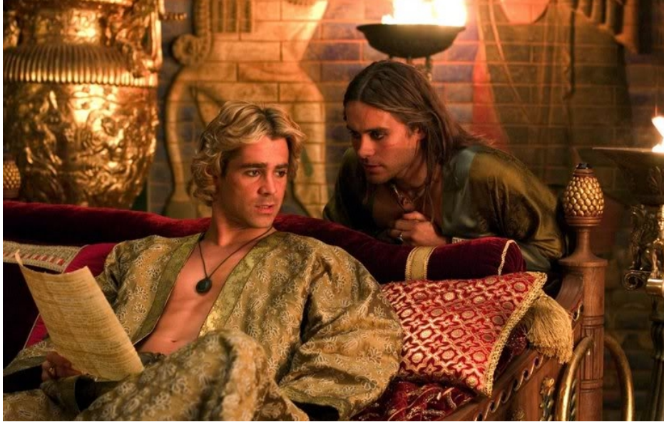
Primjer 3, Likovi Aleksandra i Hefestiona, Film iz 2004 Olivera Stonea, Alexandar Veliki

Radovi danas koji prezentiraju erotiĉnu muŹevnost u visokoj umjetnosti pripisuju se veĉinom homoseksualnim muŹkarcima, te ih se, gotovo pogrdno, svrstava kao "homoerotiĉna umjetnost". No radovi koji prikazuju Źene u sliĉnim ili istim kompozicijama ne naziva se "heteroerotizam" nego jednostavno "umjetnost". I tako rad Aleksandra Lessera, "Akt s leđa naslonjenog muŹkarca" (primjer 4.) ili rad Andyja Warhola, "Bodybuilder" (primjer 5) svrstavaju kao homoerotika i izlaŹe se na isto-kategoriziranim izloŹbama ( Ars Homo Erotica 13 ), dok se bilo koji Źenski akt (primjer 6), raĉen za oĉi heteroseksualnog muŹkarca, svrstava kao visoka umjetnost u visoke galerije.