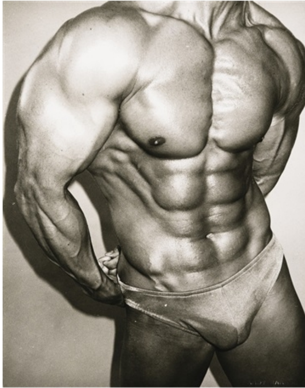
Primjer 5, Andy Warhol, Bodybuilder, 1982, srebrni print, 25.5 x 20.2 cm