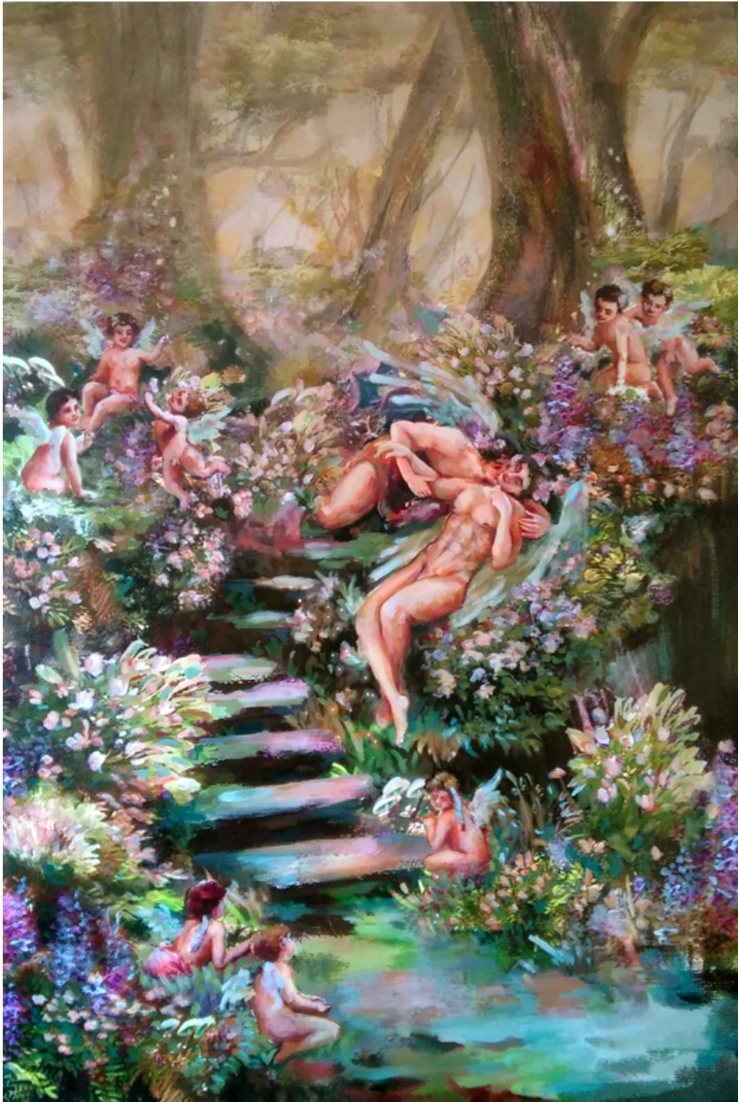
Slika 4, Ljubavnici, ulje i UV print na platnu, 116 x 79 cm