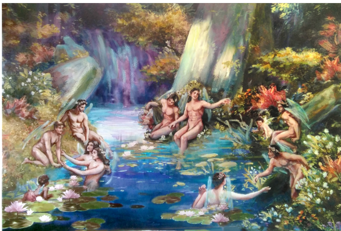
Slika 3, Kupači, ulje i UV print na platnu, 79 x 116 cm

Kupači pozivaju na uživanje u jezeru. Na uživanje u vlastitome tijelu i njegovoj ljepoti. Iskrenost i briga prema vlastitom tijelu i oslobođenje od stereotipa koje patrijarhat i toksična muškost postavljaju.