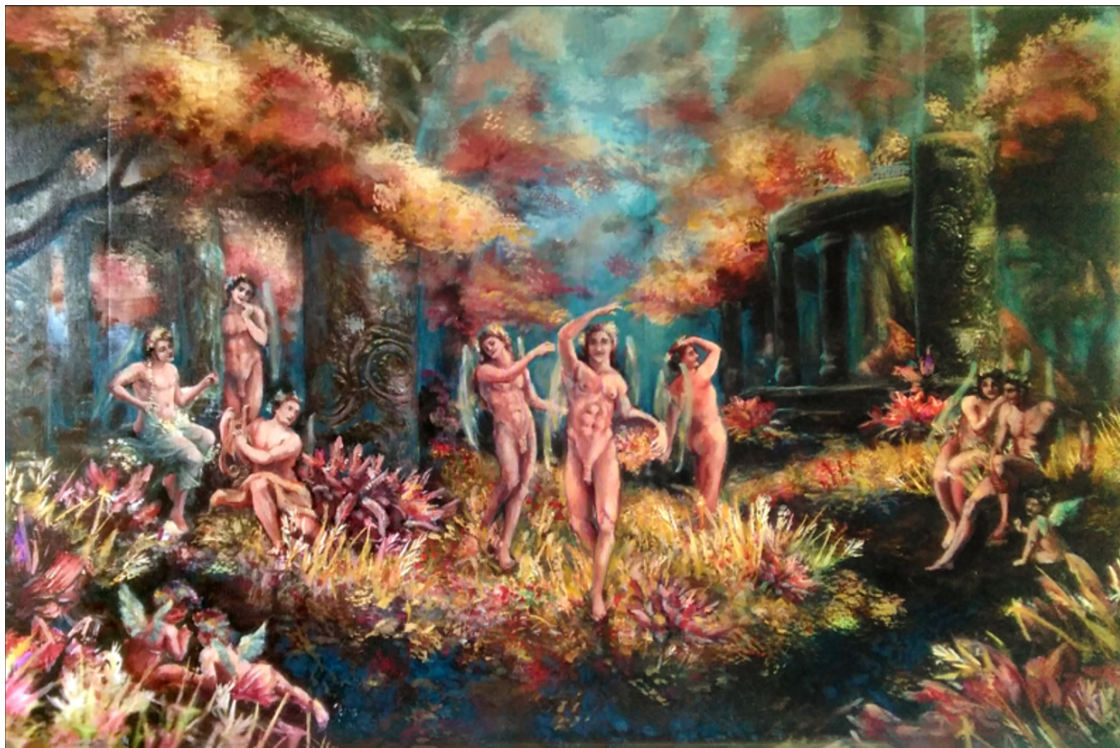
Slika 5, Plesači, ulje i UV print na platnu, 79 x 116 cm

Plesači pozivaju ljude da se opuste i zaborave na natjecanje "tko je veće muško". Opustiti tijelo i um te uživati u trenutku. Dozvoliti si uživanje je nešto što si muškarci ne dozvoljavaju kako ne bi ispali "djetinjasti i slabi". Vidimo plesače kako nesmetano igraju dok zainteresirani promatrači uživaju, ili pjevaju s njima, ne osuđuju ih niti diskriminiraju.