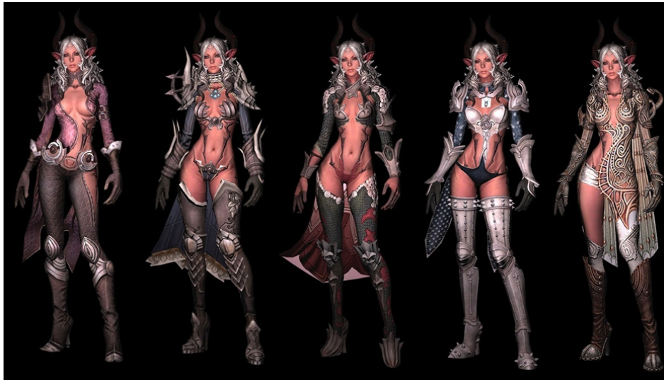
Primjer 1 Koncept za odjeću ženskih likova, Tera online 6

Umjetnost i povijest, kroz stoljeća, stvorili su u društvu percepciju o rodovima gdje je muškarac uvijek heroj i da tome mora težiti, dok je žena nagrada za njegova djela, mora mu služiti i biti pokorna. To je danas najviše očito iz popularne kulture i medijima kao što su filmovi, TV serije te video igre. Muškarac je uvijek prikazivan kao snažan i jak, mišićav i grub, nikako erotičan ili seksualiziran. Dok je žena jedino relevantna ako je lijepa i privlačna (u seksualnom smislu). Ako žena uzima glavnu ili drugu glavnu ulogu, njena snaga i moć ne dolazi iz njene mogućnosti da pobjedi protivnika, nego da ga šarmira svojom ljepotom. Drugim riječima, njena moć dolazi iz toga što je seksualizirana svojim dizajnom (Primjer 1). U svom YouTube videu: Lingerie is not Armor - Tropes vs Women in Video Games 4 , Feminist Frequency 5 ukazuje baš na taj problem u pop kulturi, video igre specifično. Jake i neovisne žene izjednačavaju sa seksualiziranim ženskim tijelom i pokretom što stvara toksične predrasude i očekivanja od žena i muškaraca u društvu: relevantne žene su one koje su lijepe i seksualizirane, a muškarci moraju biti jaki i grub, te su uvijek heteroseksualni.