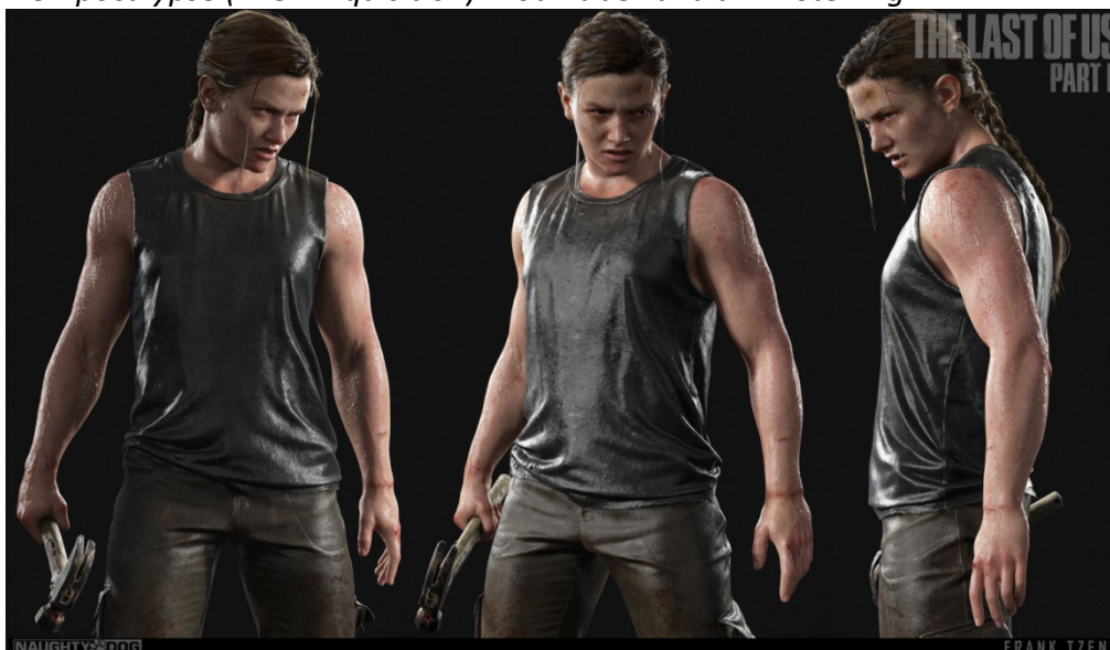
Primjer 2, Dizajn lika "Abby" 10

mogućnost mišićave žene u igri i općenito, komično je prezentirano u videu Muscles Of The Apocalypse (The Jimquisition) 8 You Tube kanala Jim Sterling 9 .