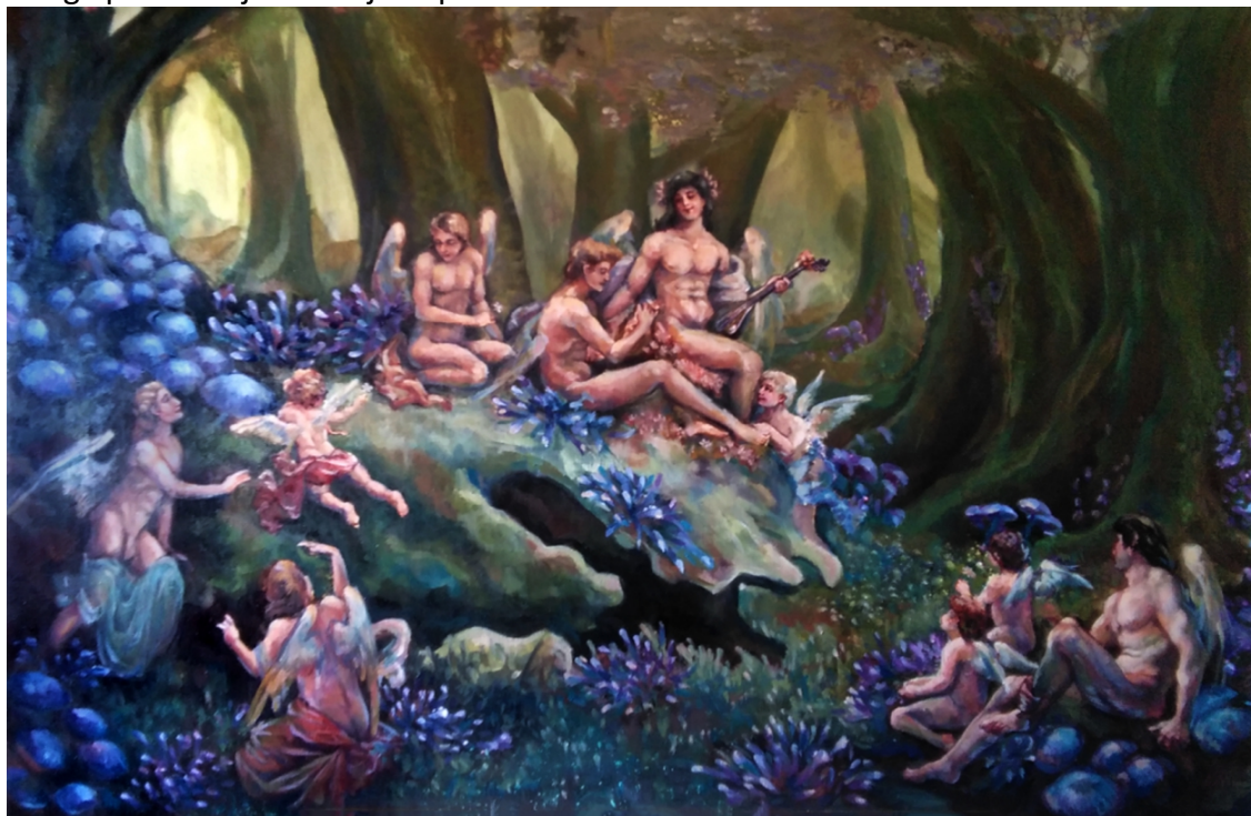
Slika 2, Emotivni , ulje i UV print na platnu, 79 x 116 cm

U radu Emotivni prikazujem zajednicu ljudi, kako zajedno sudjeluju u emocionalnom kolapsu pojedinca. On nije sam i izoliran, nego priznaje svoje stanje drugima, oni ga slušaju i sudjeluju u njegovom problemu. Ne osuđuju ga zbog toga već ga pokušavaju razumjeti i pomoći mu da se suoči sam sa sobom.