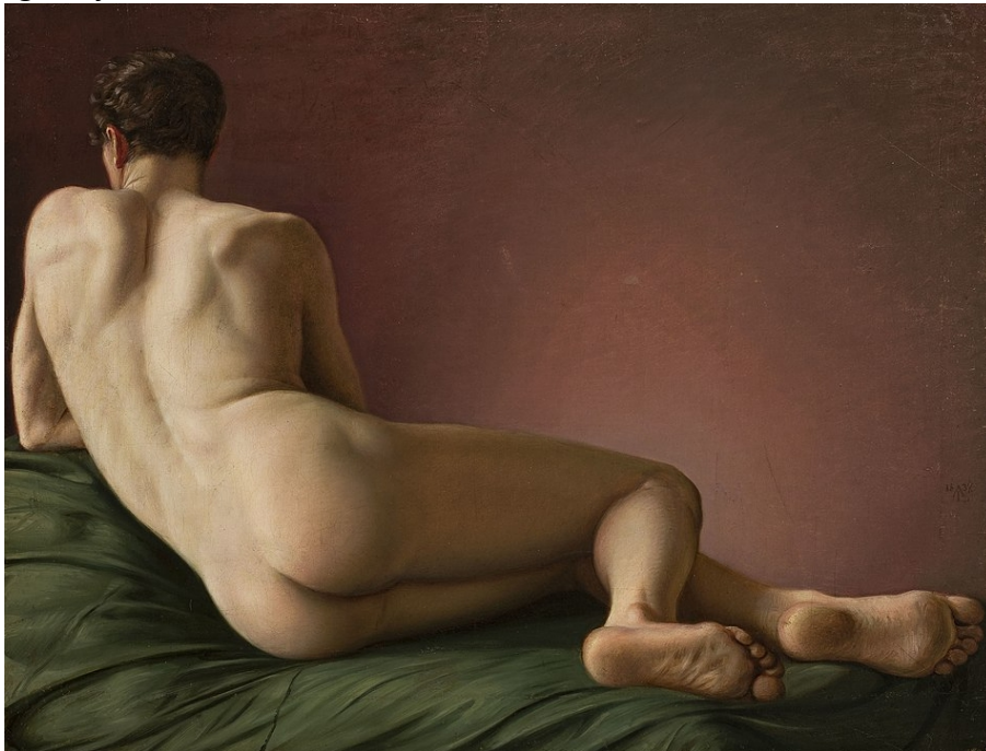
Primjer 4, Aleksandar Lesser, Akt s leđa naslonjenog muŹkarca , 1837.g., ulje na platnu, 60x73, Nacionalni muzej u VarŹavi

Radovi danas koji prezentiraju erotiĉnu muŹevnost u visokoj umjetnosti pripisuju se veĉinom homoseksualnim muŹkarcima, te ih se, gotovo pogrdno, svrstava kao "homoerotiĉna umjetnost". No radovi koji prikazuju Źene u sliĉnim ili istim kompozicijama ne naziva se "heteroerotizam" nego jednostavno "umjetnost". I tako rad Aleksandra Lessera, "Akt s leđa naslonjenog muŹkarca" (primjer 4.) ili rad Andyja Warhola, "Bodybuilder" (primjer 5) svrstavaju kao homoerotika i izlaŹe se na isto-kategoriziranim izloŹbama ( Ars Homo Erotica 13 ), dok se bilo koji Źenski akt (primjer 6), raĉen za oĉi heteroseksualnog muŹkarca, svrstava kao visoka umjetnost u visoke galerije.