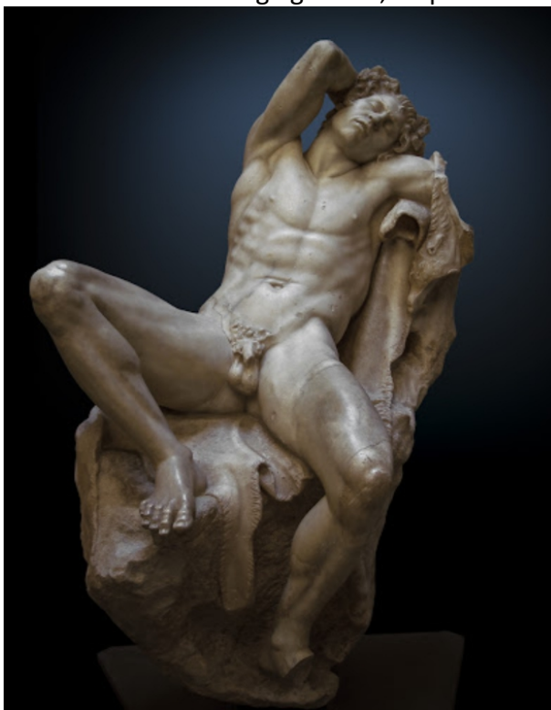
Primjer 7, nepoznati helenistički kipar Pergamene škole, Barberini Faun, mramor, 215cm, Glijptoteka Minhen, Njemačka

Radove koje povijest umjetnosti priznaje kao umjetnost iako prikazuju erotsku muževnost su većinom skulpture iz antičke grčke. Meni najdraži primjer je skulptura Barberinijevog Fauna, koja predstavlja usnulog satira u pasivnoj pozi, ne kao seksualnog agresora (kako se satri inače prikazuju) već kao objekt požude. Skulptura je iz helenističkog perioda (cca. 323-31 p.n.e.) u kojem osobni aspekti pojedinca u (romantičnoj/seksualnoj) vezi su stavljeni na prvo mjesto. Time oba partnera mogu izraziti svoje želje i požude, te biti aktivna ili/i pasivna uloga u svojoj vezi, što mijenja shvaćanja i samih seksualnih uloga. To se odražava i na umjetnost u helenizmu: skulpture se počinju izvijati iz statičnih poza i postaju dinamične, također sam narativ i protagonist skulpture postaje dinamičniji. Više nije samo mlad muškarac ili djevojka objekt požude- to postaje i odrastao muškarac. Tako se normaliziraju odrasli, mišićavi i dominantni muškarci u skulpturi kao protagonisti što otvara mogućnost satiru- simbolu seksualnog agresora, da postane objekt požude.