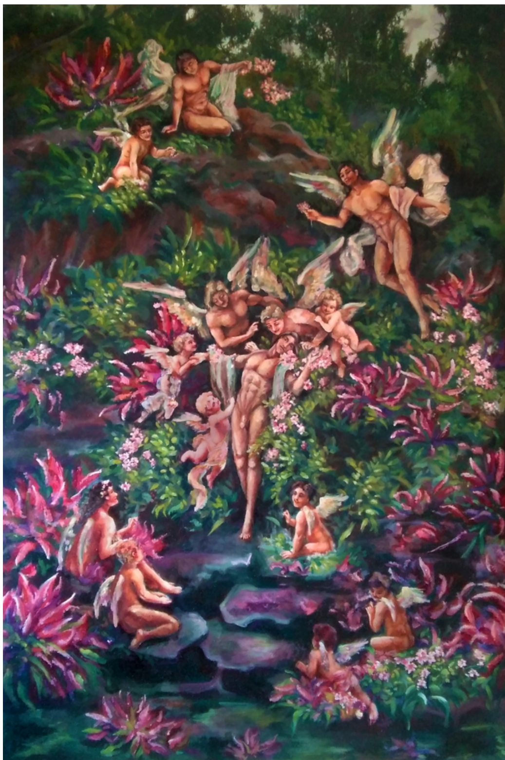
Slika 1, Roditelj, ulje i UV print na platnu, 116 x 79 cm