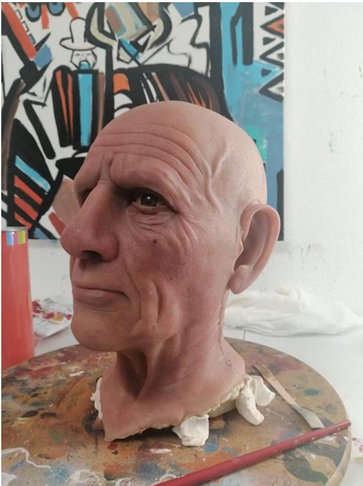
Slika 9. i 10. Lice skulpture „Lice čovjeka“; naglasak na boju kože, pjege i ožiljke