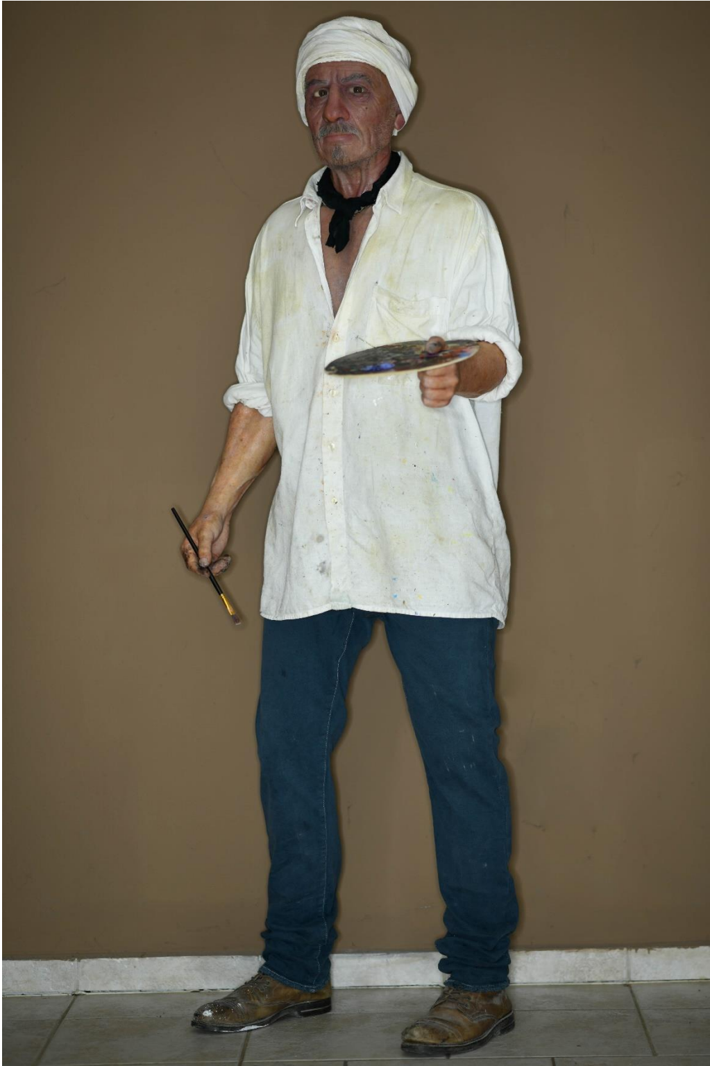
Slika 16. „Lice čovjeka“