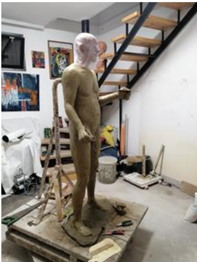
Slika 13. Proces rada modeliranja s glinom

S obzirom na to da skulptura koju izrađujem predstavlja slikara, koji je i dešnjak, izradio sam ju na način da sam u desnoj ruci postavio kist. Desna ruka u kojoj ga drži, spuštена je uz tijelo, dok u lijevoj, koja je podignuta prema naprijed (oko 90 stupnjeva), drži slikarsku paletu. Na desnoj ruci sam izradio istaknutije žile zbog položaja ruke i krvotoka, dok je lijeva u području podlaktice nešto šira zbog pregiba.