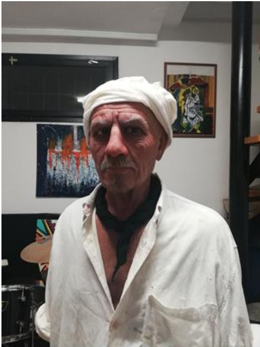
Slika 15. Odjeća umjetnika

Prilikom izrade skulpture cilj mi je, osim kistom i paletom, bio prikazati da skulptura starca predstavlja umjetnika. Iz tog razloga sam izbor odjeće iskoristio kao odličnu metodu kojom ću do moći prikazati. Odjeća koju sam odabrao predstavlja radnu odjeću koju umjetnik nosi kada provodi vrijeme radeći u ateljeu. Odjeća koja se inače koristi u ateljeu je obično istrošena, prljava i stara. Stoga sam odlučio odabrati vlastitu odjeću koju sam koristio u ateljeu, kao bijelu košulju koja je zaprljana uljenim bojama, gipsom i glinom, te stare zaboravljene čizme koje su i same po sebi pokidane i istrošene.