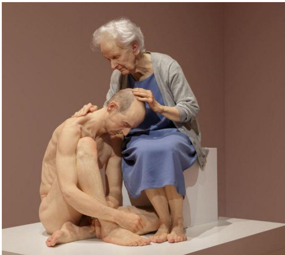
Slika 1. Sam Jinks – (The Deposition, 2017.)

U ožujku 2017. godine Nacionalna Galerija Australije je naručila rad od Sama Jinksa kao dio hiperrealistične izložbe koja je bila u listopadu 2017. godine. „ The Deposition “ je istoimeni kratki dokumentarni film o samome procesu izrade ovoga sada kultnog djela Sama Jinksa, koji je izrađen u samo nekoliko mjeseci a smatra se njegovim najvećim djelom do sada. Film „ The Deposition “ prikazuje Jinksa u svim fazama procesa rada te možemo vidjeti njegov pogled na tehničku izradu ovog djela u veoma detaljnim ali nažalost kratkim kadrovima. Gledajući „ The Deposition “ shvatio sam kako bih trebao pristupiti izradi ovakvoga djela te kako si olakšati sami proces izrade. Iako Jinks pristupa izradi sa puno različitih metoda što se tiče izrada skica, crteža i modela izrađenih u 3D printeru, ja sam se morao prilagoditi izvorima te metodama koje su mi dostupne.