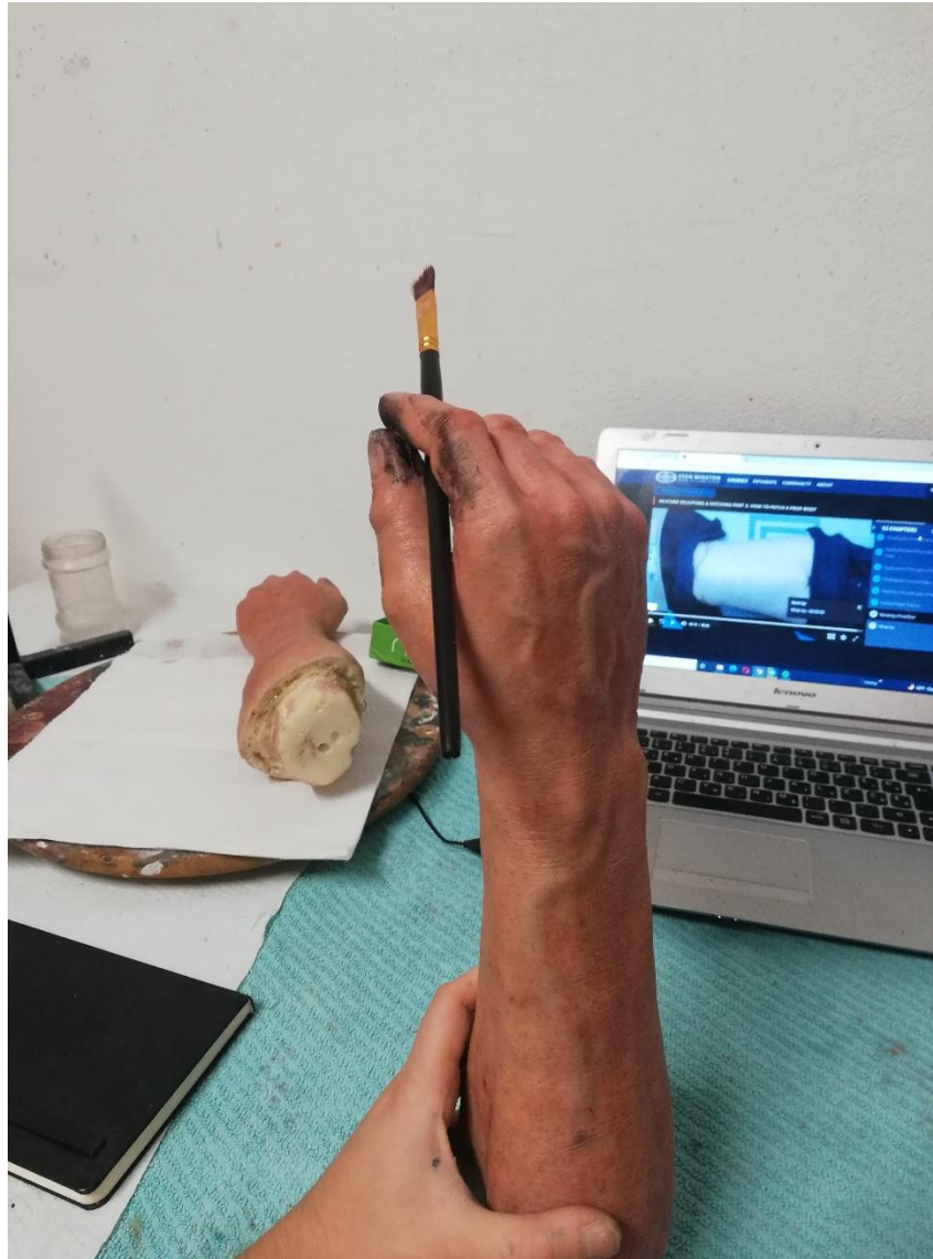
Slika 14. Proces izrade ruku

S obzirom na to da je tijelo starca prekrivano odjećom, ruke sam modelirao naknadno u NSP-u, te ih odlio u PLASTIL GEL-10. Ruke starca nastojao sam prikazati kao radničke ruke, istrošene, prljave, kao ruke koje simboliziraju mnogo godina mukotrpnog rada i prikazuju istrošenost kože.