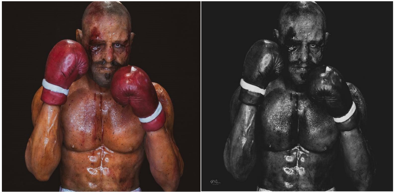
Slika 3. „Boxer, 2020.“