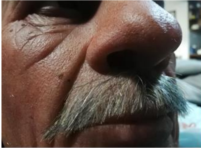
Slika 11. i 12. Umetanje dlake

Za umetanje brkova, brade i trepavica sam koristio kombinaciju bijelih i sivih ekstenzija, životinjskog krzna te crne dlake.