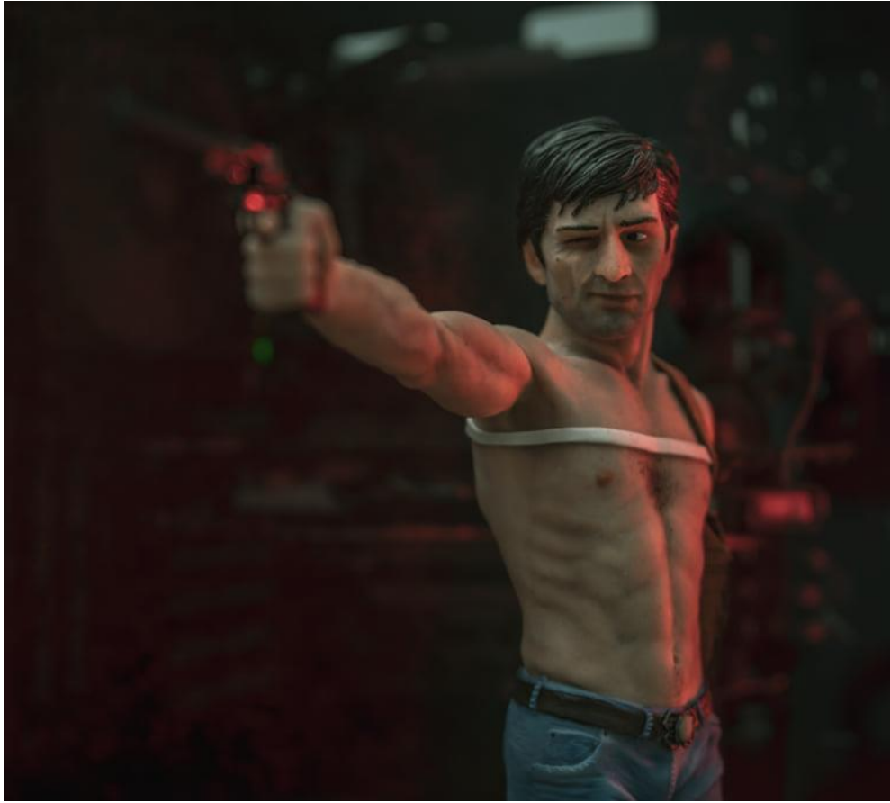
Slika 2. „Taxi driver, 2019.“ djelo inspirirano istoimenim filmom Martina Scorseseia iz 1976.