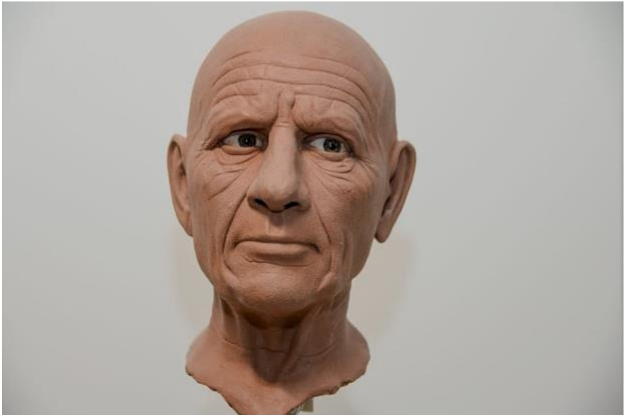
Slika 8. Portret u NSP-u (glava u procesu izrade skulpture)

Modeliranje starca (slikara) odnosilo se na stvaranje osobe koja je jednostavno nastala u procesu improvizacije modeliranja te sam imao osjećaj kao da se stvara sama od sebe. Ovoga puta sam mogao pristupiti izradi drugačije nego kod Loreninoga portreta. Veliki dio djela odnosi se na sam pogled starca, stoga sam odlučio odmah staviti oči u portret kako bih mogao kontrolirati položaj glave te izraz lica s njegovim pogledom u daljinu. To mi je omogućilo odmah razviti dubinu pogleda te pogled mističnost starca. S obzirom na to da sam modelirao portret starije osobe, ovoga puta sam teksturi kože pristupio puno agresivnije. Koža više nije bila glatka, nego puna bora, izbočina, asimetrije i ožiljaka.