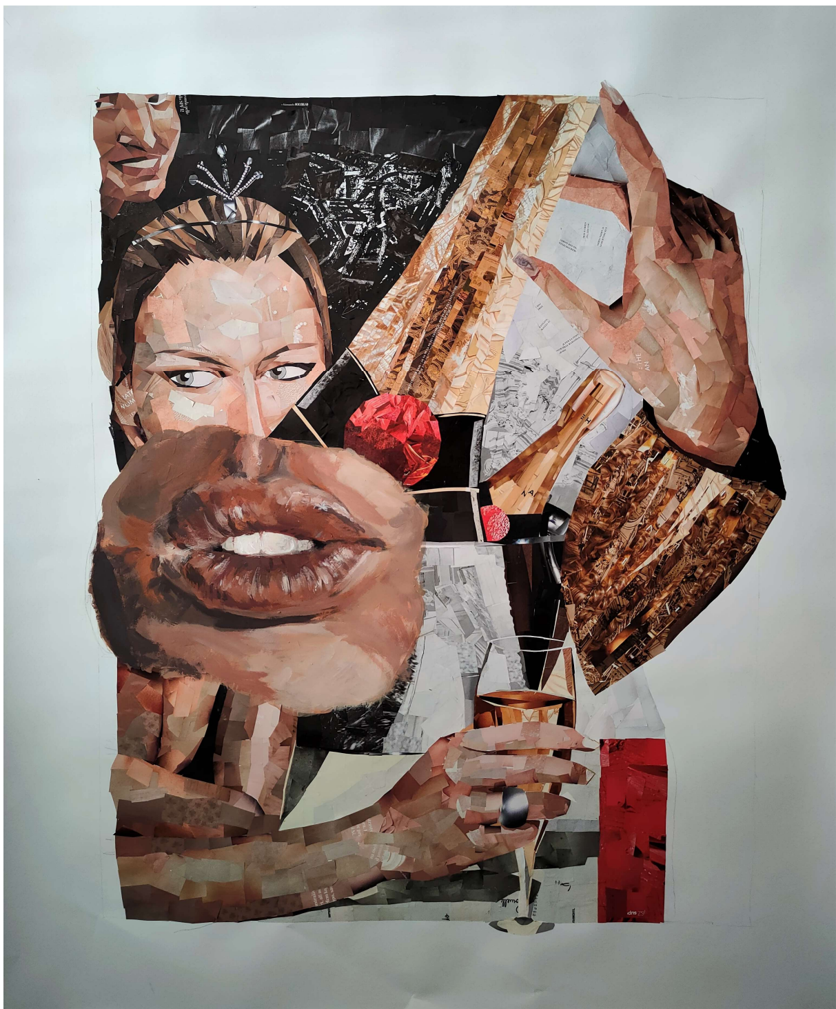
Božanstveno, kolaž na papiru, 120 x 100 cm