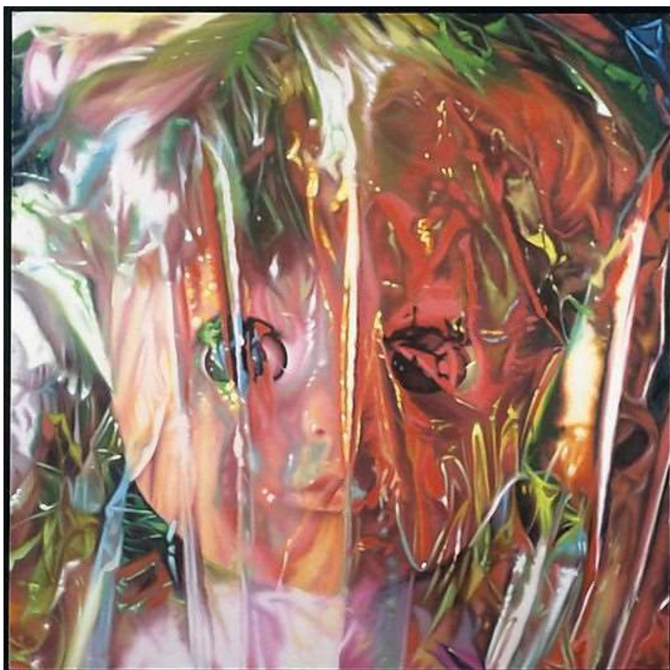
James Rosenquist; The Serenade for the Doll after Claude Debussy, Gift Wrapped Doll #16, ulje na platnu, 152.4 x 152.4 cm

Čitanje opisa slike polučilo je ispitivanje uzroka velikog porasta stremljenja ka bogatstvu i akumulaciji bespotrebnih stvari. Serija radova The Serenade for the Doll after Claude Debussy, Gift Wrapped Doll umjetnika Jamesa Rosenquista potiče asocijacije na spomenutu akumulaciju materijalnih dobara, u ovom kontekstu kod djece (igračke). Želja za mnoštvom igračaka vjerojatno je prvi susret ljudskog roda s konzumerističkom kulturom, ovdje prikazan kao poklon umotan u foliju.