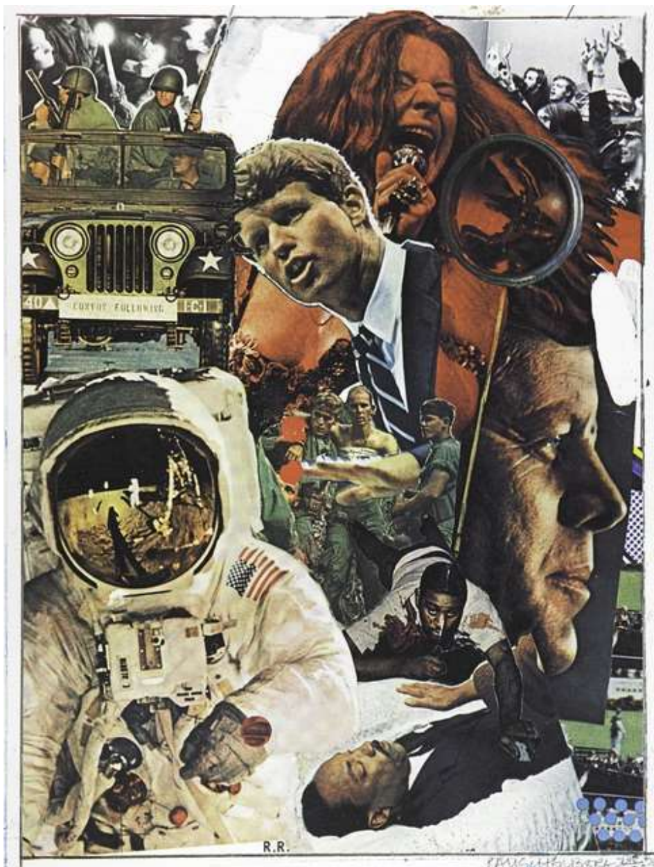
Robert Rauschenberg; Signs, sitotisak, 109.2 x 86.4 cm

Zadnje djelo ključno za razvoj ideje je kolaž Roberta Rauschenberga Signs koji na zanimljiv način prikazuje stanje svijeta: kombinacijom fotografija ljudi i predmeta značajnih za tadašnju kulturu.