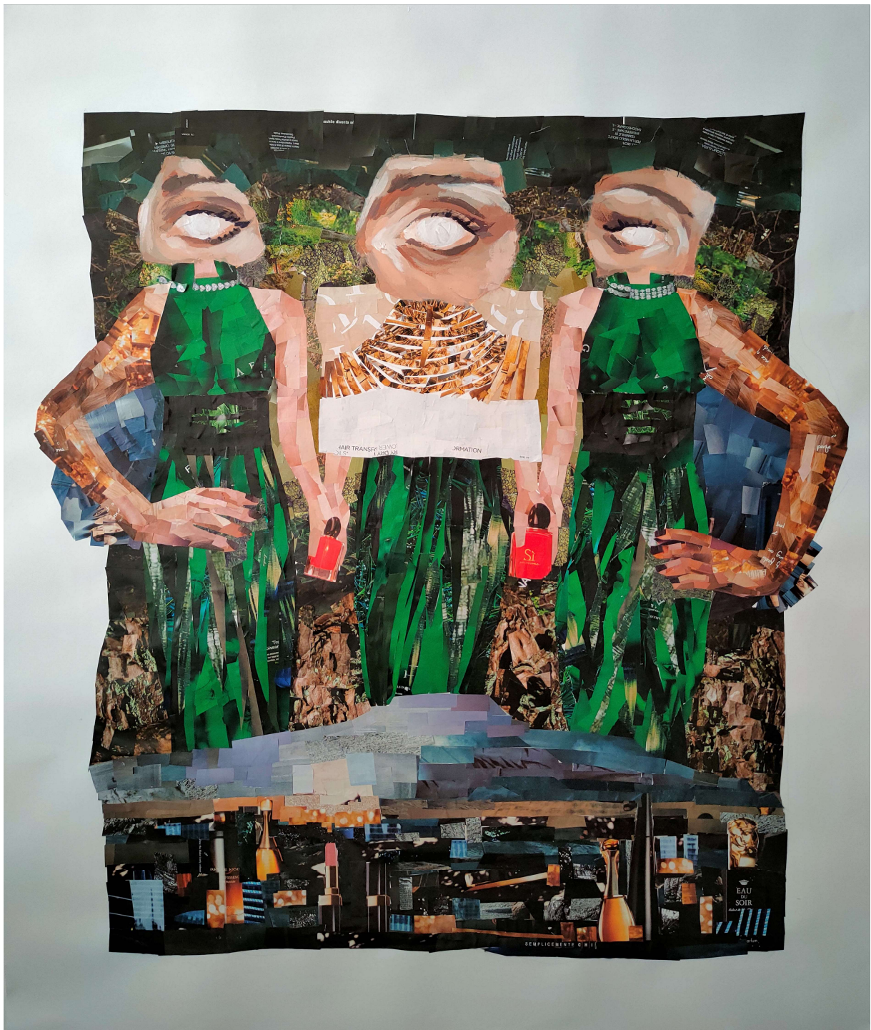
Jedinstvenost, kolaž na papiru, 120 x 100 cm