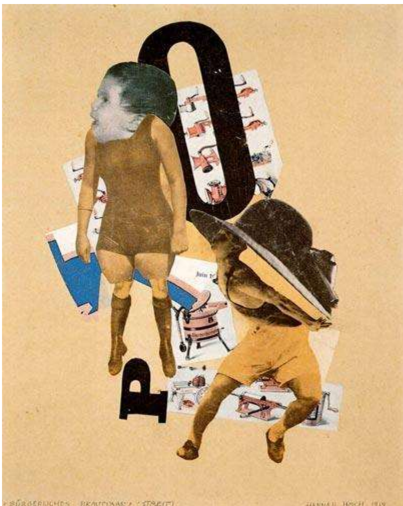
Hannah Höch; Bourgeois Wedding Couple , fotomontaža, 38 x 30.6 cm

Nadahnuće za radove prvenstveno dolazi iz umjetnosti pop arta , radova Andyja Warhola te Jeffa Koonsa koji slave idiom urbane kulture, ponekad s potvrdnom, ponekad s ironičnom ili kritičkom namjerom. Uz osvrt na pop art dolazi i umjetnost dadaizma kao inspiracija spomenutom pokretu. Daljnjim istraživanjem otkriveno je jedno od djela koje je proniknulo promišljanje materijalizma i konzumerizma, a to je kolaž Bourgeois Wedding Couple autorice Hanne Höch. Djelo je to kojim umjetnica predstavlja novi srednji sloj društva prepun nezasićenih potrošača koji kao savršene spužve upijaju kulturu koju dadaisti izruguju 5 .