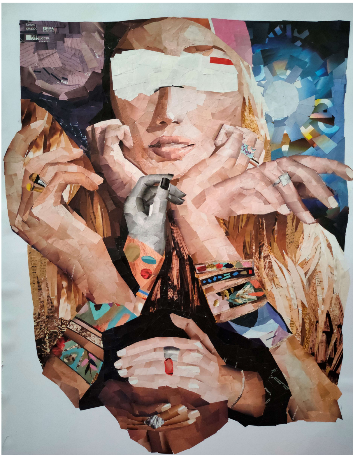
Maksimalizam, kolaž na papiru, 62 x 48 cm