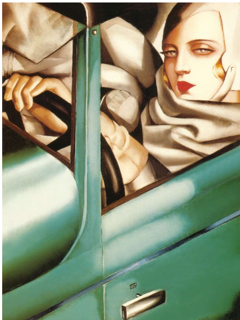
Tamara de Lempicka; Autoportrait (Tamara in a Green Bugatti), ulje na platnu, 35 × 26.6 cm

Pretraživanjem različitih izvora potvrda nove ideje nastaje u radovima Tamare de Lempicke, Jamesa Rosenquista te Roberta Rauschenberga. Tamara de Lempicka, slikarica svijeta 6 , svojim najpoznatijim radom, Autoportrait (Tamara in a Green Bugatti) , prenosi svoje samopouzdanje, hladnu ljepotu, neovisnost, bogatstvo te nedostupnost kao opis onog što se danas smatra idealom kojem mnogi teže.