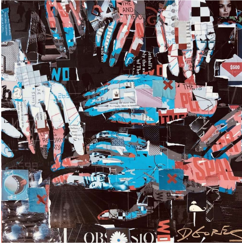
Derek Gores; Teamwork , kolaž na platnu, 30 × 30 cm

Kolaži koji su poslužili kao suvremeni uzori su Derek Gores – Teamwork , Arnaud Bauville – Le Combat de Trop , Silvio Severino – It feels good be so rich te Tavis Coburn – The New Face of Confidence 7 .