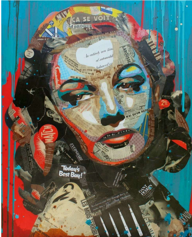
Arnaud Bauville; "Le Combat de Trop", kolaž na platnu, 100 x 120 cm