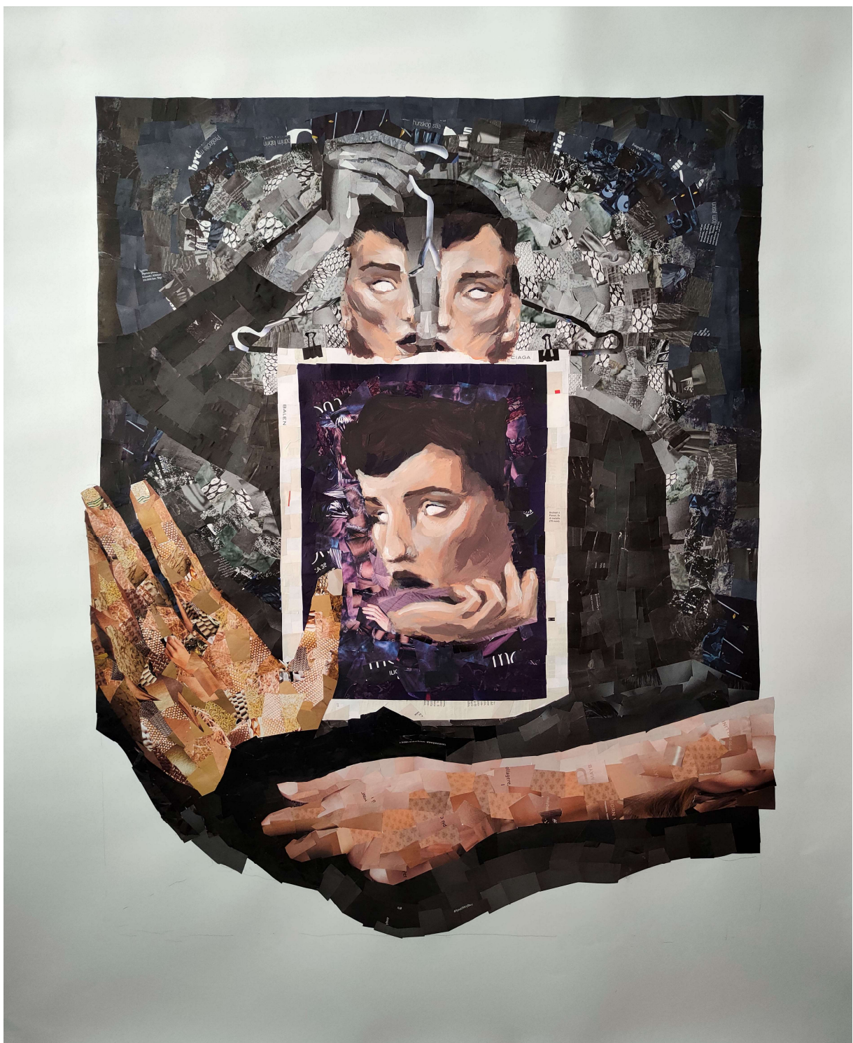
Neprocenjivo , kolaž na papiru, 120 x 100