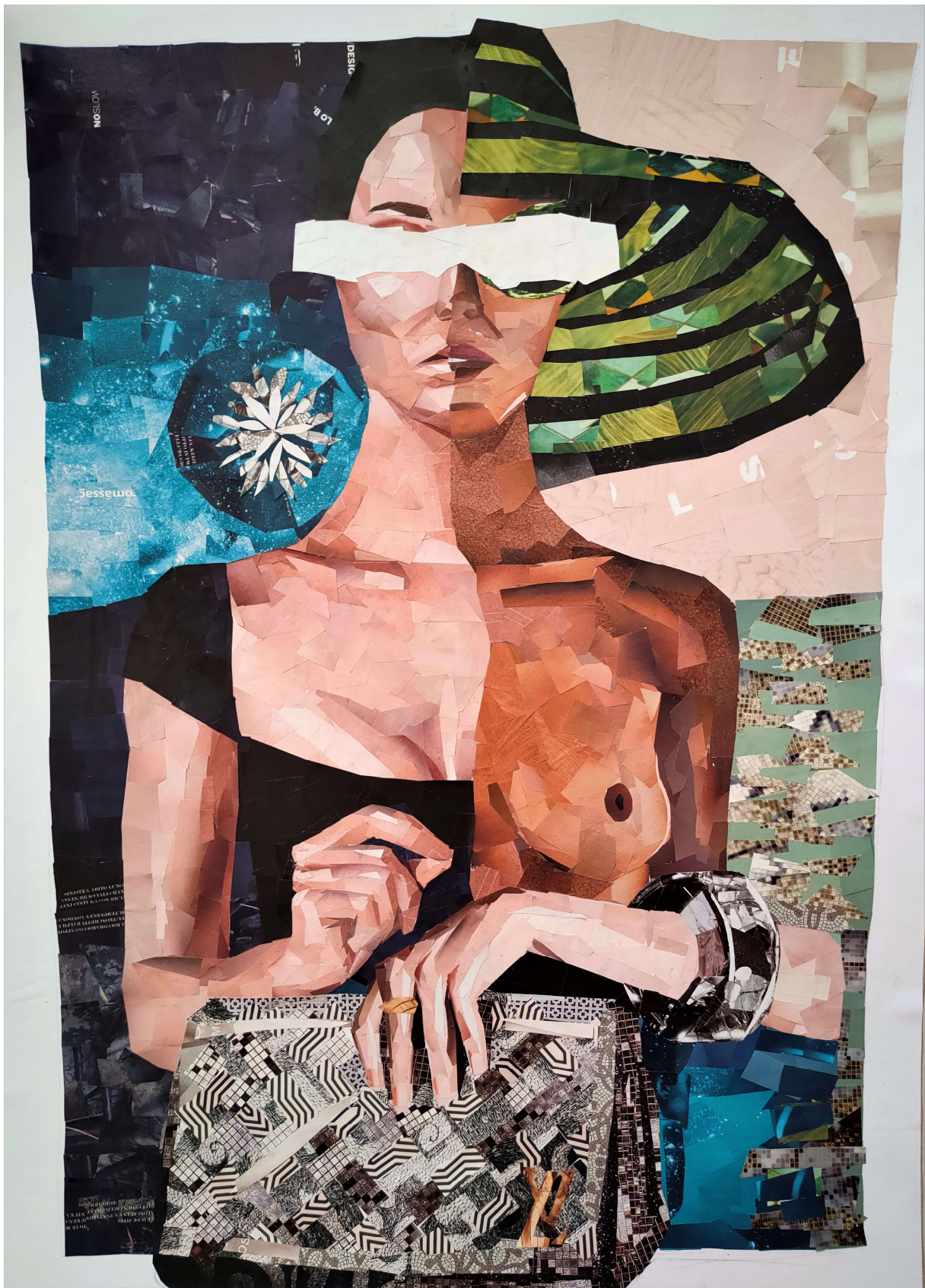
Stil , kolaž na papiru, 70 x 50 cm