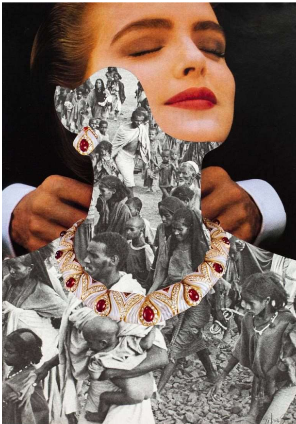
Silvio Severino; It Feels Good Be So Rich, kolaž na papiru, 20 x 30 cm