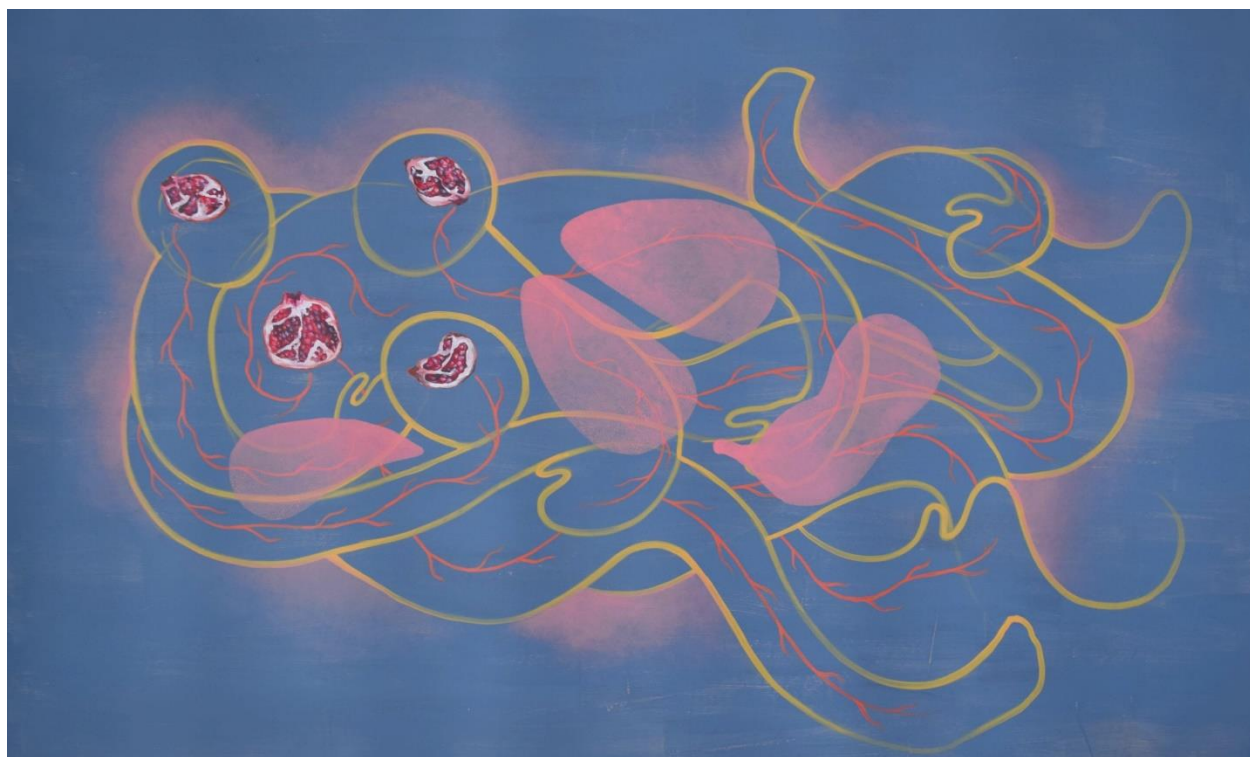
Pazim, 2022., akril na papiru, 117 cm x 181 cm