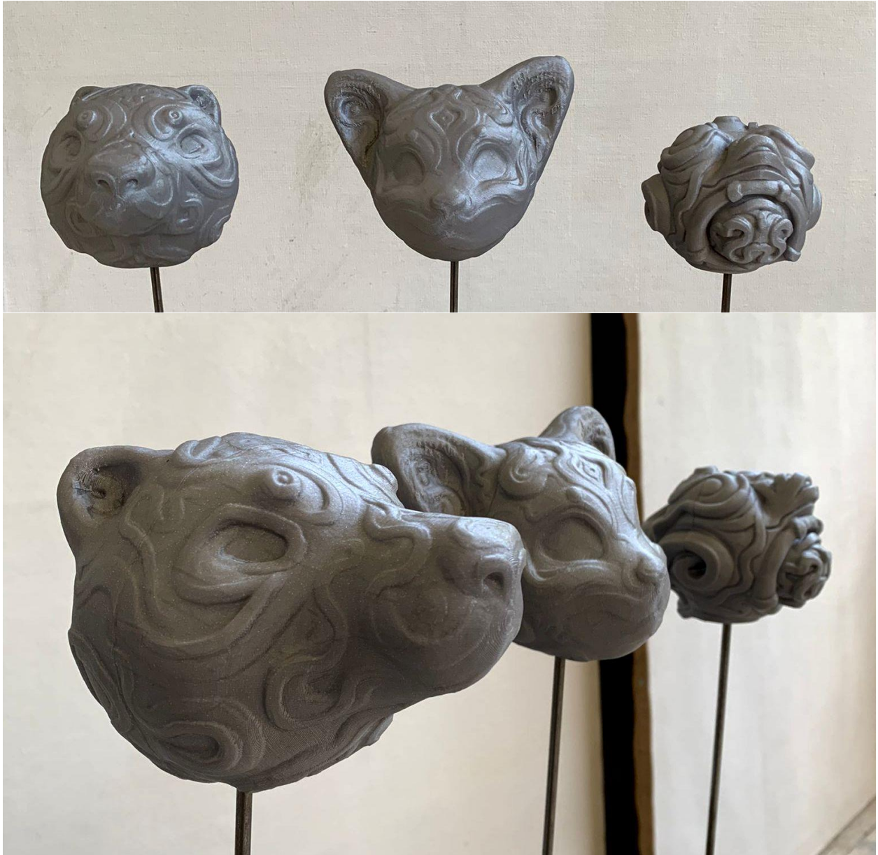
Bodići, 2022., 3D print