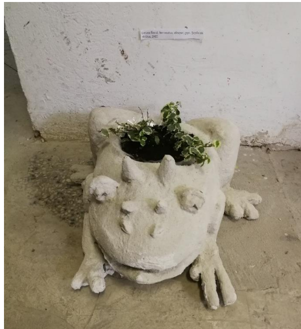
Lorena Šimić, bez naziva, stiropor, gips, ljepilo za pločice, zemlja za cvijeće, akrilna impregnacija, 2022.