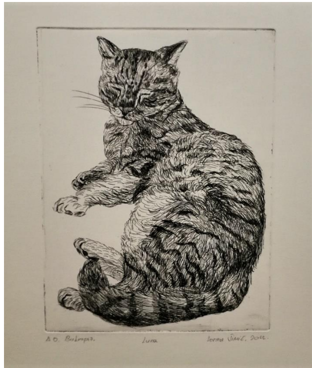
Lorena Šimić, Luna, bakropis, 2022.