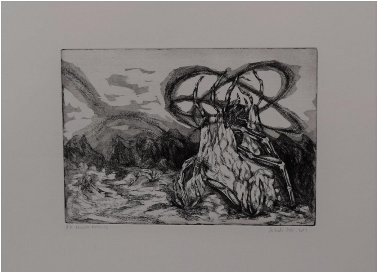
Bez naslova, 2022., bakropis, akvatinta

Na kraju radim usporedbu prvotne skice i zadnjeg otiska gdje jasno mogu uočiti koliko se kroz proces rada promijenila ideja i kako se rad kroz namjerne intervencije, ali isto tako i slučajne, individualizira i poprima svoj identitet.