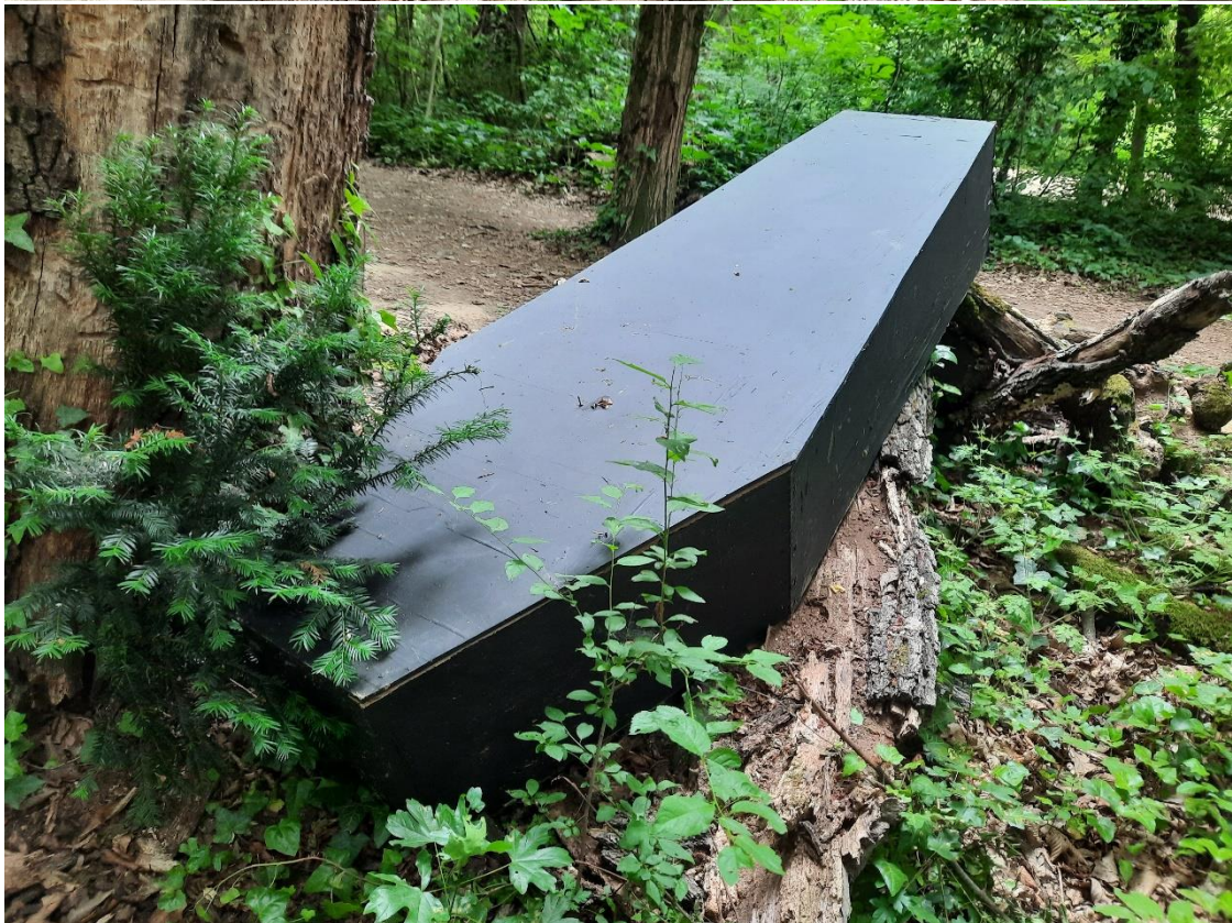
Intervencija na Okvir po mjeri čovjeka , 2022.