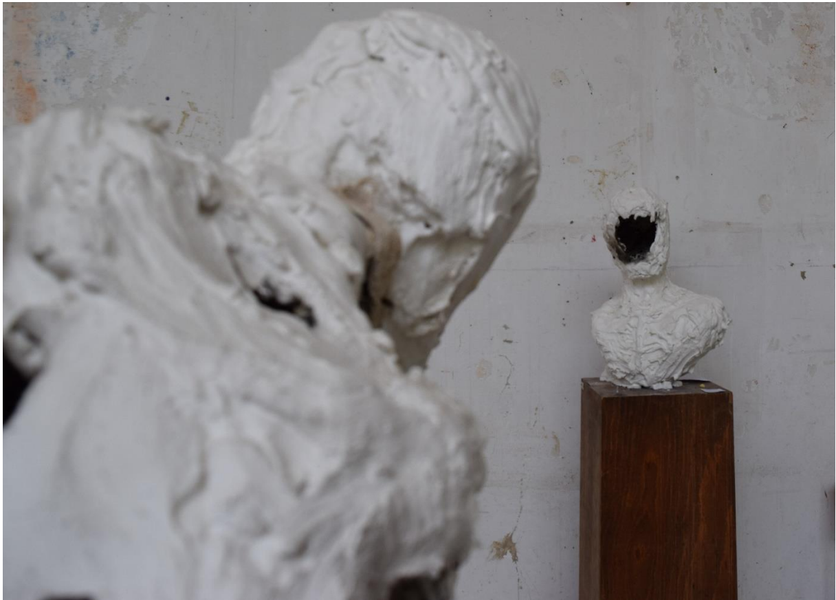
Označeni i Neoznačeni, 2022.