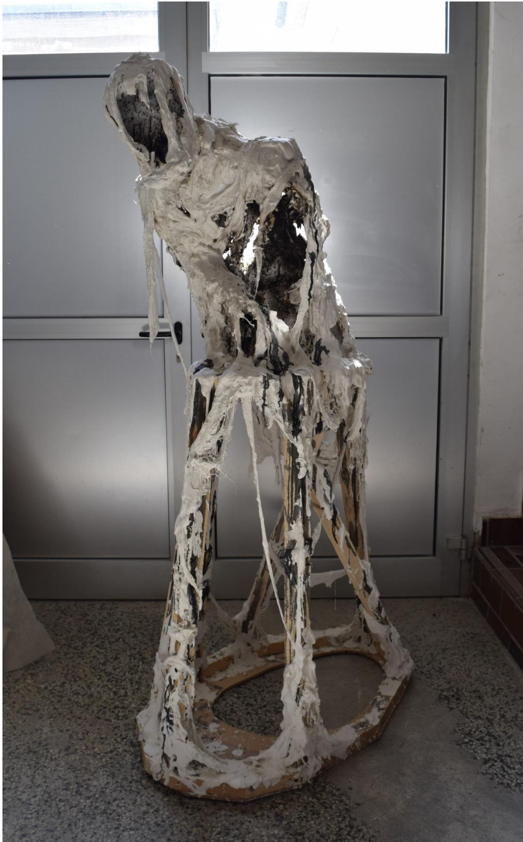
Označeni , 2022., stiropor, gips, drvo, crni tuš