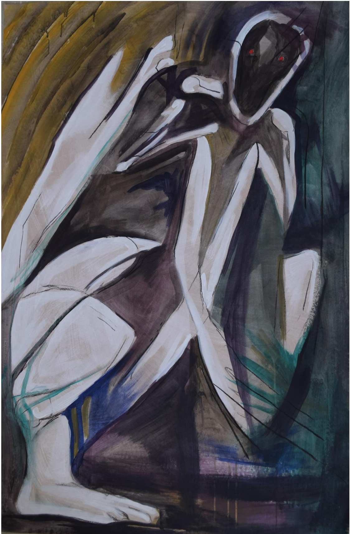
Nadzornik bogomoljka gleda vas svojim sitnim očima, 2022., akril na papiru