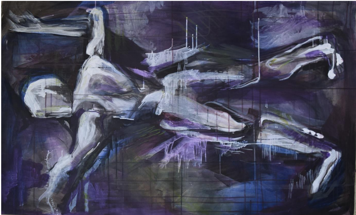
Drljača , 2022., akril na papiru

Ova tri rada proces su mog istraživanja granica i slobode, kao svojevrsni sukob logike i intuicije. Kafka dovodi u pitanje sisteme i njihova pravila, ponajviše njihov vijek i trajanje te tako prikazuje kako se njihova srž mijenja kroz vrijeme. Postepenim dinamiziranjem elemenata i njihovim spajanjem s pozadinom eksperimentiram s odnosima strukturirane skice, jasnoćom prikaza i intuitivnim slijedom misli koje vode razvitak samoga rada. Kroz sva tri rada željela sam vizualno prikazati gradaciju raspadanja postojeće strukture i procesa nastajanja nove. Da bi nastalo novo jasno strukturirano tijelo prvo treba nastati ideja koja je utjelovljenje suprotnosti.