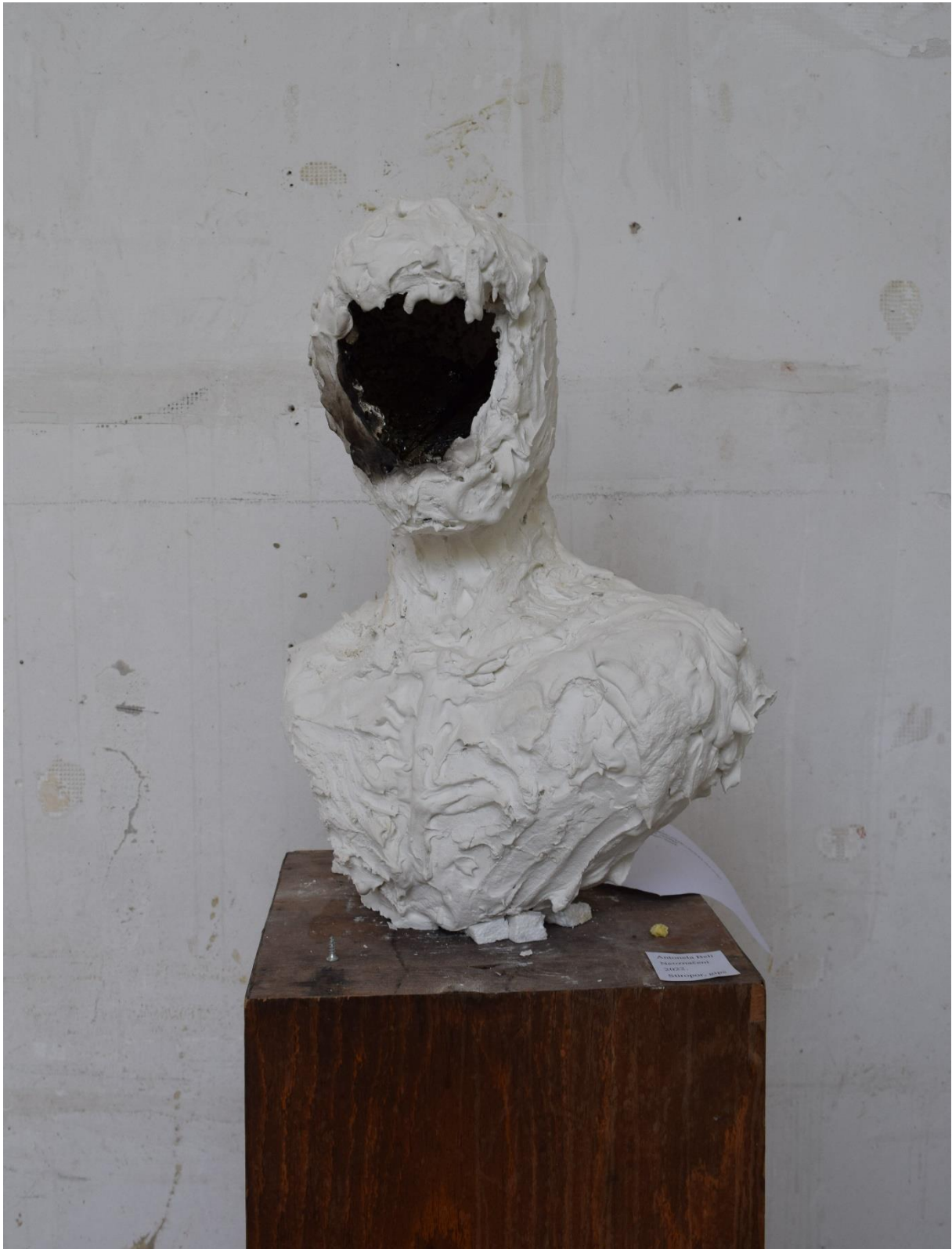
Neoznačeni, 2022., stiropor, gips