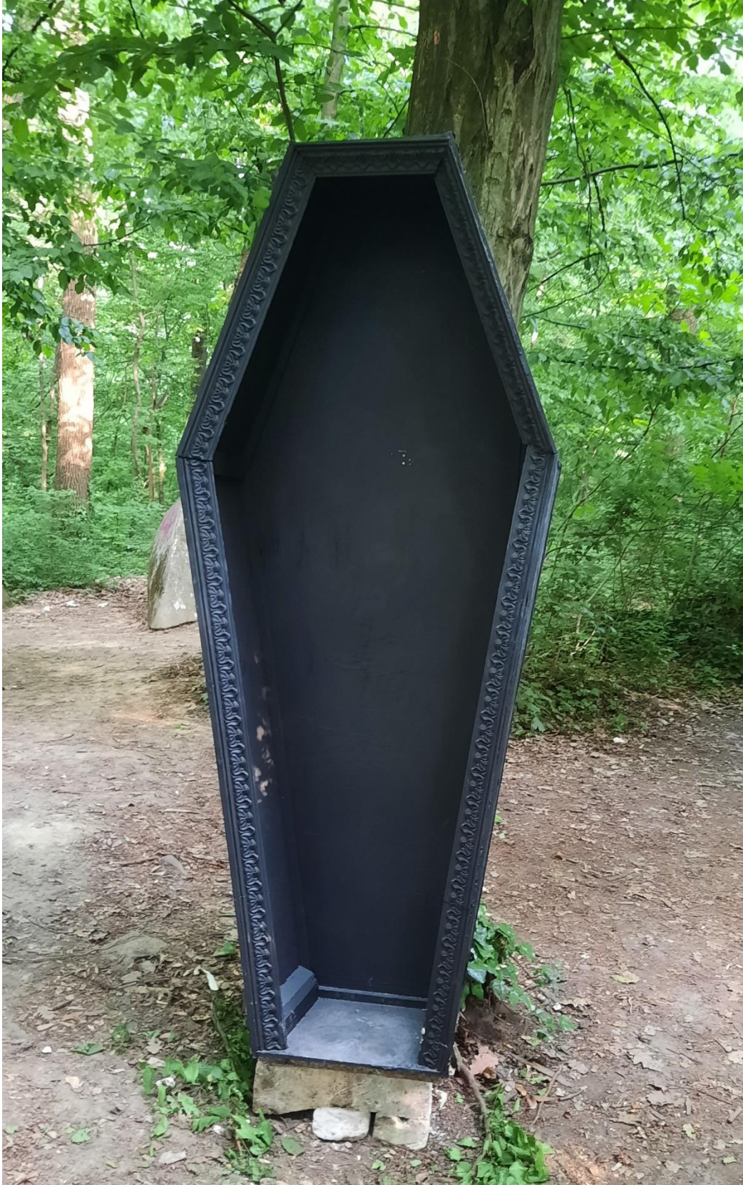
Okvir po mjeri čovjeka, 2022., drvo, stiropor, crna boja za beton