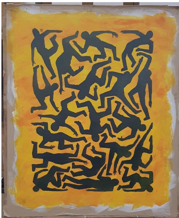
Zeleni ples , 2021, akril na papiru, 80x40cm

Rad je nastao iz želje da popunim pozadinu ekspresivnim potezima kista i stavim figure koje kontriraju preciznim obrisnim linijama. To je sukob između dva pristupa sa još jednom dubljom komponentom; kaosa kompozicije unutar prividne „kutije“ u kojoj se svi nalaze.