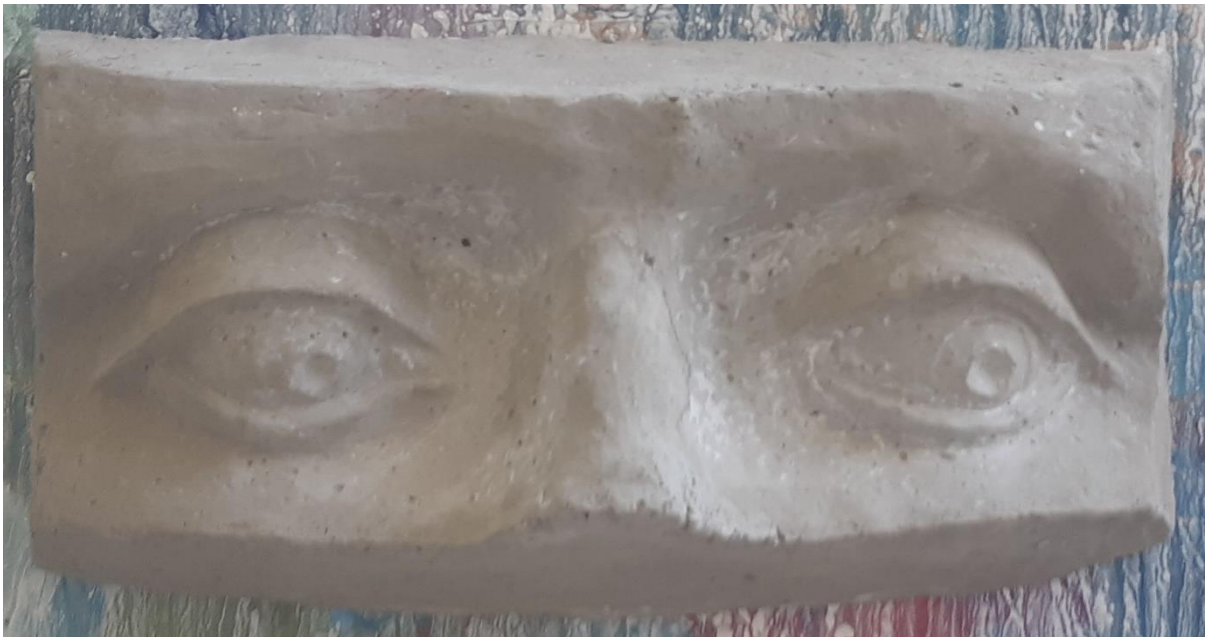
Reljef, 2021., armirani beton, 45x20x11 cm

Ideja je montirati reljef u blizini zelenog otoka na pročelje zgrade visoko van dohvata ruku. Tako bi skulptura s visine gledala na zeleni otok i možda učinila razliku.