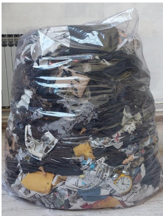
Život, 2023., kombinirana tehnika, 150x70cm