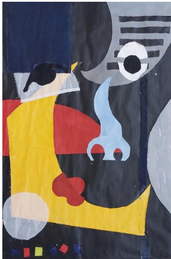
Život, 2023., kolaž, 147 x 97cm