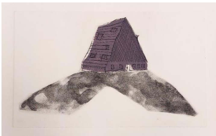
Dom, 2023., bakropis i akvatinta