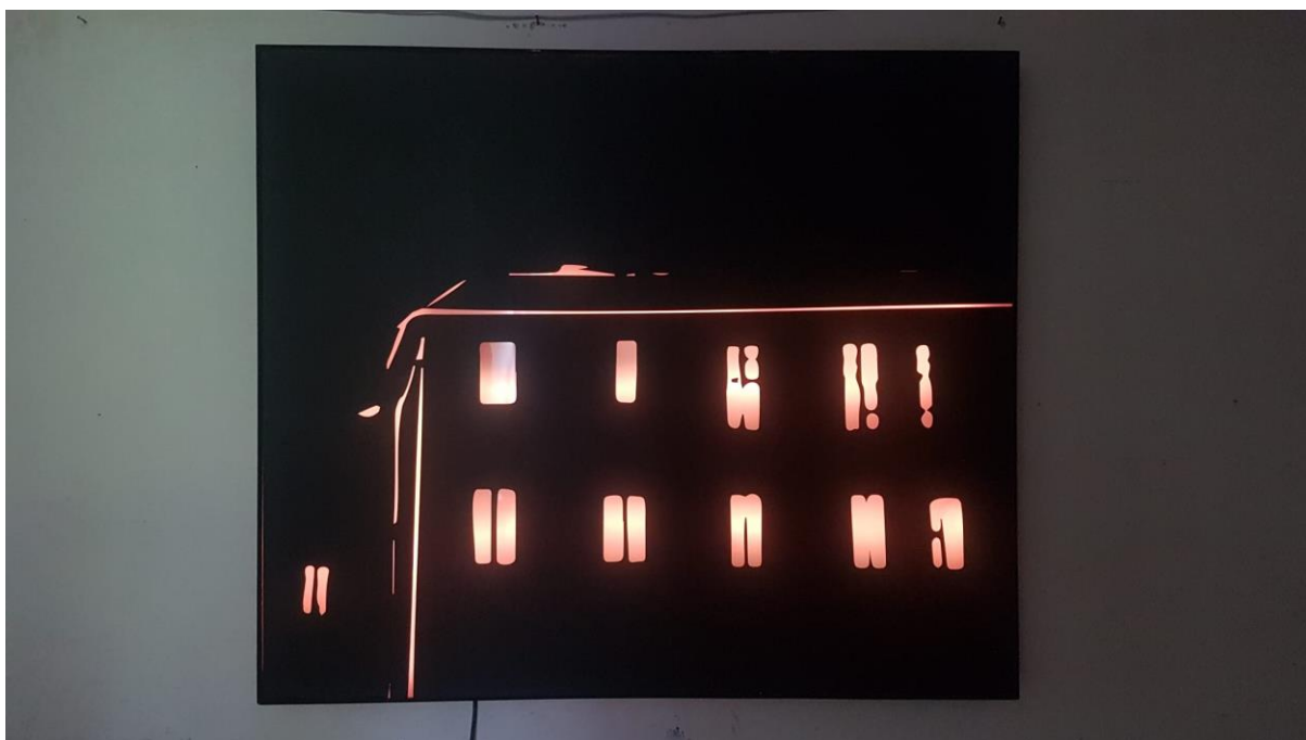
Light in the Night, 2023., svjetlosna instalacija