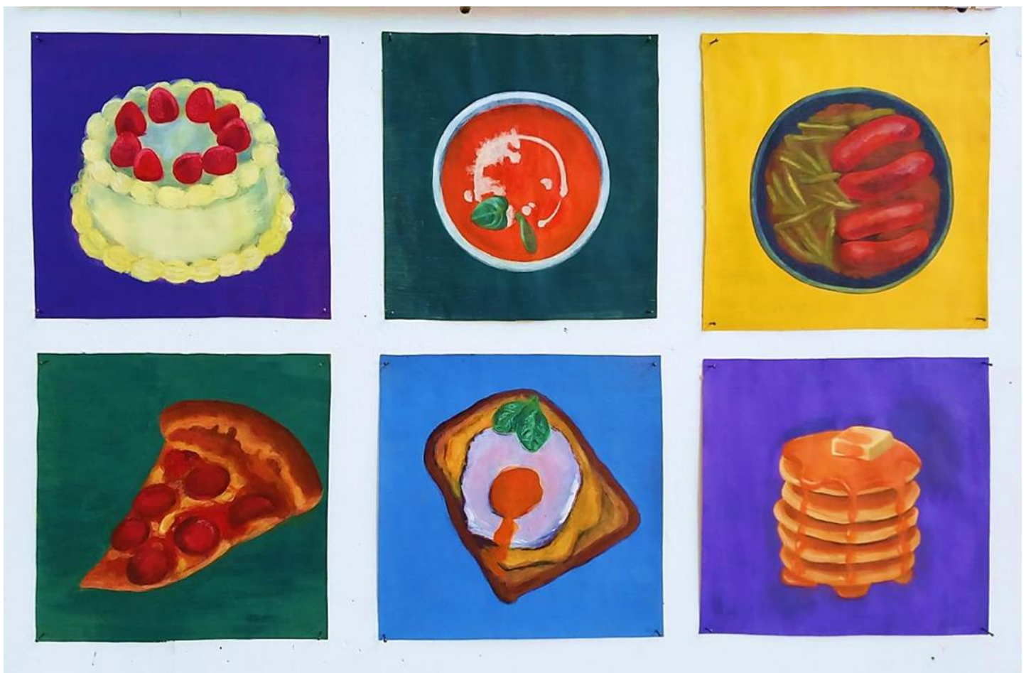
Aesthetic Over Substance , 2023., akril na papiru, 33 x 33 cm