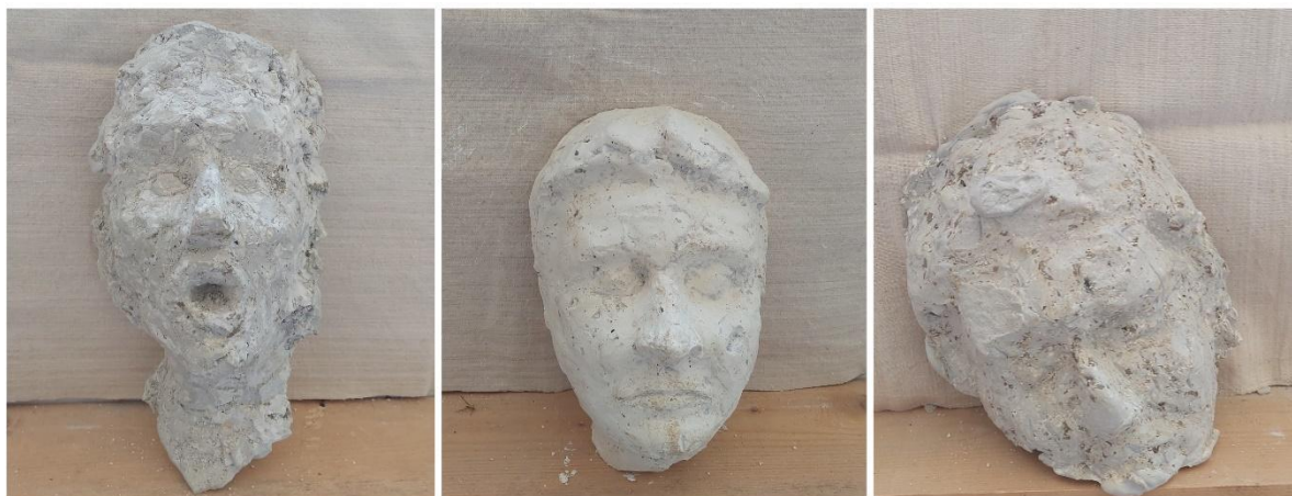
Maske, 2023., gips

sličnosti i razlike gotovih djela s obzirom na različite tehnike i materijale u kojima smo radile portrete, ali i naš umjetnički razvoj prilikom stvaranja novih djela. Iako smo imala iskustva u međusobnom portretiranju, ovo je bio prvi pokušaj portretiranja u kiparskim tehnikama, odnosno glini i gipsu. Prijašnje iskustvo stvaranja lika moje prijateljice pomoglo mi je u rađanju njene maske jer sam već likovno upoznala njen lik (proporcije, ekspresije i slično) što me dodatno pripremiло da izvedem ovaj zadatak što bolje mogu.