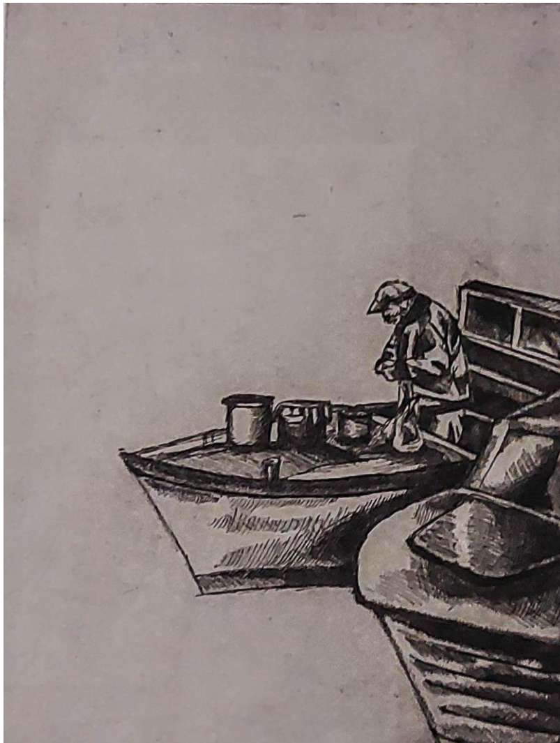
Ribar , 2023., bakropis, akvatinta

Grafički postupak zanimljiv je zbog toga što u procesu rada često nastanu potezi, mrlje koje ne planiramo nego se dogode prilikom stvaranja rada. Tako je i djelo Ribar zbog slučajnih nepravilnosti na otisku rezultiralo stvaranjem dojma stare fotografije koja u usporedbi s fotografijom po kojoj je grafika rađena djelu daje novi kontekst te stvara dojam gotovo iste fotografije u razmaku od nekoliko godina.