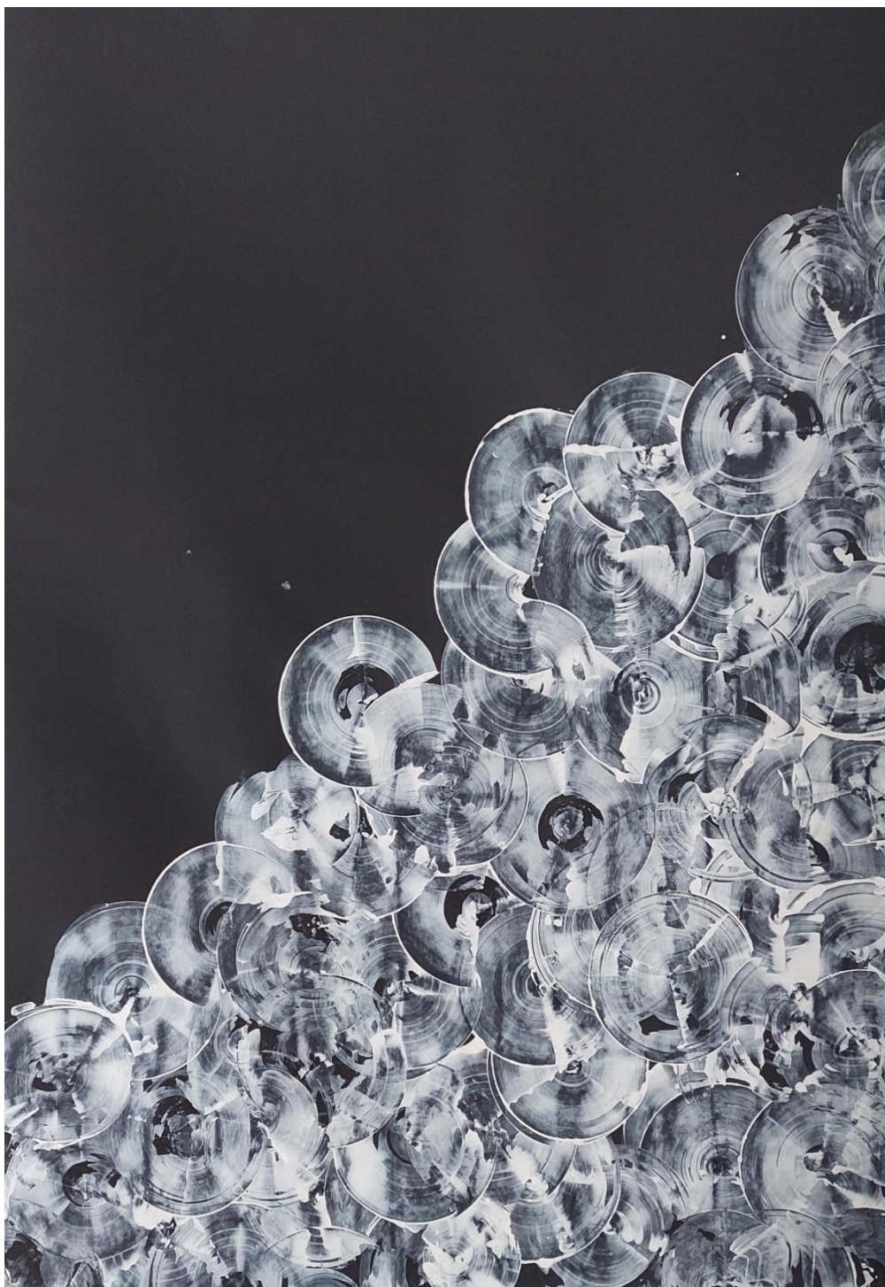
Apstrakcija, 2023., glet masa na crnom papiru