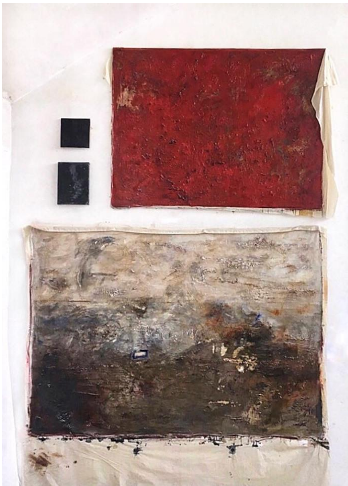
Bez naziva, 2019., gips i ulje na platnu