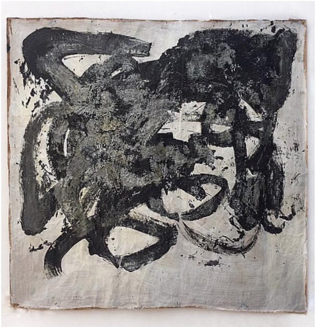
Crna linija , 2019., akril, gips i lak na papiru