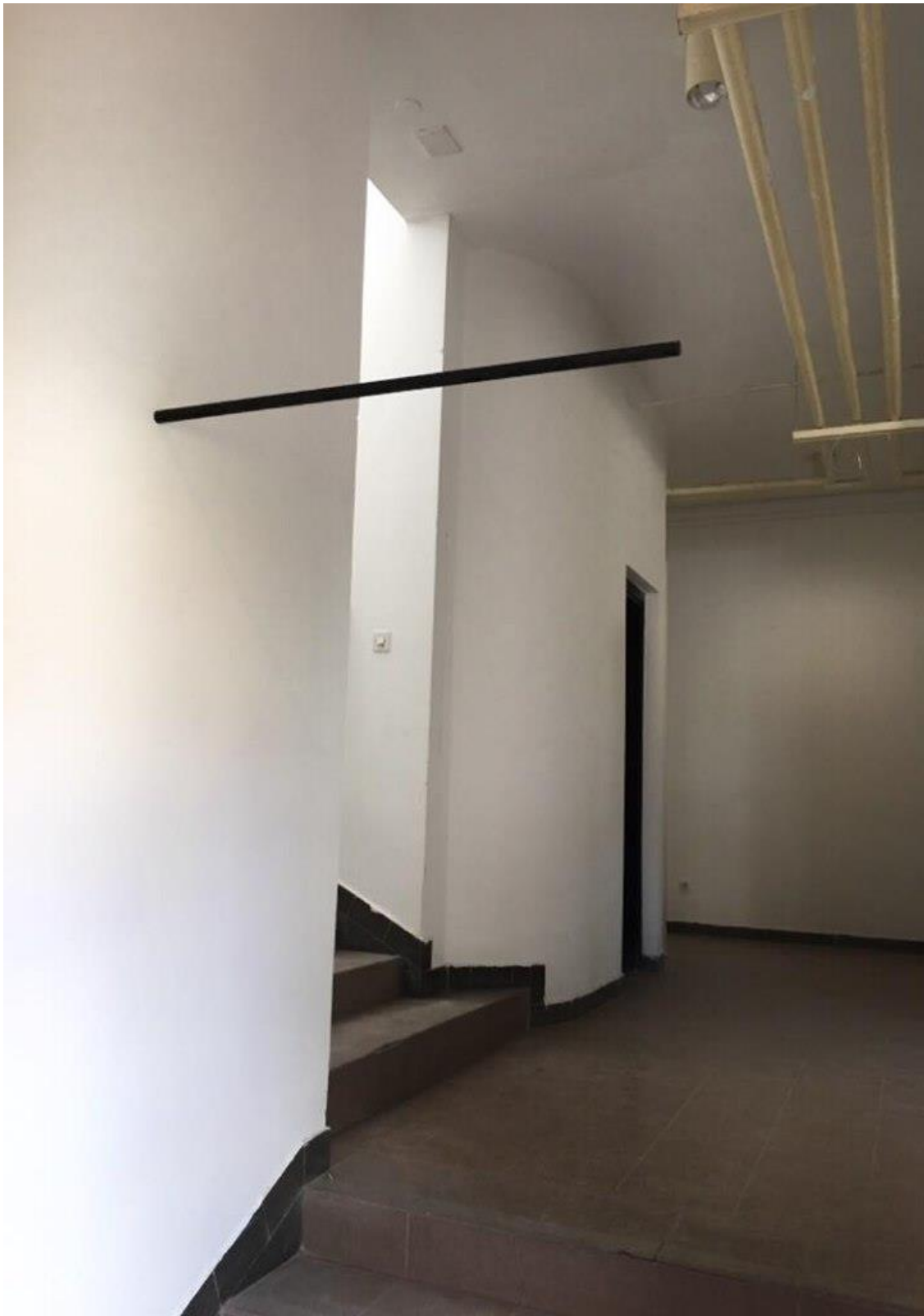
Os , 2019., obojana plastična cijev