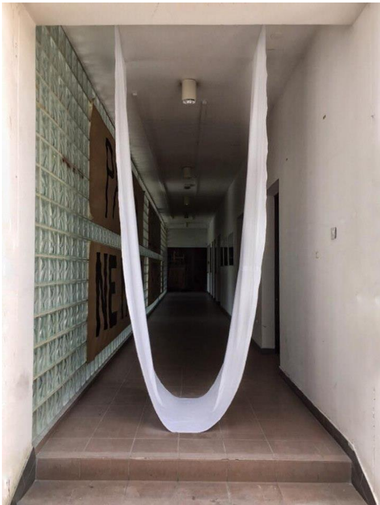
Bijela draperija, 2019., tkanina