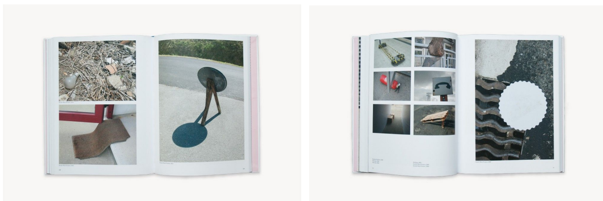
Iz knjige fotografija Richard Wentworth - Making Do and Getting By

Fotografiranjem fragmenata suvremenog krajolika na neki način radi analizu ljudske snalažljivosti i improvizacije, pri čemu zabavne neobičnosti, koje bi u suprotnom ostale nezapažene, postaju predmet promišljanja namjene. Micanjem njihove originalne funkcije proširuje se promatračevo razumijevanje tih predmeta, razbijanjem konvencionalnog klasifikacijskog sustava.