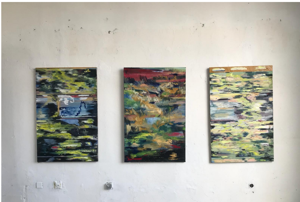
Katoptris, triptih 80 x 136 cm