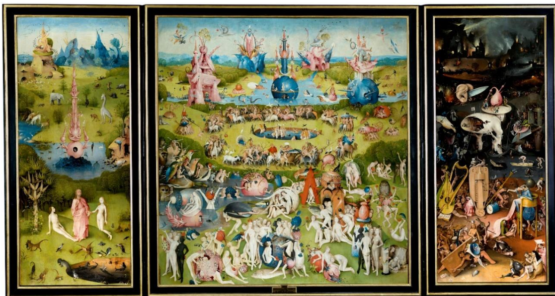
Slika 1: Hyeronimus Bosch, Vrt zemaljskih naslada , oko 1500. godine, ulje na dasci, 205.5 cm × 384.9 cm, Museo del Prado, Madrid

Diplomski rad je izveden u dubokotisnoj tehnici bakropisa 4 i suhe igle 5 te se sastoji od tri velike kompozicije. Rad je nadahnut triptihom 6 Hyeronimusa Boscha, 7 Vrtom zemaljskih naslada , datiranog oko 1500. godine (slika 1).