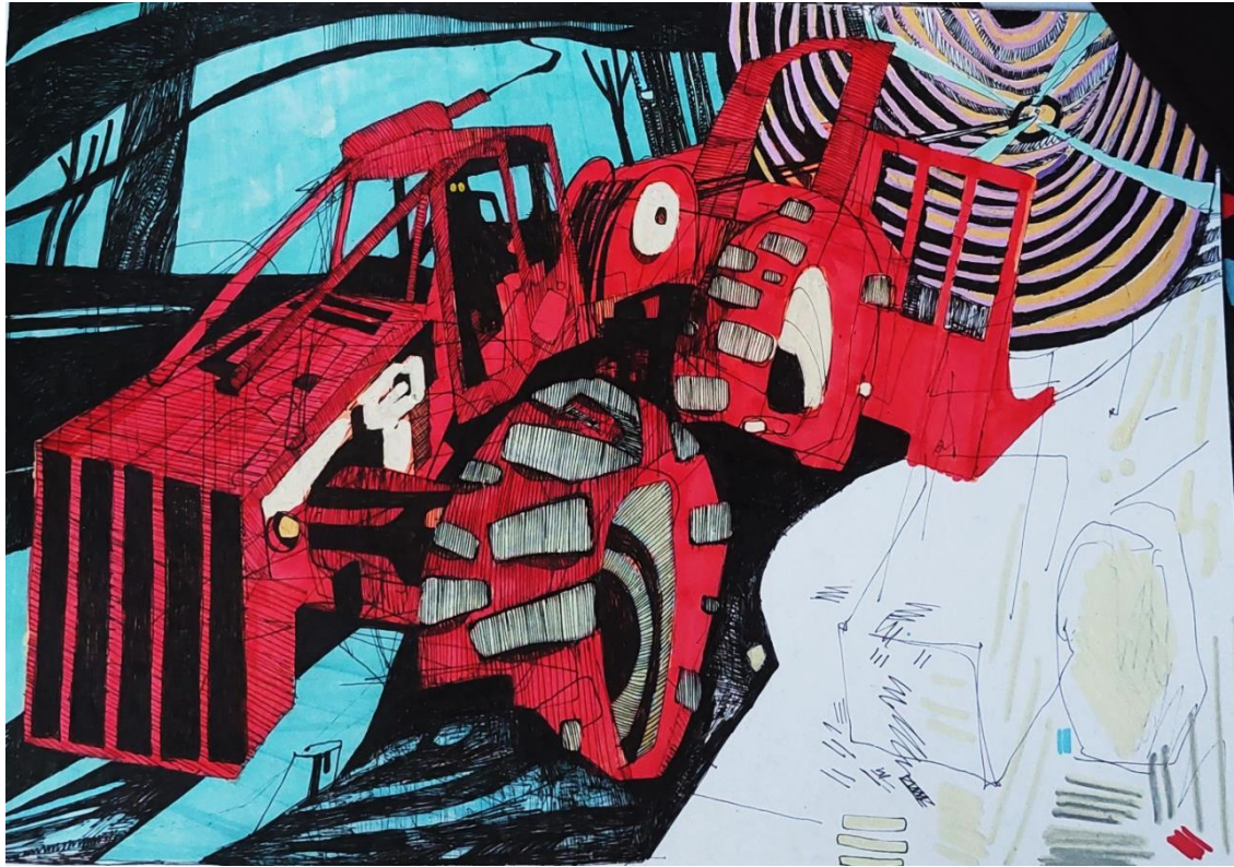
Slika 9: Skider; skica za prvu ploču