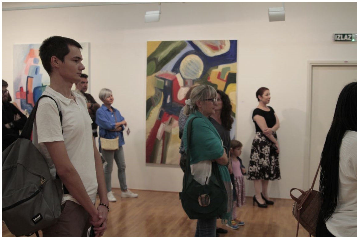
Slika 14. Fotografije s otvorenja izložbe u galeriji Vladimir Filakovac