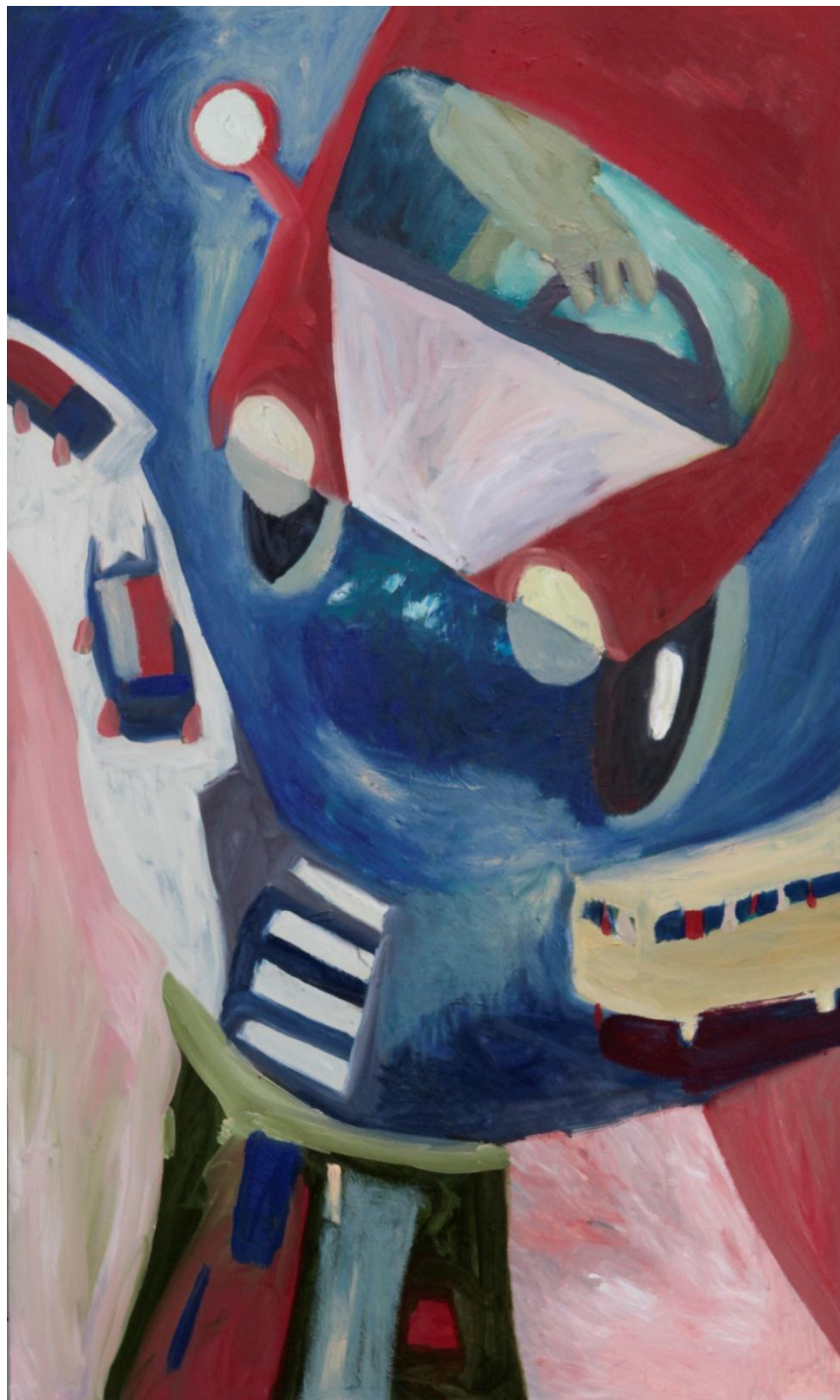
Slika 2. Autek, 200x120cm, ulje na platnu, 2023.