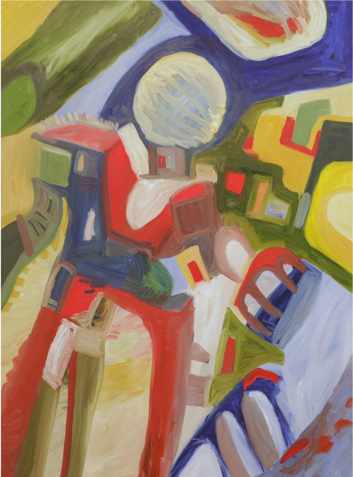
Slika 3. Gužva, ulje na platnu, 190x140cm, 2023.