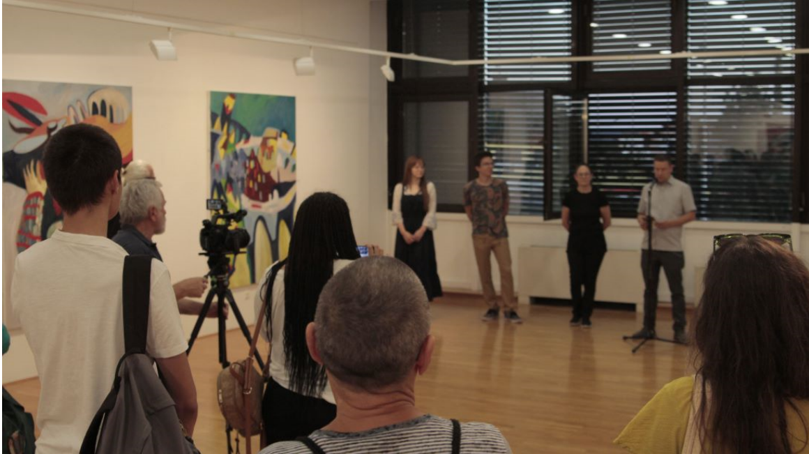
Slika 13. Fotografije s otvorenja izložbe u galeriji Vladimir Filakovac