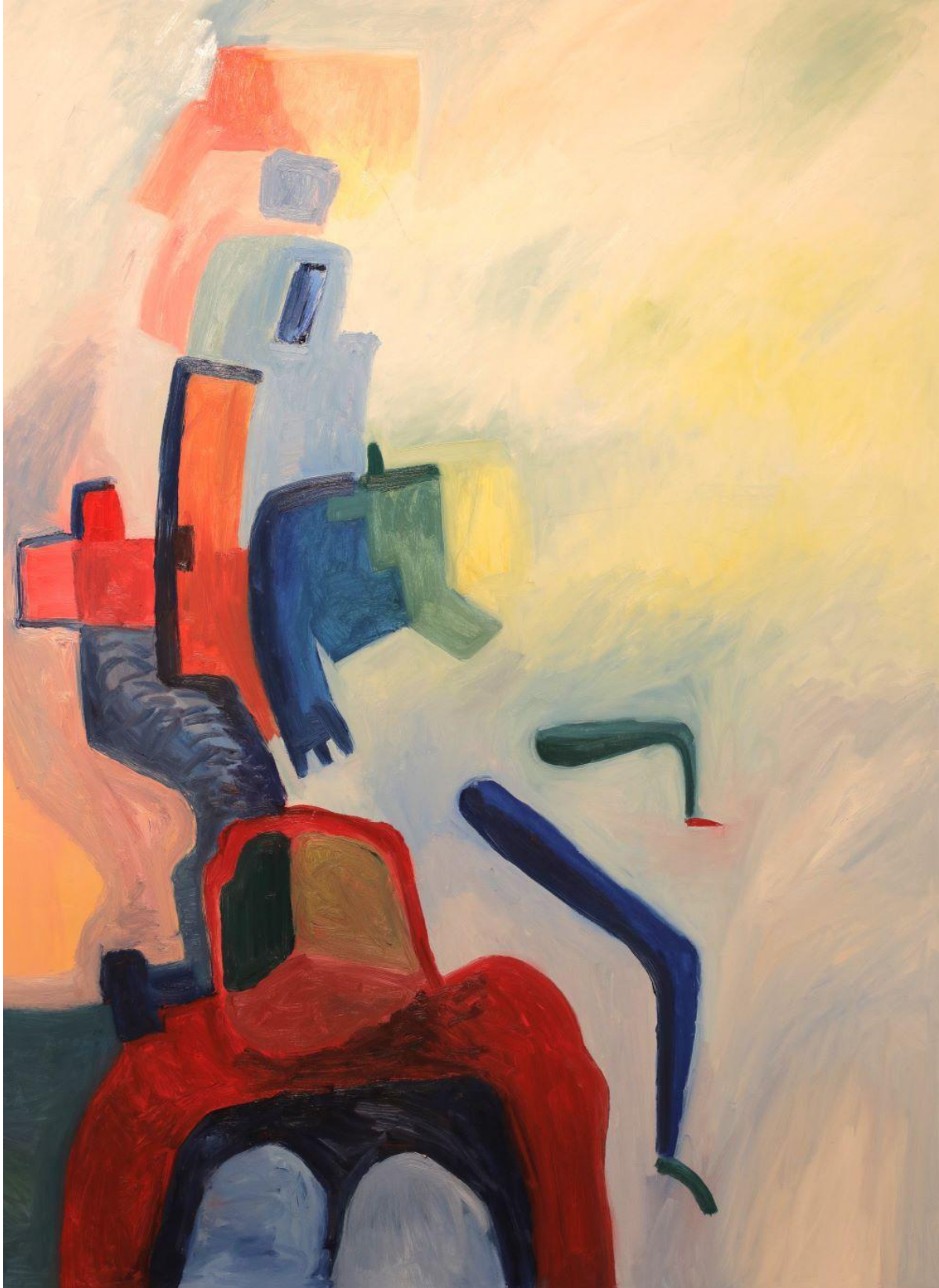
Slika 7. Meduprostor , ulje na platnu, 190x140cm, 2023.