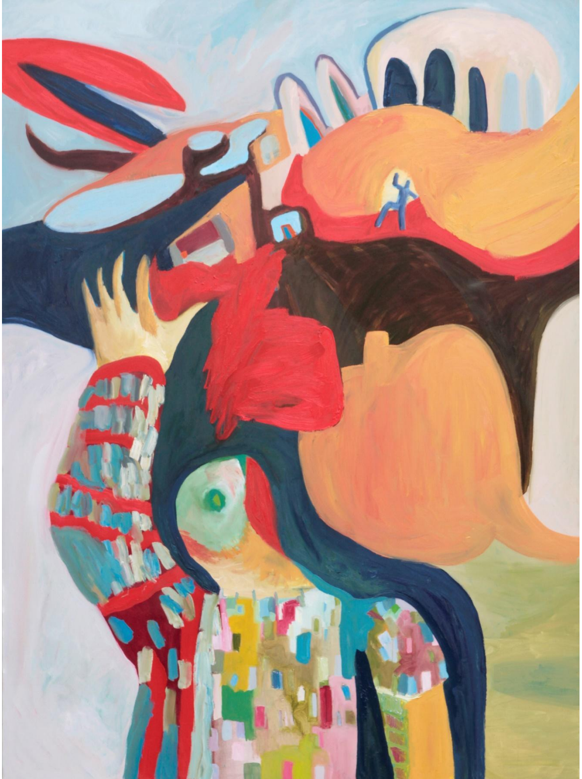
Slika 1. Pozdrav , 190x140 cm, ulje na platnu, 2023.