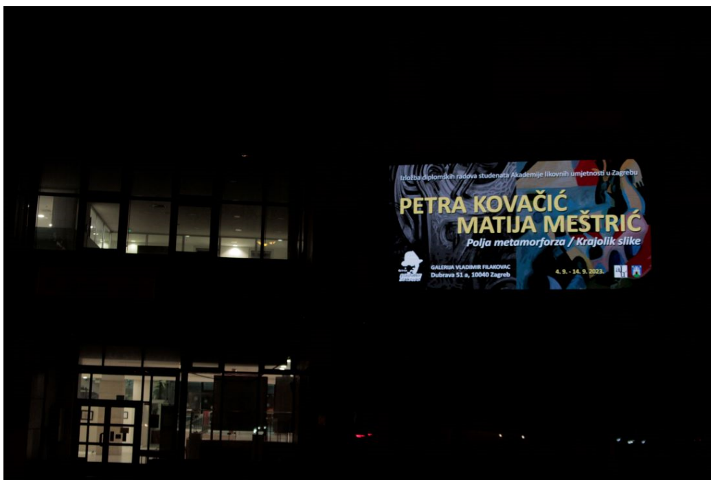
Slika 16. Fotografije s otvorenja izložbe u galeriji Vladimir Filakovac