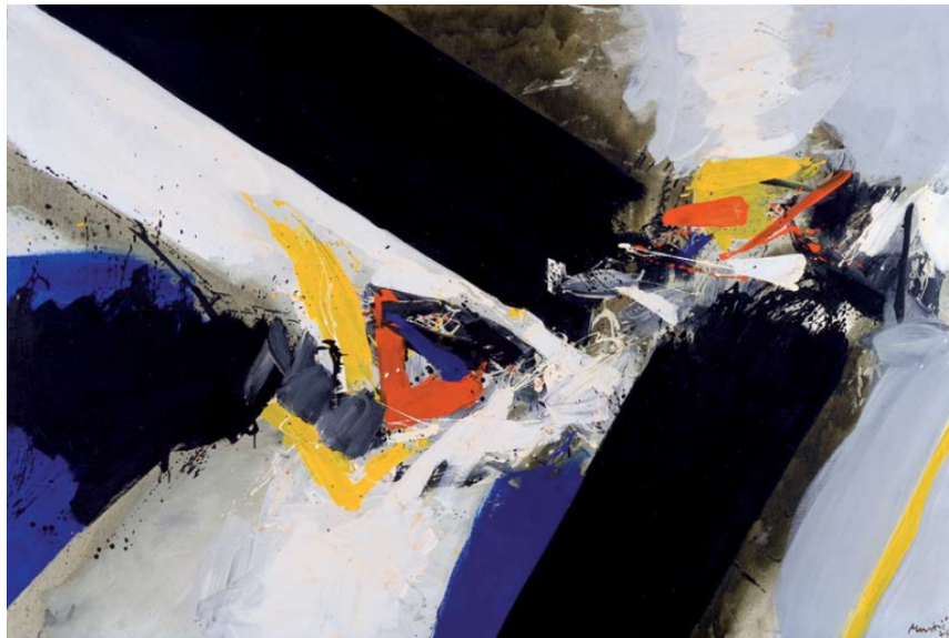
Slika 9. Edo Murtić, Susret , ulje na platnu, 1978.

Sublimacijski proces imao je dvije značajne polazne točke. Prvi je proizašao iz same prirode, gdje je motiv doživio transformaciju u jedva prepoznatljive znakove, da bi se na kraju stapao u apstraktne prikaze. Drugo polazište proizlazilo je iz unutarnjih vizija, gdje su umjetnički oblici proizašli iz vlastite duhovnosti i nalazili asocijacije na vidljivu stvarnost. Ove dvije različite polazišne točke, jedna vanjska i druga introspektivna, djelovale su kao snažni generatori originalnih umjetničkih ideja i apstraktnih oblika. Osim Ljube Babića, pejzažist koji hrabrije zadire u apstrahiranje tematike krajolika i koji pretvara temu isprepletenu motivima i detaljima na debele poteze kistom, liniju, boju odnosno formu i oblik je Edo Murtić. Njegova uporaba boje u Susretu [sl. 9.] posebno je značajna iz više razloga. Pomoću crnih i bijelih ploha te neutralne sive dodatno ističe hrabar i dramatičan kolorit, kontrast između dubokih, bogatih plavih i živih crvenkasto narančastih tonova. Sukob ovih komplementarnih boja stvara dinamičnu napetost unutar kompozicije. Intenzitet boja privlači pozornost gledatelja i prenosi osjećaj emocionalnog intenziteta. Čini se da crvene boje pulsiraju naspram hladnih plavih, na bijelo crnoj plohi izazivajući osjećaj sukoba kroz ostvarivanje ritma na slici.