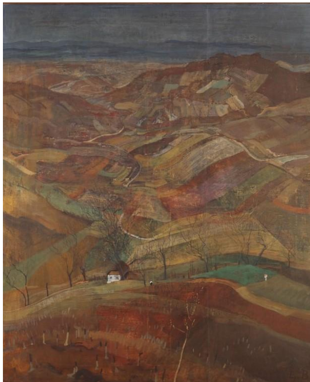
Slika 8. Ljubo Babić, Moj rodni kraj , ulje na platnu, 180x150cm, 1936.

Tijekom procesa vlastitog umjetničkog razvoja moram istaknuti utjecaj hrvatskog pejzažnog slikarstva. Tema je to koja je okupirala umove i kistove mnogih hrvatskih umjetnika 20.st., vodeći ih raznim stazama, od mikrokozmosa detalja do makrokozmosa apstrakcije. Krajolik, sa svojim bezbrojnim perspektivama i dimenzijama, služio je i kao platno i kao katalizator, skrećući putanje pojedinačnih umjetničkih vizija prema apstrakciji - evoluciji koja je istodobno označila vezu s globalnom strujom međunarodnih umjetničkih stilova. Kao što primjećuje Igor Zidić, pejzažisti su bili ti koji su rano utrli puteve prema apstraktnom izrazu. Njihova istraživanja krajolika, a posebno revolucionarno djelo Ljube Babića, podigla su promatračku točku na nove visine. Babićevo korištenje novih apstraktnih perspektiva, kakvo se vidi u njegovom remek-djelu Moj rodni kraj (1936.) [sl. 8.] i kasnijim varijacijama, ponudilo je novu paradigmu umjetničkog izražavanja. 3