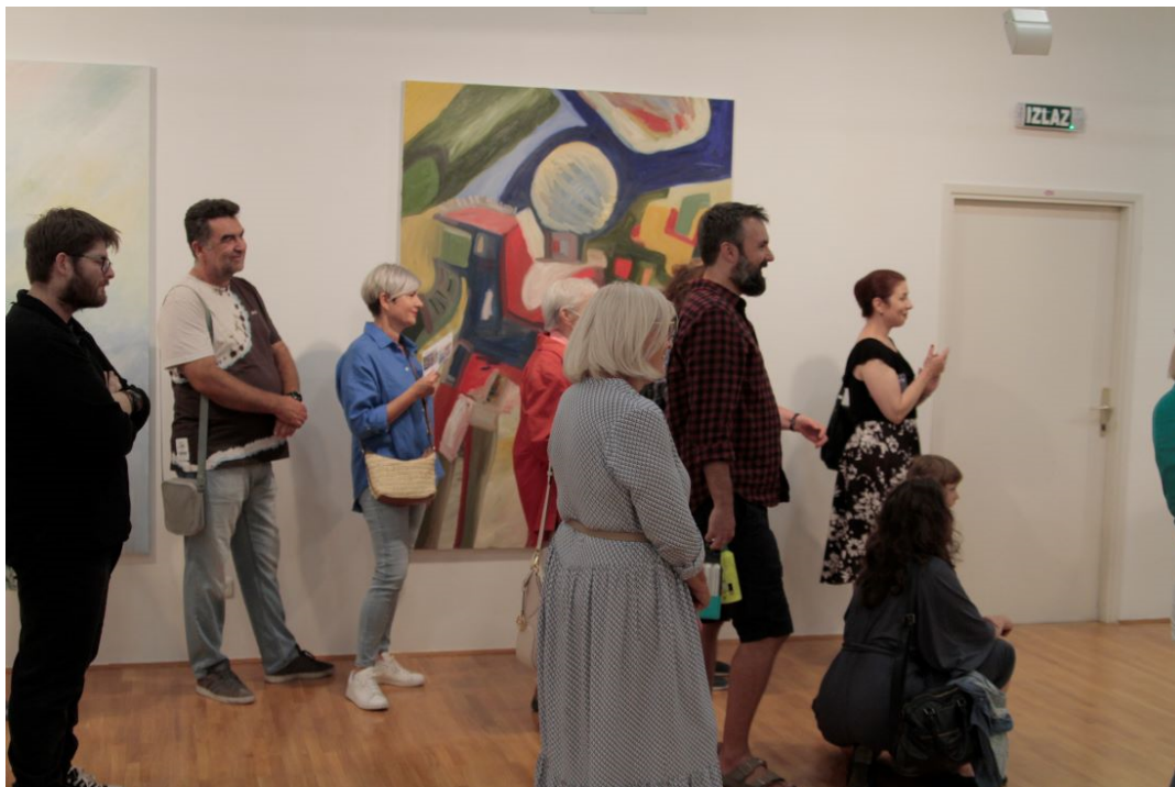
Slika 15. Fotografije s otvorenja izložbe u galeriji Vladimir Filakovac