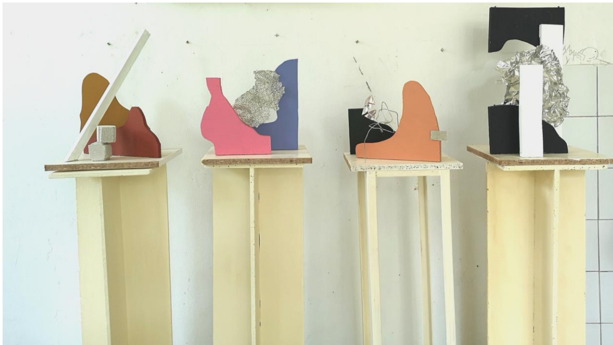
Izadi iz okvira, 2019., Kombinirana tehnika