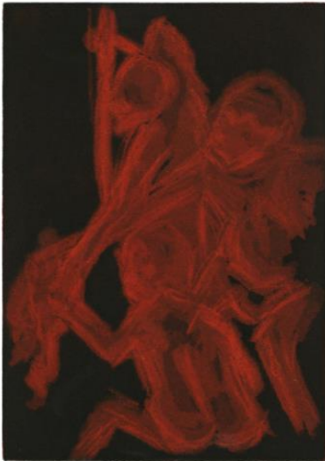
Plj skulpture u boji Helena Bonin, 2023.