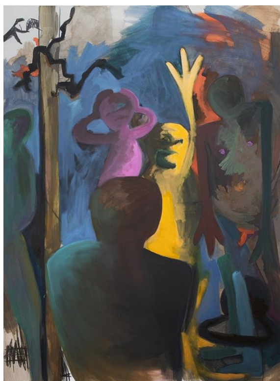
Dobro da smo zajedno, 2023. Akril i ulje na platnu; 166 x 130 cm