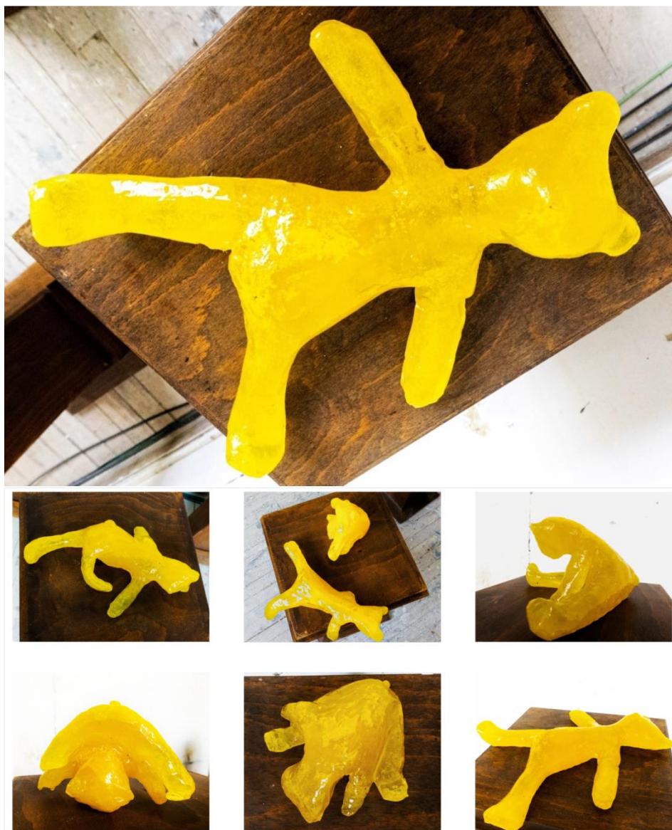
Žuti medo, 2023. Ciklus od šest skulptura epoxy smola

shvaćanja njegovog postojanja. Skulpture su potom lijevane u epoxy smoli koja je blago pigmentirana žutom bojom kako bi medvjedići poprimili određenu transparentnost i sjaj. Kao takvi mogu promatrača podsjećati na Haribo gumene medvjediće i time dodatno prizivati osjećaj davno prošlog djetinjstva. Veliki suvremeni umjetnik Jeff Koons, jedan je od najznačajnijih utjecaja u ovakvom načinu promišljanja o skulpturi. Njegovi radovi uvelike su inspirirani dječjim igračkama koje uzima kao motiv te ih potom napuhuje do golemih razmjera. Vjerujem da se ljudi tokom cijelog svog života, ma koliko stari ili ljudi bili, uvijek mogu, na jedan veoma poseban način, povezati s objektima koji ih imalo podsjećaju na vlastito maleno ja. To mora biti nekakva nit koja nas sve povezuje.