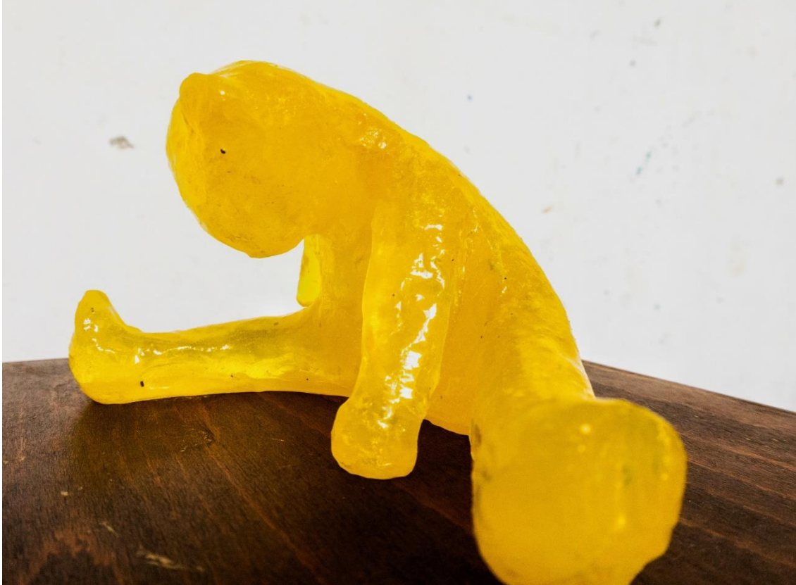
Žuti medo , 2023. Ciklus od šest skulptura. Epoxy smola. Detalj.