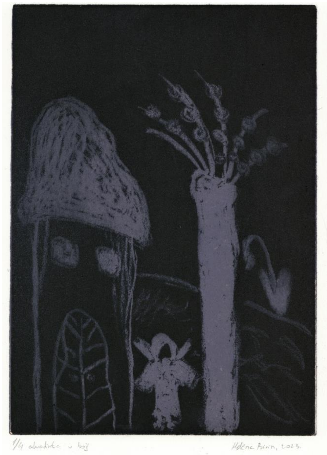
Ciklus radova Duhovi , 2023. Akvatinta u boji. Detalj.