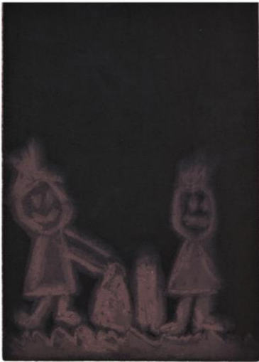
Plj skulpture u boji Helena Bonin, 2023.