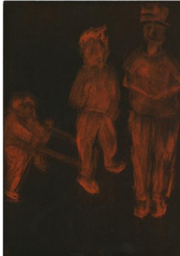
Plj skulpture u boji Helena Bonin, 2023.