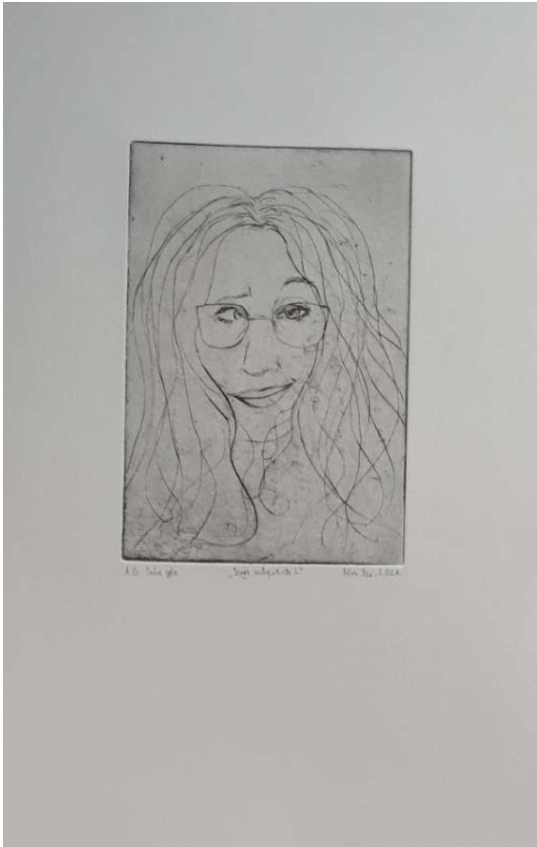
Serijski autoportreti L, 2024.