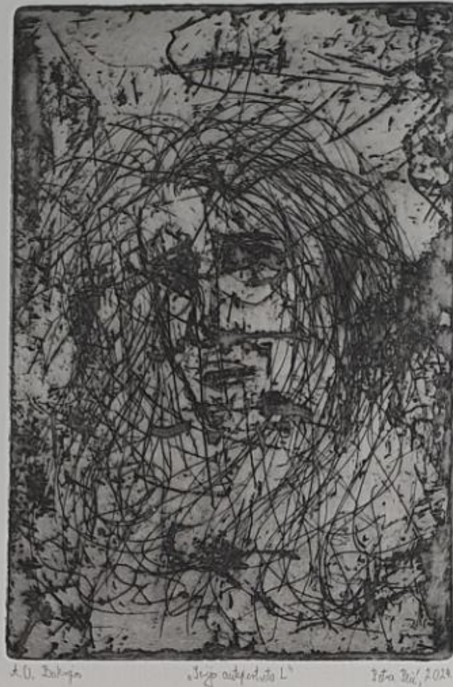
Serija autoportreta L, 2024.