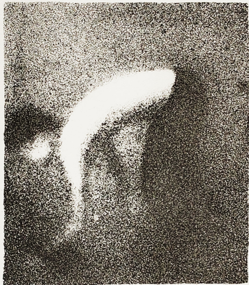
Litografija 2/5 „Bez naziva“ Lara Trupinović, 2024.