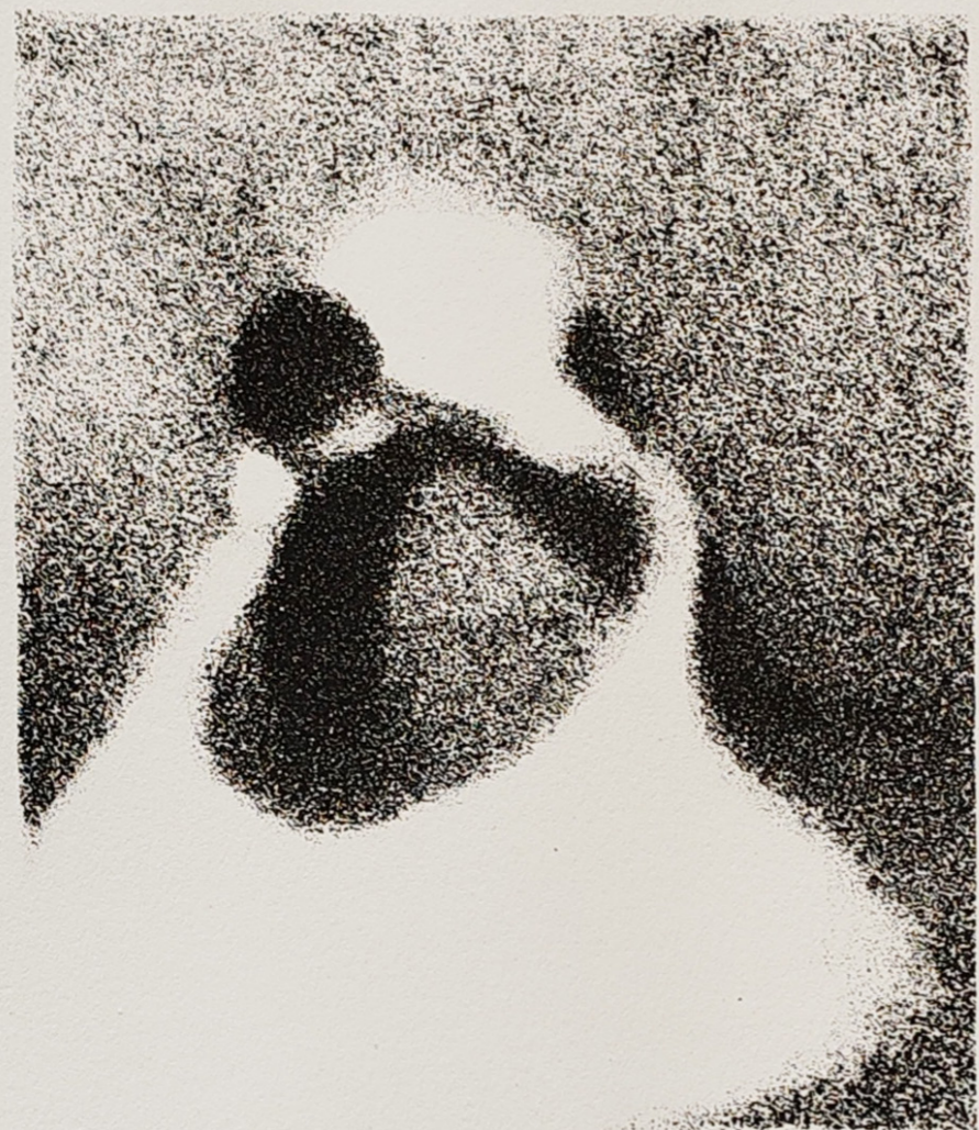
litografija 1/5 „Bez naziva“ Laru Jureković 2024.