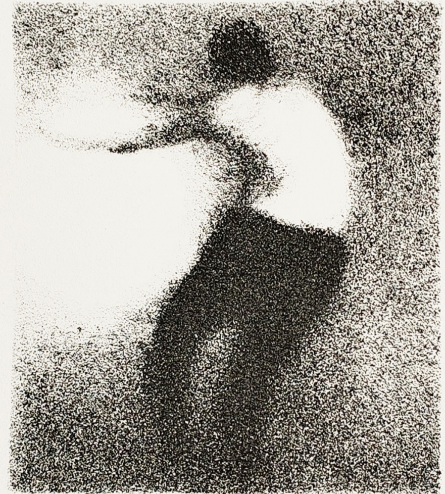
litografija 1/7 „Bez naziva“ Lara Trupinović, 2024.