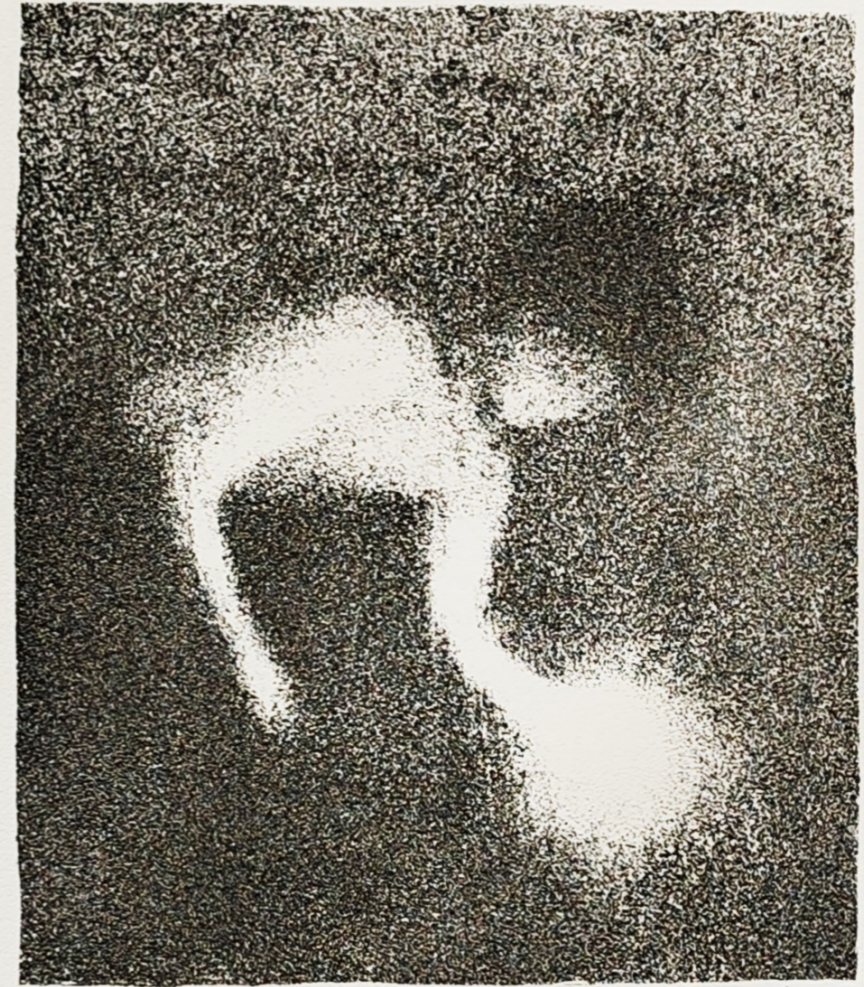
litografija 2/5 „Bez naziva“ Lada Jurešević 2024.