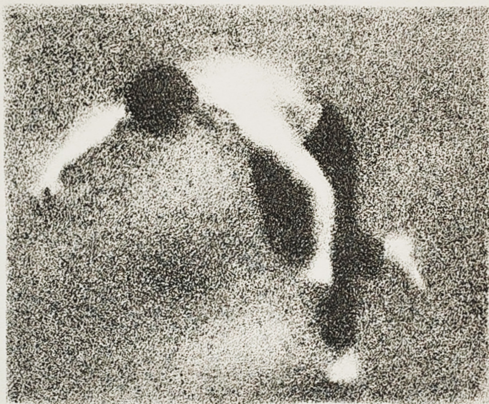
Litografija 2/1 "Bez naziva" Lara Trupinović, 2024.