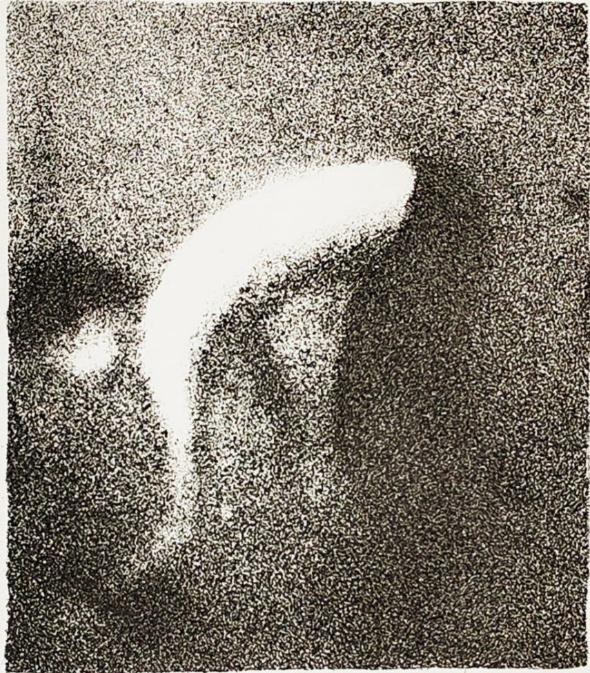
Litografija 2/5 „Bez naziva“ Lara Trupinović, 2024.