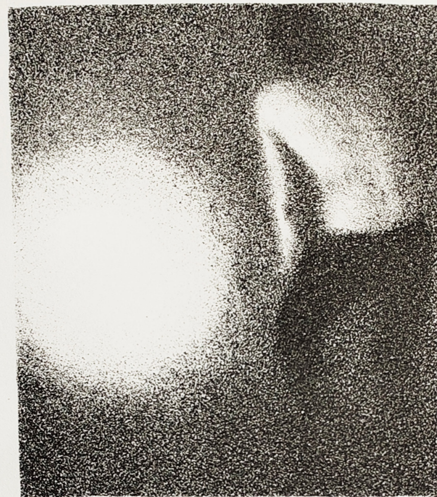
Litografija 1/5 "Bez naziva" Lara Trupinović, 2024.