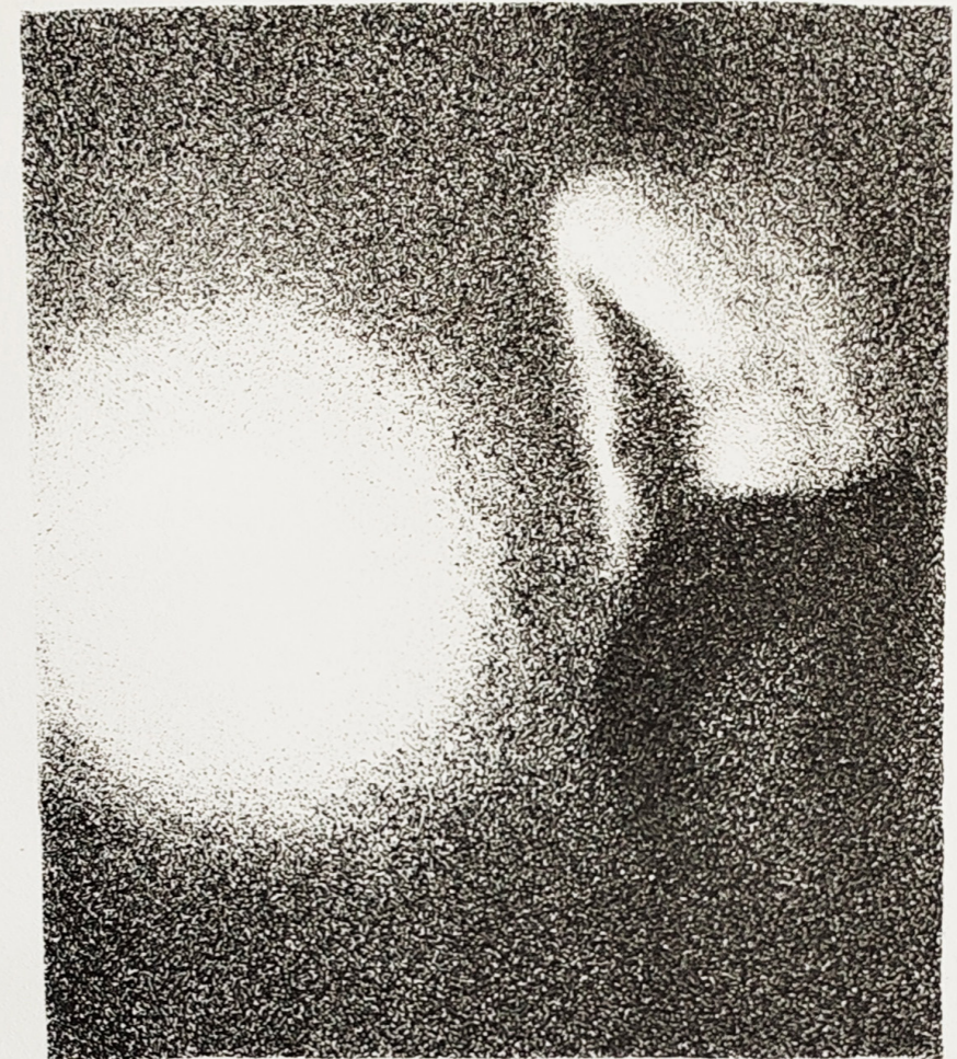
Litografija 1/5 "Bez naziva" Lara Trupinović, 2024.