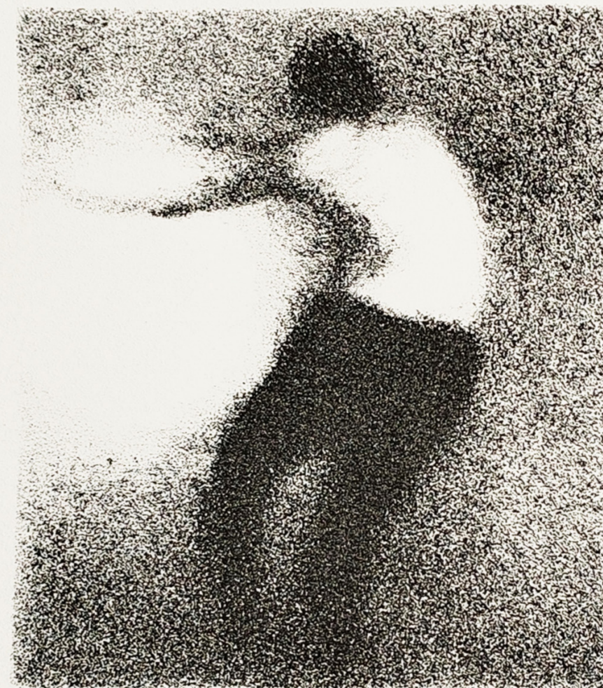
litografija 1/7 „Bez naziva“ Lara Trupinović, 2024.