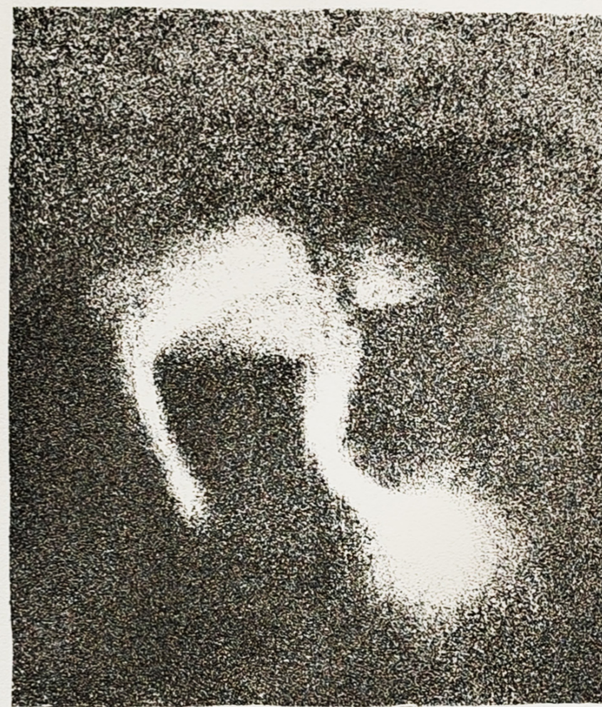
litografija 2/5 „Bez naziva“ Laru Jureković 2024.