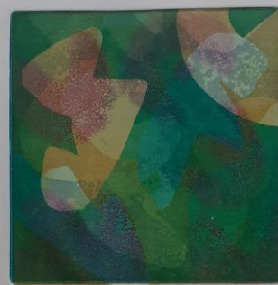
Unutarnji autoportreti, 2024.