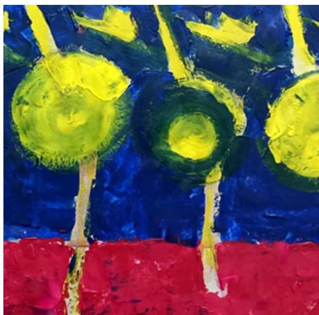
Ples živih, detalj