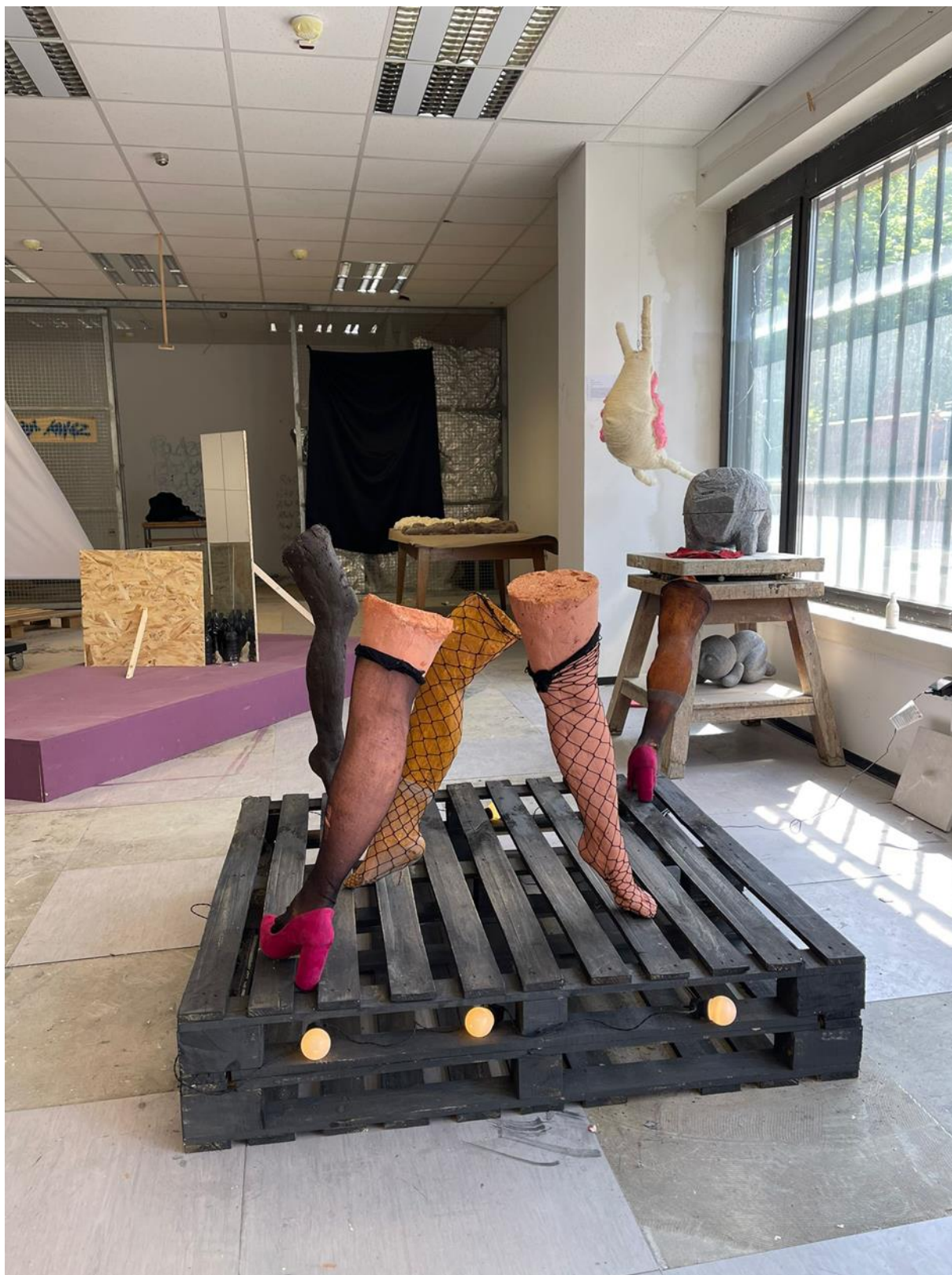
U tuđim cipelama, postament: D 120cm Š 80cm ukupna visina: 120cm