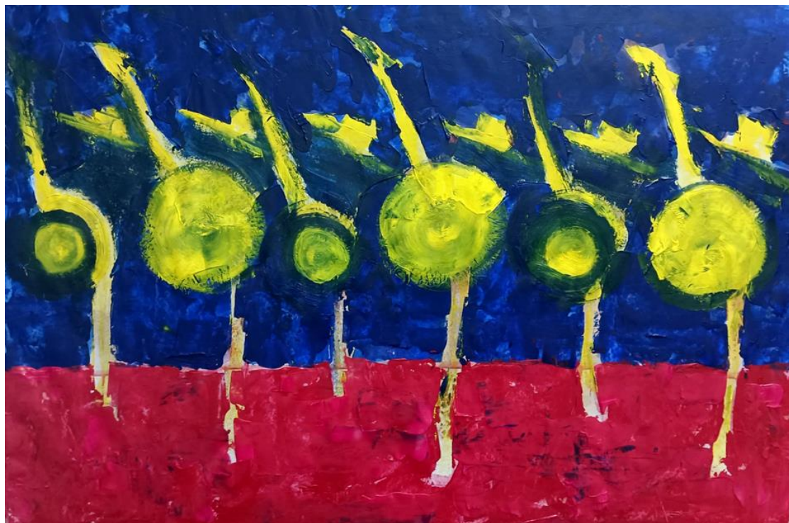
Ples živih, 2024, tehnika, cca 100x 70 cm

umjetničkom temom plesa mrtvih dajem kontrast suprotstavljajući mu naziv ples živih, kojim želim poručiti, iako je tijelo živo duša je upitne budnosti i svijesti.